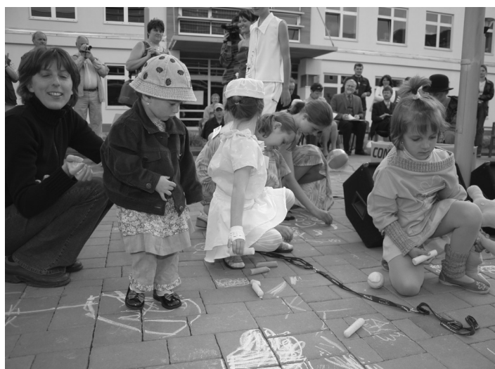
■ Den otevřených dveří 2005