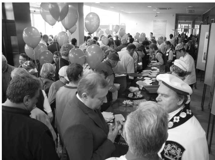
■ Den otevřených dveří 2005

Program: charitativní hra v kostky, sázení pamětního stromu, hudební vystoupení