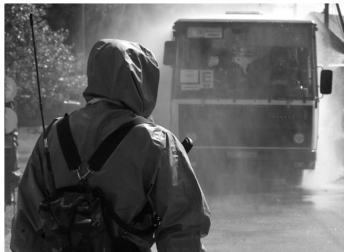
■ Průjezd autobusu dekontaminační zónou během cvičení HORIZONT 2004.