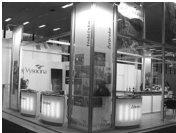
■ Stánek kraje Vysočina na veletrhu Regiontour v Brně