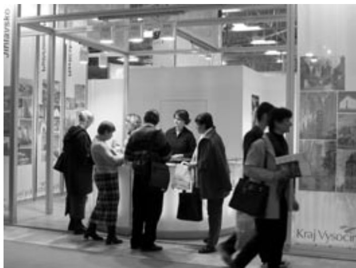
■ Stánek kraje Vysočina na veletrhu ITF v Bratislavě

Uvedená nabídka byla představena na veletrzích Regiontour