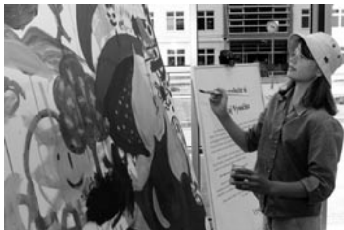
■ Vzpomínkou na historicky první den otevřených dveří je pamětní obraz, který malovali návštěvníci sídla kraje.