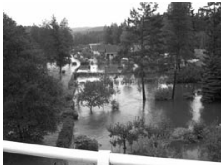
■ Ilustrační fotografie.