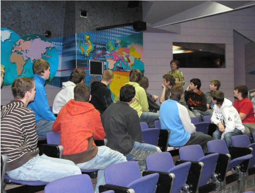
Exkurze JE Dukovany