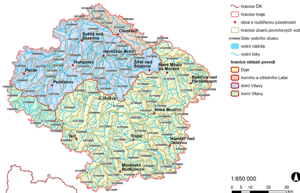
Obrázek 1 – vzájemný vztah územní působnosti kraje a oblastí povodí

Oblasti povodí jsou vymezeny přílohou č.1 vyhlášky č. 292/2002 Sb., ve znění vyhlášky č. 390/2004 Sb. Vyhláška oblastem povodí přiřazuje hydrologická povodí 3. řádu, hydrogeologické rajóny, územní působnosti správců povodí, správní obvody krajů a správní obvody obcí s rozšířenou působností, jakož i vztah k hlavním povodím České republiky a k mezinárodním oblastem povodí.