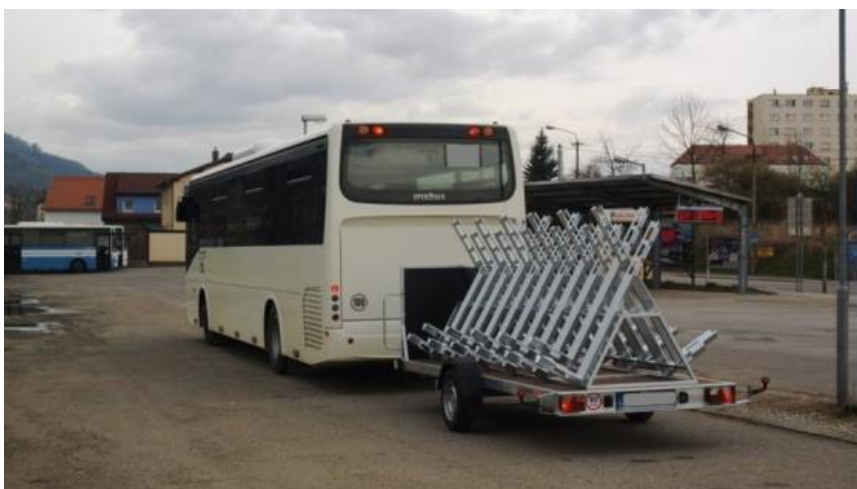
Obr. 1 Ilustrační foto – cyklobus – souprava pro přepravu jízdních kol

Poznámka: Pro potřeby kalkulace byl použit jako představitel cyklovozíku vyrobený na platformě automobilového přívěsného vozíku s nástavbou pro přepravu 20-ti jízdních kol s povolenou celkovou hmotností 750 kg.