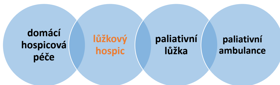
Obrázek 2: Naše chápání pojetí „komplexní paliativní péče“

Situaci aktuálního zastoupení forem poskytování péče o nevléčitelně nemocné v Kraji Vysočina shrnuje následující tabulka.