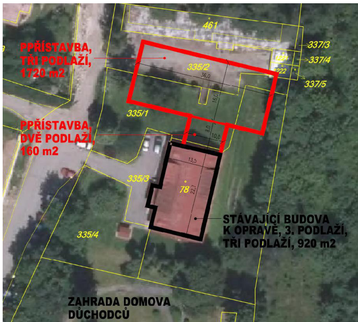
Obrázek 3: Letecký snímek zamýšleného pozemku pro hospic

Předpokládáme zachování stávající stavby jako technického zázemí hospice s přístavbou lůžkové části.