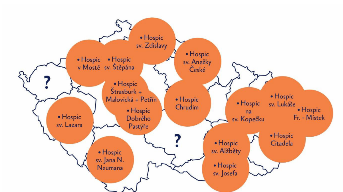
Obrázek 1: Mapa hospiců v ČR a dosažitelnost jejich služeb v dojezdové vzdálenosti do 50 km

Dnes chybí hospic už jenom v Kraji Vysočina a v Karlovarském kraji.