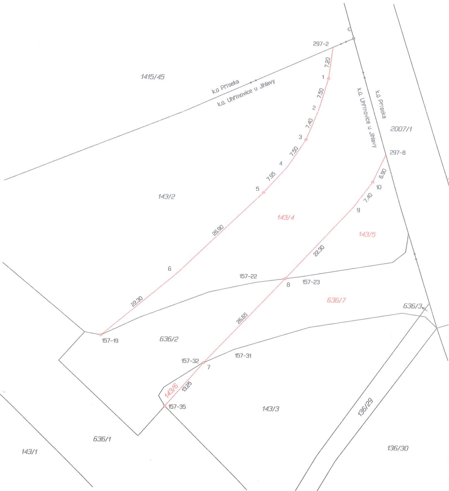
Seznam souřadnic (S-JTSK)