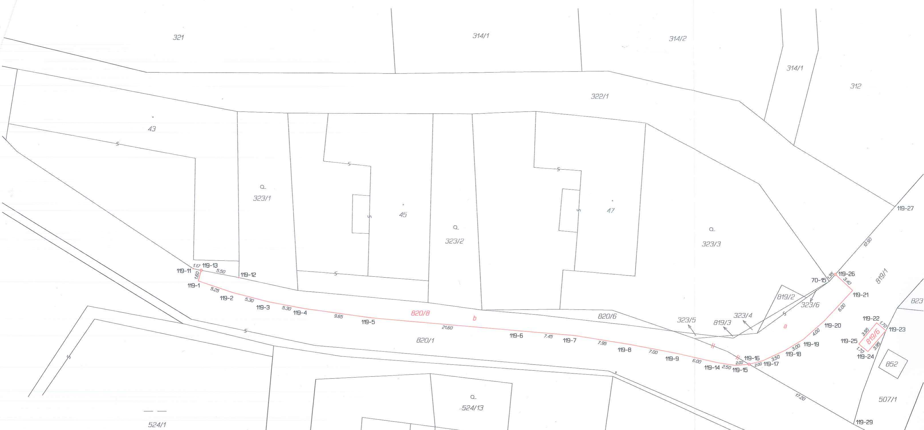
Seznam souřadnic (S-JTSK) Číslo bodu Souřadnice pro zápis do KN Y X Kód kv. Poznámka