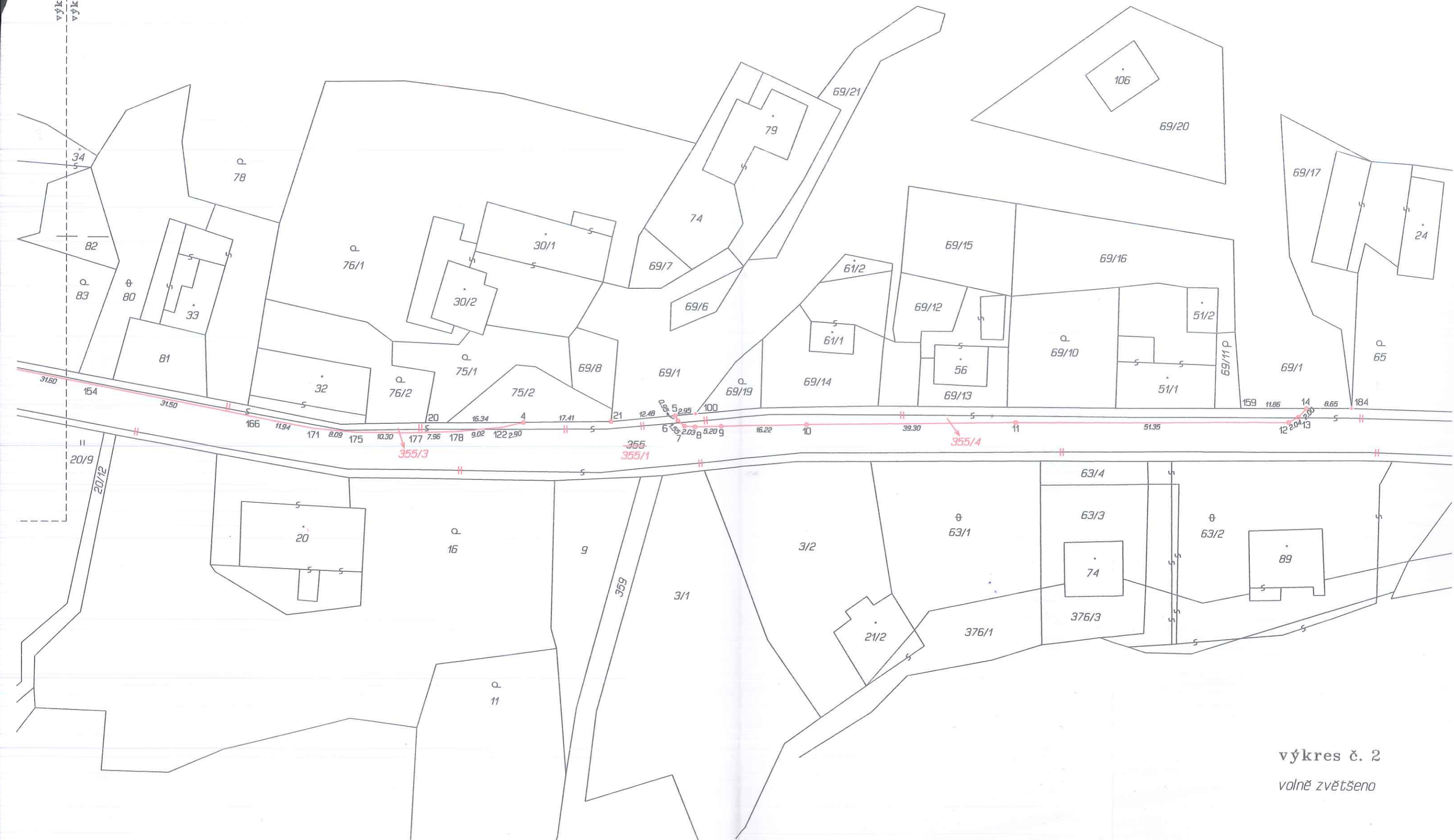
výkres č. 2 volně zvětšeno