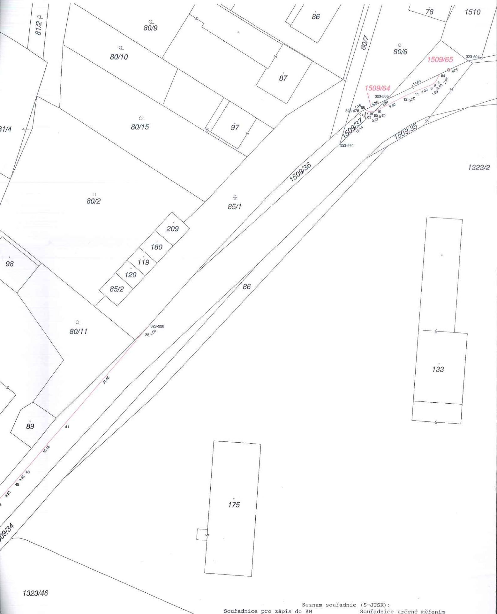
Seznam souřadnic (S-JTSK): Souřadnice pro zápis do KN Souřadnice určené měřením