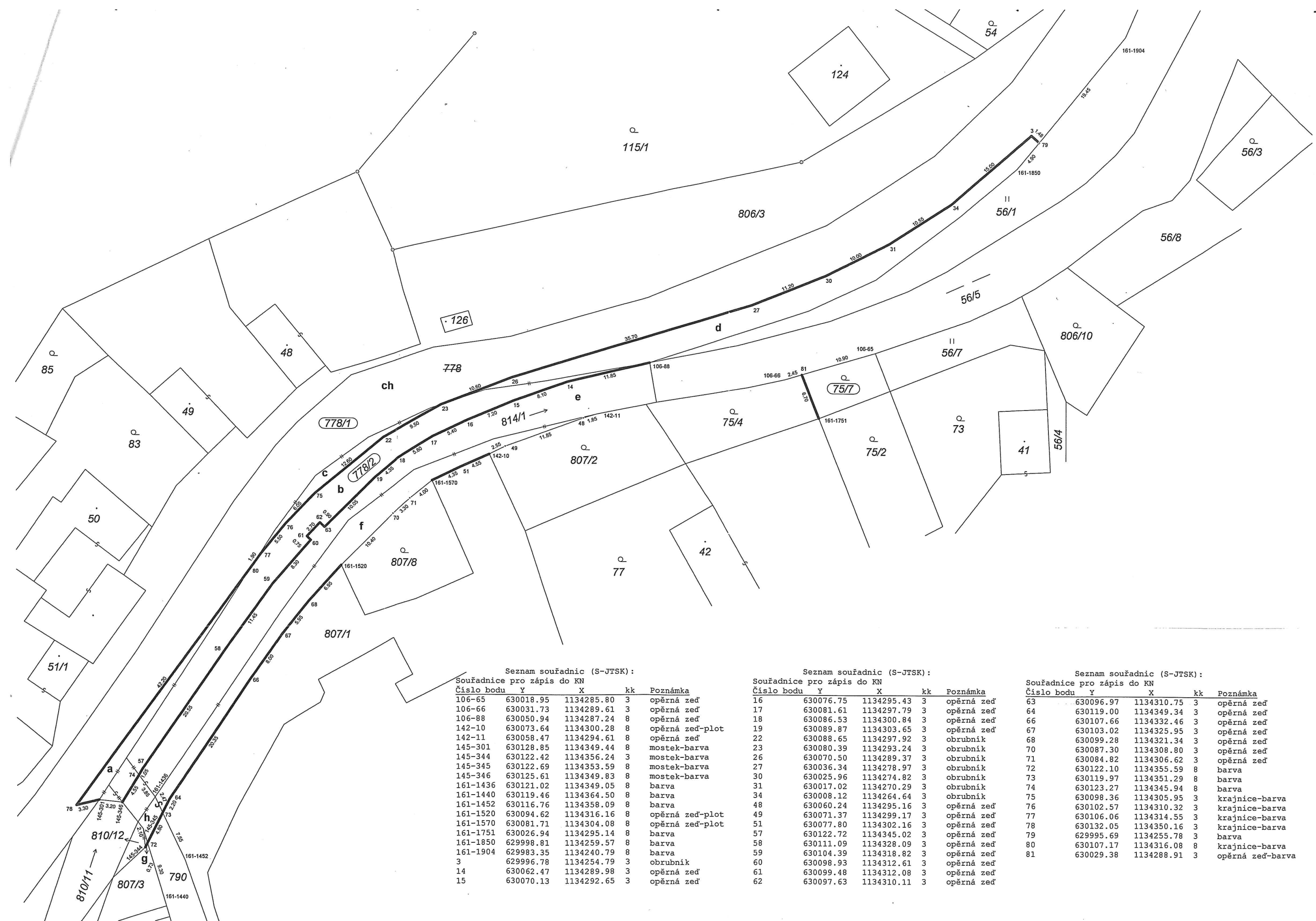
Seznam souřadnic (S-JTSK):