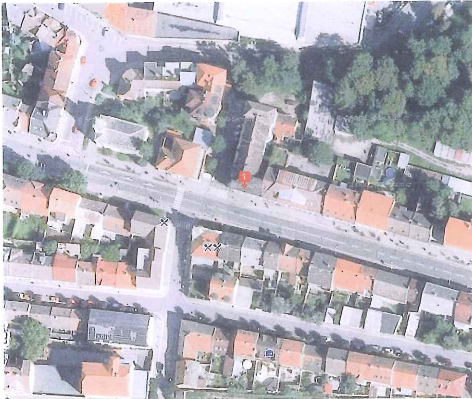
snímek předmětného území z letecké mapy s vyznačením nemovitosti