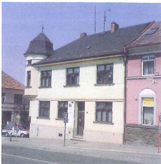
pohled na jižní průčelí, ulice Bráfova