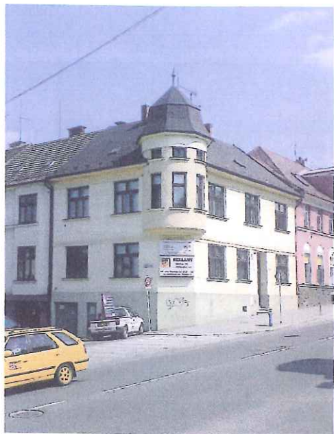
celkový pohled na budovu z jihozápadu