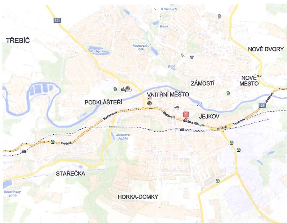
mapka města s lokalizací předmětného území