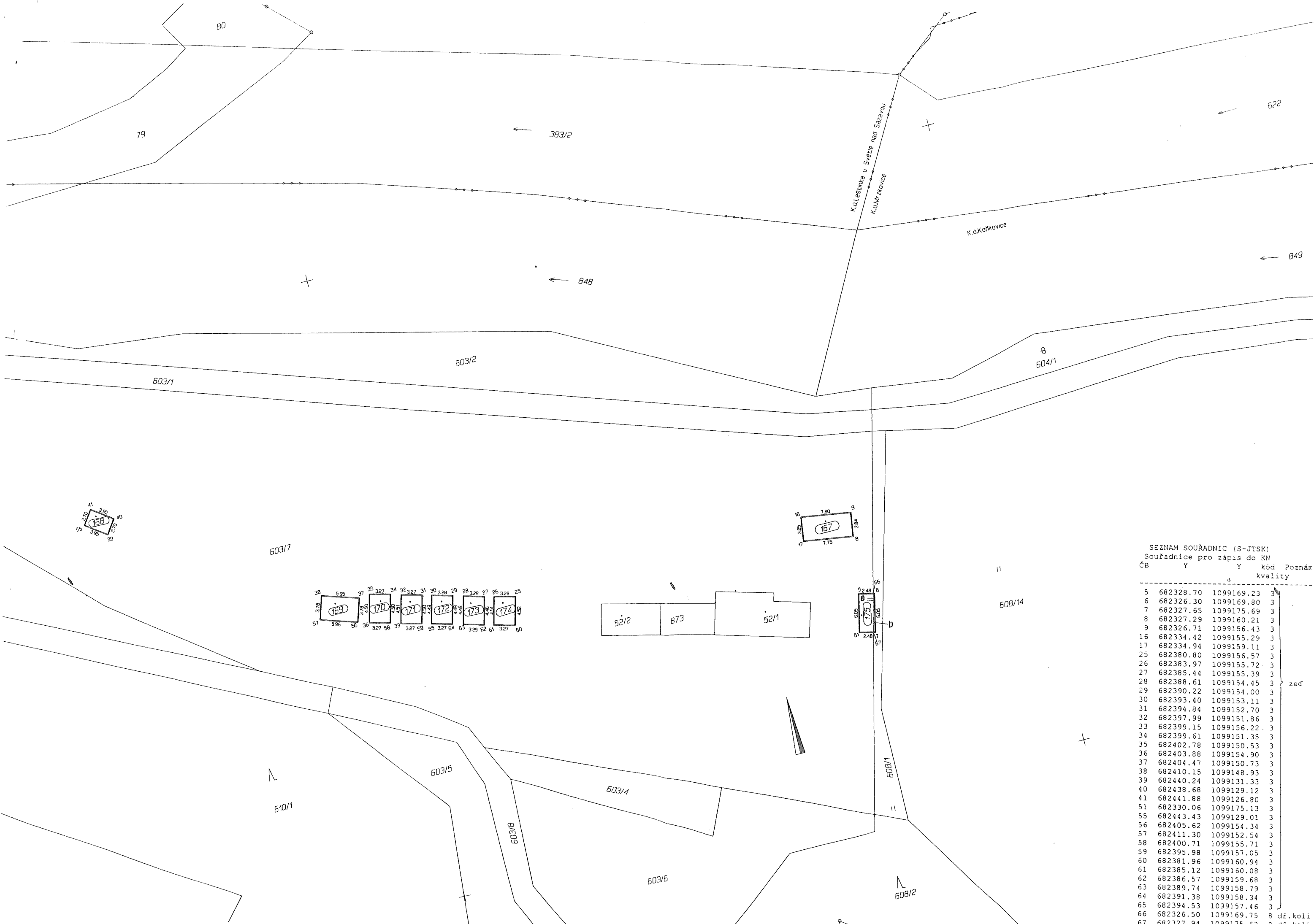
SEZNAM SOUŘADNIC (S-JTSK) Souřadnice pro zápis do KN ČB Y Y kód Poznámka kvality