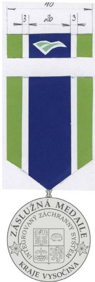
Záslužná medaile I. stupně