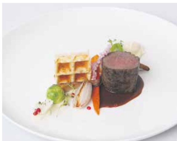
Takto vypadá vítězný recept ze soutěže Trophée Mille na talíři.

hřbetu, šalotky, jedlých kaštanů, vína a koňaku připravíme základ na šťavu, zvýrazníme zvěřinovým demi glace a zjemníme máslem. Předpřipravené maso opečeme ze všech stran na tuku, necháme odležet. Do výpeku nalijeme připravenou omáčku.