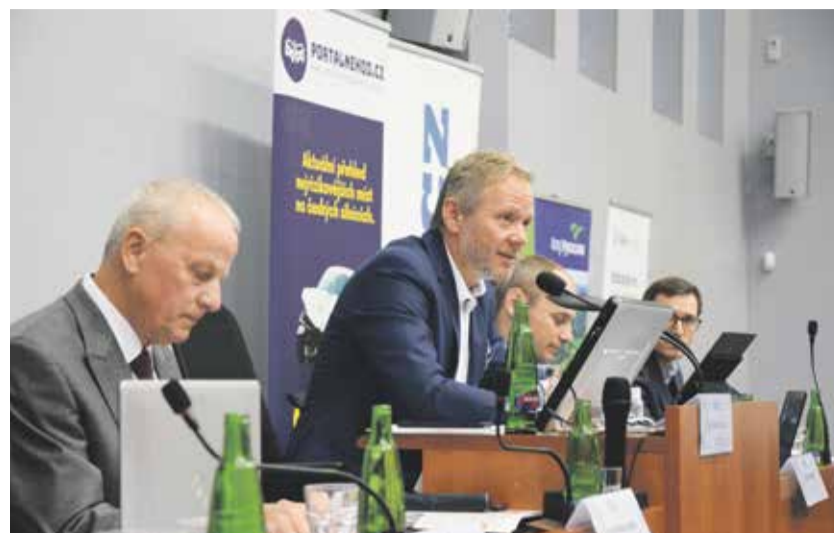
Na dopravní konferenci diskutovali zástupci policie, samospráv, silničáři a další hosté.

Na konferenci se podrobně rozebírala kritická místa na silnicích. Kraj Vysočina se snaží problémové úseky na silnicích ve svém vlastnictví průběžně upravovat. „Řadu původně nehodových křižovatek na krajských komunikacích jsme už předělali na kruhové objezdy nebo bezpečnější