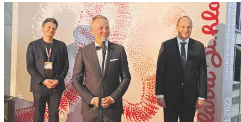
Hejtmán Kraje Vysočina Vítězslav Schrek je pravidelným návštěvníkem Mezinárodního festivalu dokumentárních filmů v Jihlavě.

Sedmadvacátý ročník Mezinárodního festivalu dokumentárních filmů Ji.hlava je minulostí. Rostoucí počet diváků, limitované ubytovací kapacity a omezená fyzická dostupnost filmových projekcí přiměly organizátory zvážit rozšíření festivalu z šesti na deset dní. A to hned od příštího roku.