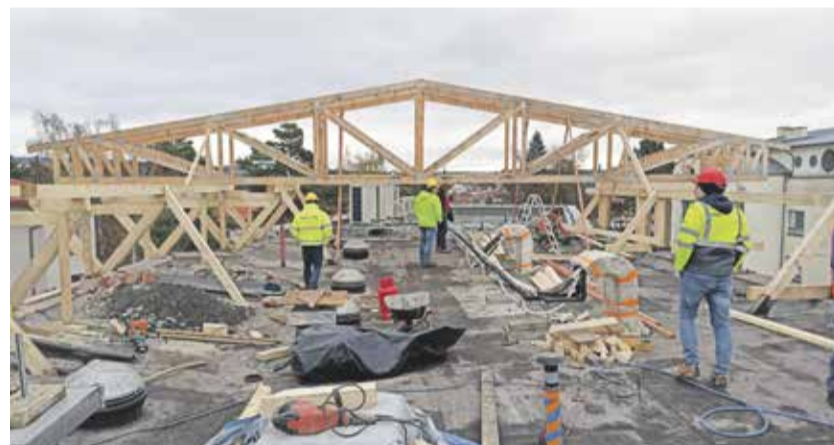
Instalace provizorního zastřešení nad vstupním pavilonem novoměstské nemocnice.

„Provizorní střešní konstrukce je vazníkové typu a bude potažená plechovým krytem. Prostory pod touto konstrukcí umožní dělníkům stavební práce. Ty mají být dokončeny podle harmonogramu v lednu příštího roku. Provizorní střecha bude poté