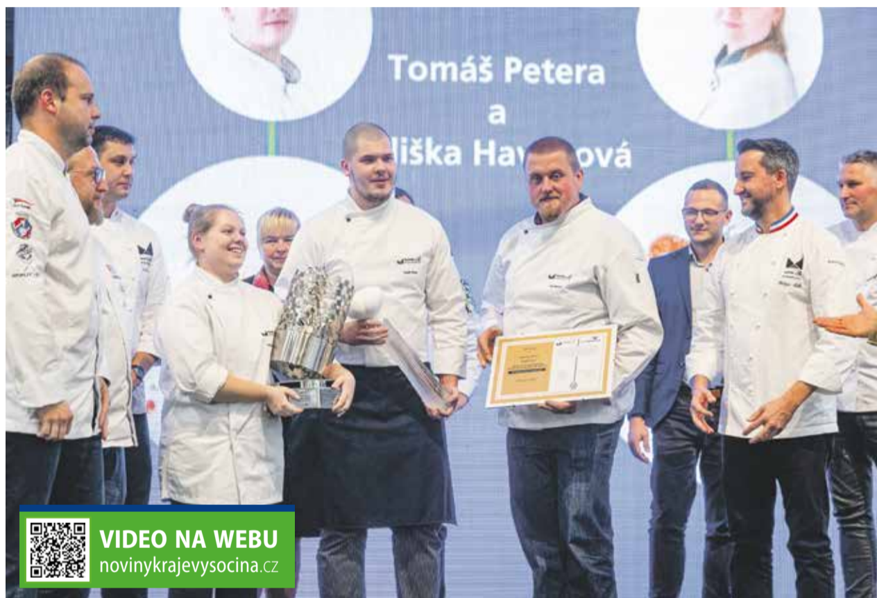
Vítězové národního kola ze žďárské školy přebírají společně se svým vedoucím trofej pro nejlepší.

„Těší mě úspěchy žáků z vyso- činských škol. Jde o národní kolo a letos přijely týmy až z Ústecké- ho kraje nebo z Jihomoravského kraje. Líbilo se mi, jak jsou dvojice soutěžících seřané, a zároveň jsem mezi jednotlivými týmy necí- til žádnou velkou rivalitu, spíše se navzájem inspirují,“ ocenil na mís- tě radní Kraje Vysočina pro oblast školství Jan Břížďala (Piráti).