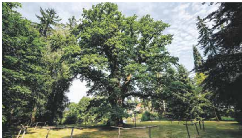
Dub letní v Proseči-Obořišti. Památný strom, který bude v parku zachován.