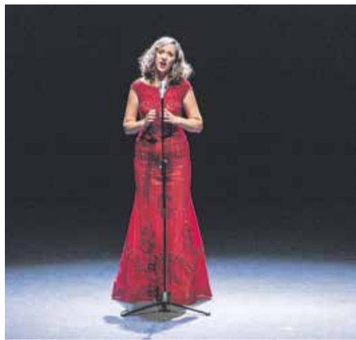
Oceněná operní pěvkyně Miroslava Časarová.