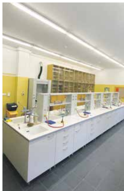
Novou chemickou laboratoř v Havlíčkově Brodě už studenti využívají.

„Na havlíčkovobrodském gymnáziu došlo ke zkvalitnění prostor pro výuku chemických praktik tak, jak to vyžaduje současná doba. Kromě badatelského centra tak má škola moderní zázemí pro praktickou výuku přírodovědných předmětů,“ poznamenal radní Kraje Vysočina pro oblast školství Jan Břížďala (Piráti), který se přijel do nové laboratoře podívat. Brzy budou hotové laboratoře také na gymnáziích v Jihlavě a v Moravských Budějovicích. Kraj Vysočina naplánoval na rok 2024 investice do modernizace