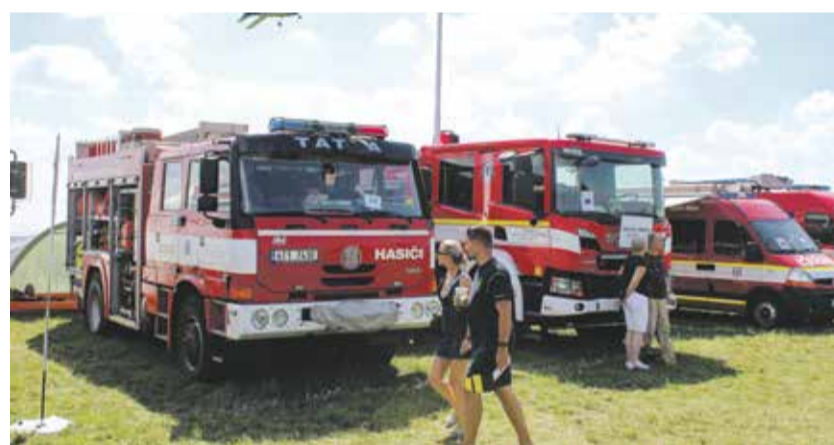
Pyrocar hasiči pořádají pravidelně s finanční podporou Kraje Vysočina.

Návštěvníci si mohli prohlédnout historické stříkačky, staré cisterny a dopravní automobily. Na hlavní ploše byly v sobotu k vidění ukázky práce složek integrovaného záchranného systému a představily se také novinky v oblasti hasičské techniky. Letectvo Armády České republiky vyslalo do vzduchu