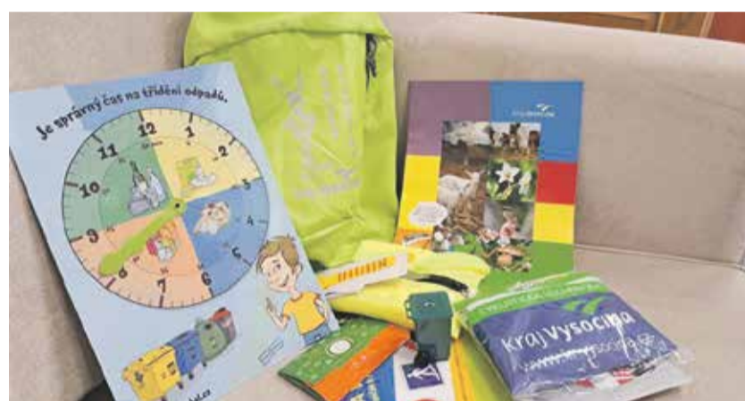
Školák Vysočiny. Toto dostanou noví prvňáčci ve školách po celé Vysočině.

Bude to jejich velký den. Tisíce dětí, které nastoupí v září do první třídy, dostanou od Kraje Vysočina dárek v podobě reflexního batohu. A v něm najdou pomůcky, které přispějí k bezpečnosti, například reflexní prvky na oblečení a cyklolékárníčku. To však není vše. Bude tam i pracovní sešit Ferda v autoškolce a školní potřeby včetně boxu na svačtinu anebo školních hodin. „Pomůcky v sadě budou využitelné při výuce. Kromě bezpečnosti jsme se při sestavování zaměřili také na ekologickou výchovu dětí – edukaci správného třídění nebo například na pravidla správného chování v lese,“ vyjmenovává radní Kraje Vysočina pro oblast školství, mládeže a sportu Jan Břížďala (Piráti). Pro děti je připraveno na 5 600 batohů,