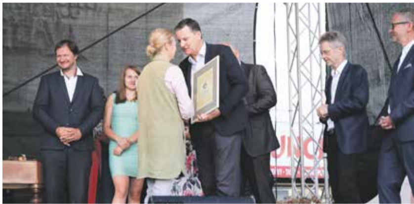
V minulosti se ocenění Regionální potravina předávalo na podzimních Dožínkách v Jihlavě.