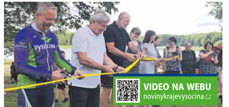
Slavnostní přestřižení pásky a cyklojízda. V Pelhřimově otevřeli cyklotrasu.

Cyklisté a inline bruslaři se v červenci poprvé projeli po nové cyklostezce kolem rybníka Stráž v Pelhřimově. Přes kilometr dlouhá cyklostezka vyšla na třicet osm milionů korun. „Přispěli jsme třemi miliony korun. A nebude to jediná podpora z Kraje Vysočina. V Pelhřimově připravujeme ještě další cyklostezku,“ oznámil hejtmán Kraje Vysočina Vítězslav Schrek (ODS+STO) při slavnostním otevření. Rozvoj cykloinfrastruktury hejtmanství podporuje, přispívá na projektovou dokumentaci potřebnou pro vybudování cyklostezek a cyklotras, ale také na samotnou realizaci. V současné době se v Pelhřimově buduje