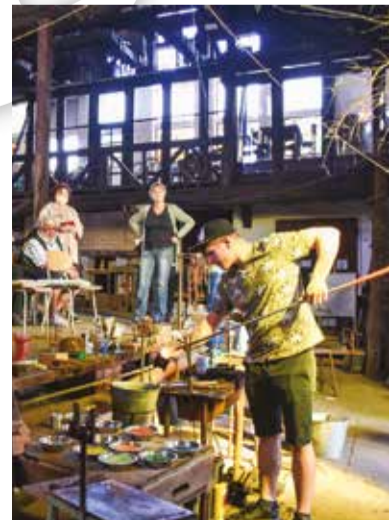
Ve sklárně Hut' Jakub zažijete výrobu na živo.

Neváhejte a pojďte s námi objevovat krásu umění přímo tam, kde vzniká!