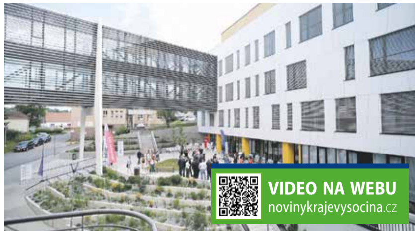
Nový pavilon v pelhřimovské nemocnici byl navržen pomocí BIM technologie a je postaven v pasivním standardu, což není u veřejných budov zcela běžné.

Stavba za téměř 600 milionů korun je koncipována jako pasivní dům a disponuje i zelenou střechou. „Venkovní žaluzie,