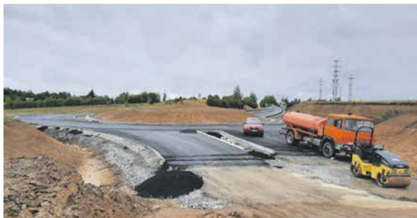
Práce na jižní části jihovýchodního obchvatu Jihlavy pokračují podle harmonogramu. Nyní jsou před zprovozněním nové okružní křižovatky.

Řidiči se už brzy projedou po dvou nových okružních křižovatkách, které vznikají na budoucím jihovýchodním obchvatu Jihlavy. Ty ohraničují dvouapůlkilometrovou část obchvatu zvanou jih, kterou dělníci staví od loňského