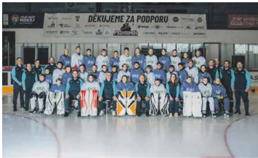
Hokejisté byli rozděleni do dvou týmů bez ohledu na národnost. Kemp si užili.