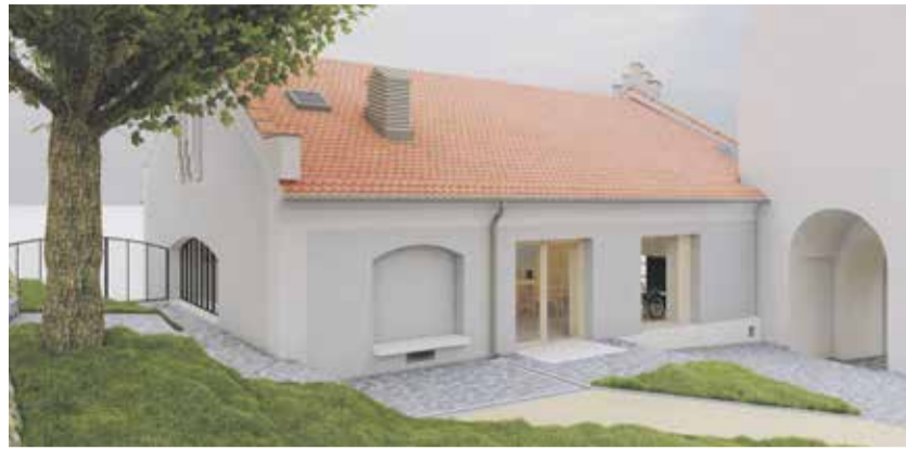
Takto by mělo vypadat nové návštěvnické centrum hradu Kámen. VIZUALIZACE: TRANSAT ARCHITEKTI

Po uzavření hradu začalo stěhování exponátů a další navazující práce. Součástí rozsáhlé opravy bude také vybudování moderního návštěvnického centra, které poslouží nejen turistům, ale i hradnímu týmu. To vznikne v místě bývalého pivovaru nedaleko vstupní brány do hradního areálu.