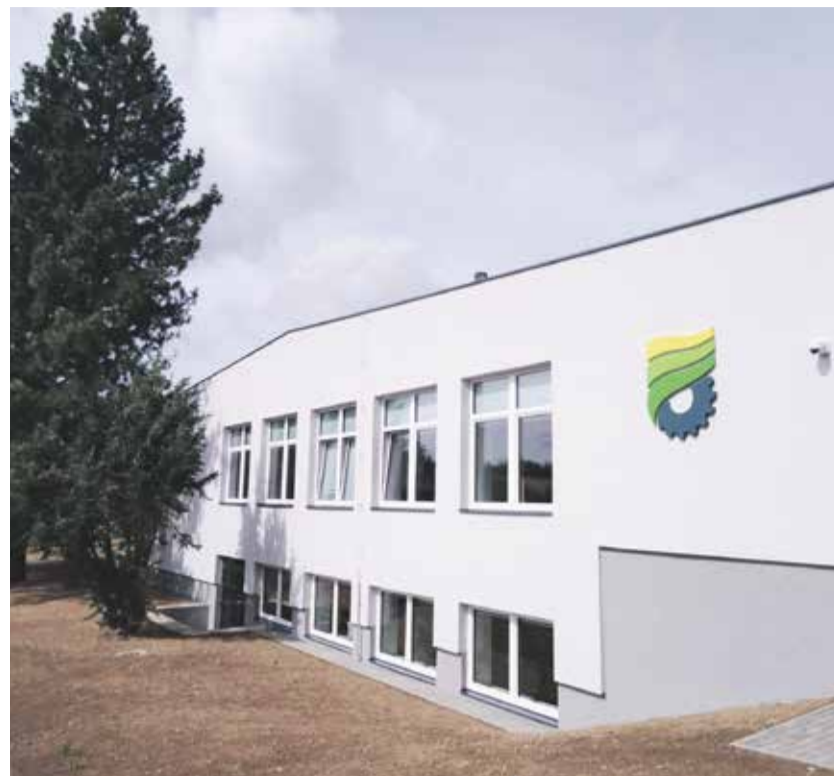
Oprava pláště budovy středněškolských dílen v Bystřici nad Pernštejnem se povedla.

Nyní čeká školu ještě výměna 215 oken v hlavní budově. Důvodem je obtížná manipulace s křídly původních oken, komplikované větrání i vytápění.