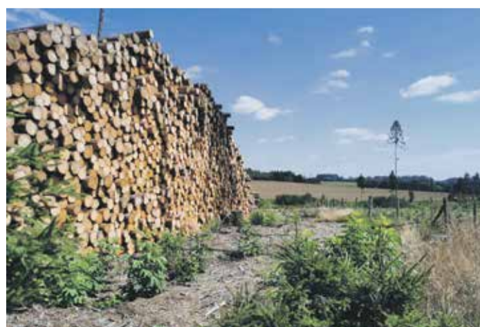
■ Kdo vlastní les a má ruce a nohy, tráví v posledních letech v lesích všechn svůj „volný“ čas. Z lesů na Vysočině se postupně stávají holé plániny, v lepším případě už nově osázené s oplocenkami.

Na webu ministerstva najdou vlastníci lesů výzvu k podávání žádostí i přesné podmínky pro získání finančního příspěvku. Žadatelům je k dispozici stručná příručka s nejdůležitějšími ze stanovených podmínek. Všechny informace jsou i na webu Kraje Vysočina. „Oproti minulému dotačnímu titulu, který zahrnoval období 4. čtvrtletí 2017 – 4. čtvrtletí 2018, nastala změna v sazbě finančního příspěvku. Žadatelé teď nemusí rozlišovat, ve kterém kvartálu nahodilou těžbu provedli. Sazba příspěvku za rok 2019 je jednotná a činí 398 Kč za m 3 dřeva,“ upřesnil krajský radní pro oblast lesního hospodářství Martin Hyský (ČSSD).