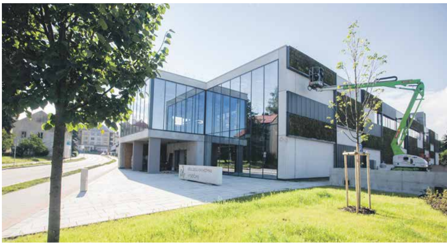
■ Novou krajskou knihovnu obklopuje zeleň, a to doslova. Trvalky rostou i z fasády.

Poslední detaily ladili na přelomu července a srpna pracovníci firmy Zlínstav, dodavatelé nové Krajské knihovny Vysočiny v Havlíčkově Brodě. Stavbu za 174 milionů korun nedaleko Kulturního domu Ostrov v blízkosti řeky Sázavy v prvním prázdninovém měsíci dokončili a vše se připravuje na kolaudaci. Kraj Vysočina jako investor vyčlenil finance potřebné na výstavbu kompletně ze svého rozpočtu.