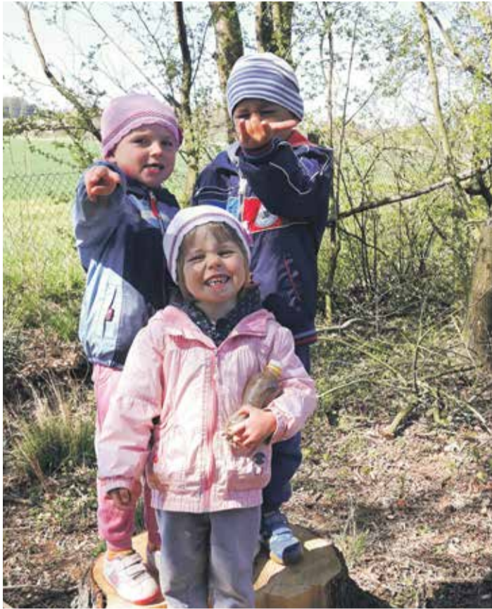
■ Kolem domova je rozsáhlý park, kde děti tráví volný čas.

Ve čtyřech rodinných skupinách jsou zastoupeny obě role