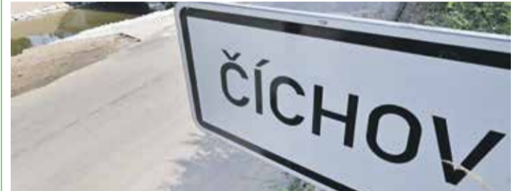
■ Nový most přes řeku Jihlavu za 22 milionů korun otevřeli zástupci Kraje Vysočina a obce v červenci roku 2009. Po deseti měsících práce opět spojil obě části obce na Třebíčsku.