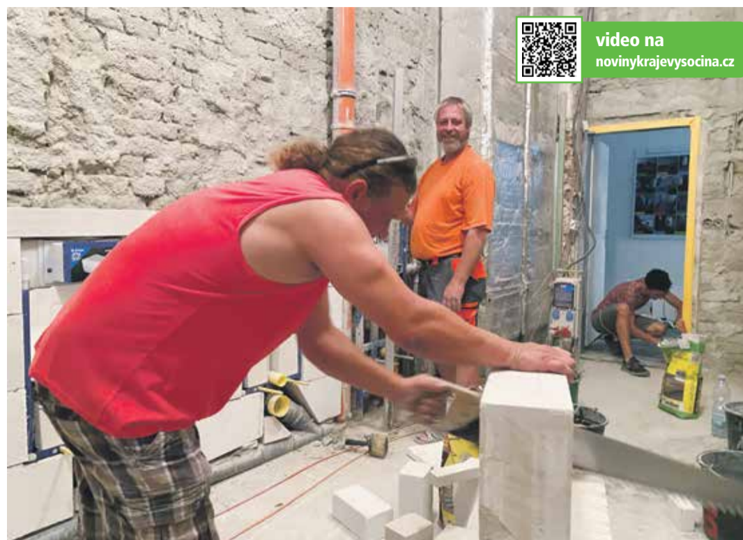
■ Zedníci připravují zbrusu nové toalety pro studenty Gymnázia Třebíč.

V Moravských Budějovicích se na budově Gymnázia a SOŠ finišuje s kompletní výměnou oken a podlah, studenti Střední školy stavební Třebíč budou mít se začátkem školního roku opravenou tělocvičnu a nádvou, Gymnázium Třebíč bude využívat zrekonstruovanou přístavbu, ve které se nachází studovna i badatelské centrum. Ve Žďáře nad Sázavou pokračuje projektování budoucí víceúčelové sportovní haly pro VOŠ a SPŠ, škola bude moci využít nově opravené dílny ve Strojírnické ulici. Po dvou letech se blíží ke konci oprava Rytířského sálu Umělecko-průmyslové školy Helenín. SPŠ a SOU Pelhřimov začne už letos ubytovávat žáky odloučeného pracoviště v Kamenici nad Lipou