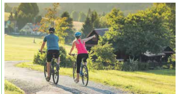
■ Krásná příroda láká na Žďársko nejen cyklisty.