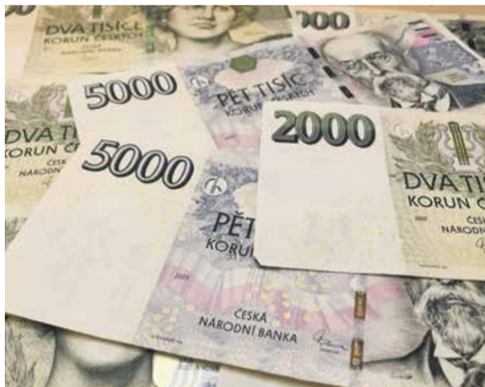
■ Rozpočet na rok 2021 má krajské zastupitelstvo schvalovat v prosinci.

I přes nepříliš pozitivní výhled však Kraj Vysočina počítá s realizací zásadních investic