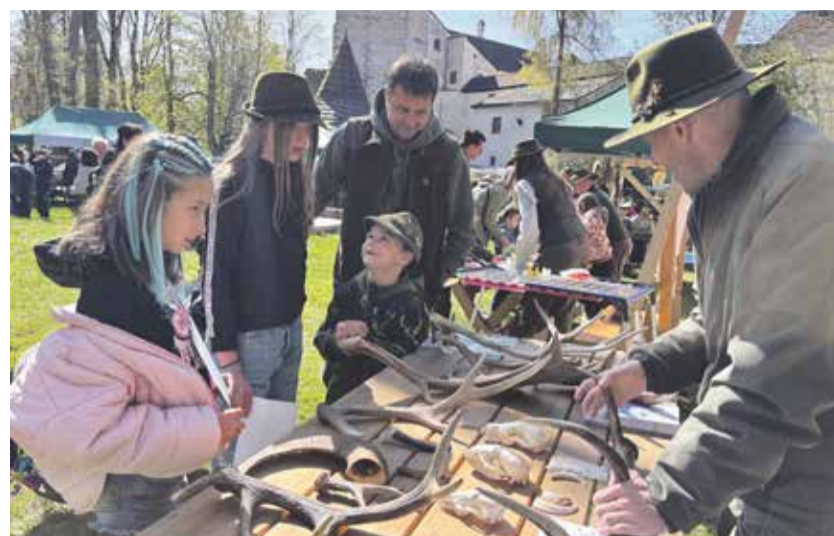
Předhradí Roštejna zaplnily poslední dubnovou sobotu rodiny s dětmi. Zájemci si vyzkoušeli, jak jsou na tom se znalostmi z myslivosti.

Už o prodlouženém červencovém víkendu se návštěvníci hradu mohou těšit na další oblíbenou