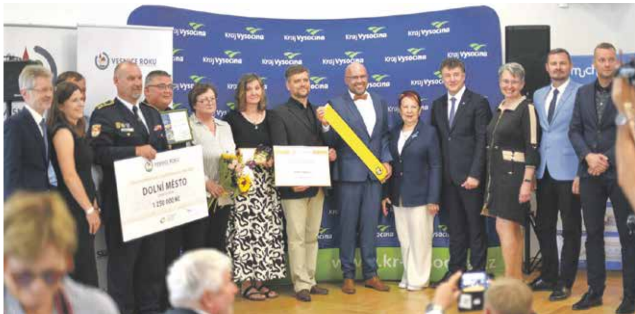
Loňské předání ocenění pro vítěznou obec Dolní Město.

Velký zájem provází letošní ročník soutěže Vesnice roku. Z Vysočiny se přihlásilo 18 obcí, které chtějí získat zlatou stuhu a finanční prémii pro nejlepší vesnici. Komise v těchto týdnech obchází jednotlivé obce, krajský vítěz bude známý v průběhu června.