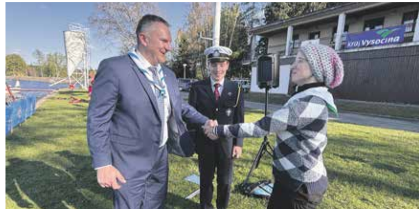
MISTROVSTVÍ V JACHTINGU. Největší vodní plocha na Vysočině hostila Mistrovství České republiky v jachtingu na Velkém Dářku. Na rybníku zápolili o prodlouženém prvním květnovém víkendu vodní skauti.