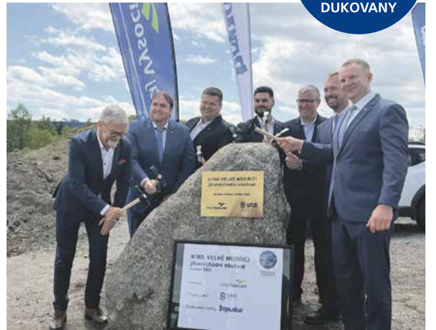
Symbolickým poklepáním na základní kámen zahájilo vedení Kraje Vysočina spolu s partnery stavbu obchvatu Velkého Meziříčí.

Vysočina v posledních letech připravuje a staví obchvaty napříč regionem. Větší tempo těmto investicím dává také příprava tras pro přepravu nadrozměrných komponentů ke stavbě nových bloků