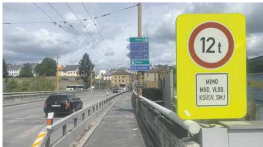
Na Znojemském mostu platí omezení pro nákladní auta. V roce 2027 bude frekventované místo uzavřené pro dopravu, kraj tu vybuduje úplně nový most.

„Zbourání mostu plánujeme na jaře 2027, do té doby budeme mít hotovou objízdnu trasu pro MHD, Veřejnou dopravu Vysočiny i složky integrovaného záchranného systému. Ta povede po provizorní komunikaci nedaleko stávajícího mostu,“ popsal náměstek hejtmána