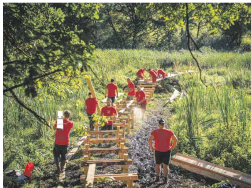
Ruku k dílu přiložilo na 170 zaměstnanců společnosti IP Polná.

Do akce se zapojilo přibližně 170 kolegů a společně jsme odpracovali více než 1 000 hodin práce. Nejnáročnější bylo vše dobře zkoordinovat, aby na sebe jednotlivé práce navazovaly. Všichni viděli, že za jediný den dokážeme společnou silou proměnit kus