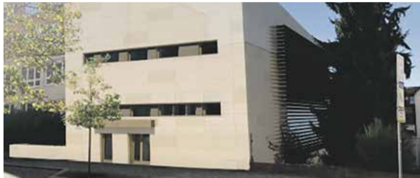
Vizualizace nové budovy tělocvičny. Hotová bude v roce 2029.

Gymnázium v Havlíčkově Brodě dlouhodobě řeší nevyhovující technický stav tělocvičny. Škola také chybí prostor pro větší kulturní akce a jídelna. Díky plánované nové budově se všechny tyto komplikace vyřeší. „V místě současné velké tělocvičny postavíme nový dvoupodlažní bezbariérový objekt. Předpokládaná cena investiční akce činí přibližně 90 milionů korun bez DPH,“ upřesnil náměstek hejtmána Kraje Vysočina pro oblast majetku Otto Vopěnka (ANO 2011). V přízemí nové budovy vznikne tělocvična s tribunou pro téměř sedmdesát