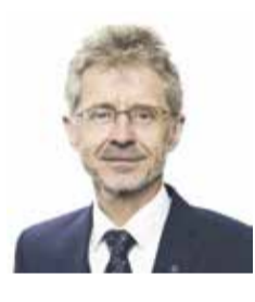
Miloš Vystrčil (Společně se Starosty pro občany) předseda Senátu, zastupitel Kraje Vysočina