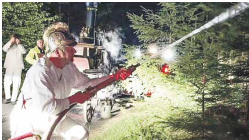
Na rekord dohlížel komisař z Agentury Dobrý den. Po necelých šestnácti hodinách se na konci dlouhého řetězu konečně objevila voda.

Dobrovolným hasičům se druhou květnovou sobotou povedlo překonat šestnáct let starý rekord v dálkové dopravě vody. Na akci Vrátime Svatku do pramene se jim podařilo přečerpat vodu z řeky Svatky pod mostem v Bořiňově až k jejímu prameni ve Žďárských vrších.