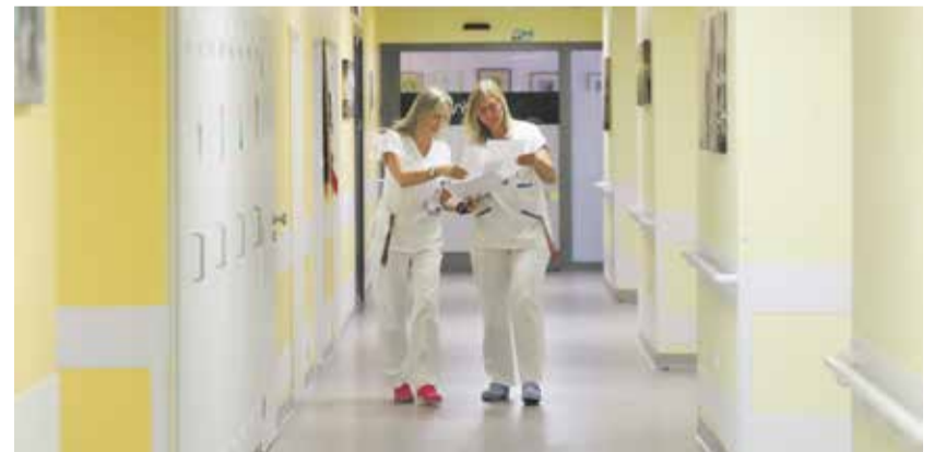
Komplexní onkologické centrum Nemocnice Jihlava zajišťuje moderní a specializovanou léčbu pacientům s rakovinou. Spolupráce s brněnským ústavem zajistí vzájemné konzultace a ještě lepší péči.

„Tato spolupráce je pro naše pacienty opravdu přínosem. Umožní nám rozšířit spektrum péče, zajistit moderní zákroky a posílit odbornou podporu během celé léčby,“