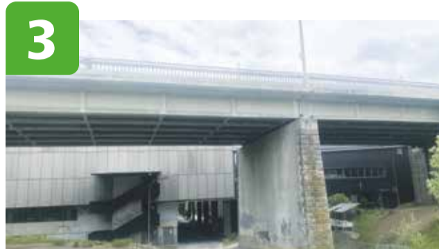
Znojemský most čeká demolice