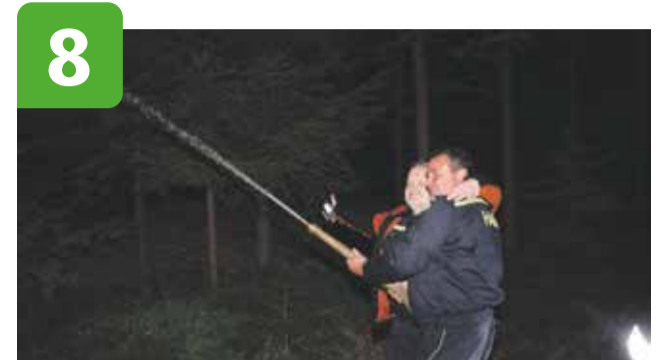
Hasiči si připsali rekord