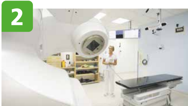
Lepší péče o onkologické pacienty