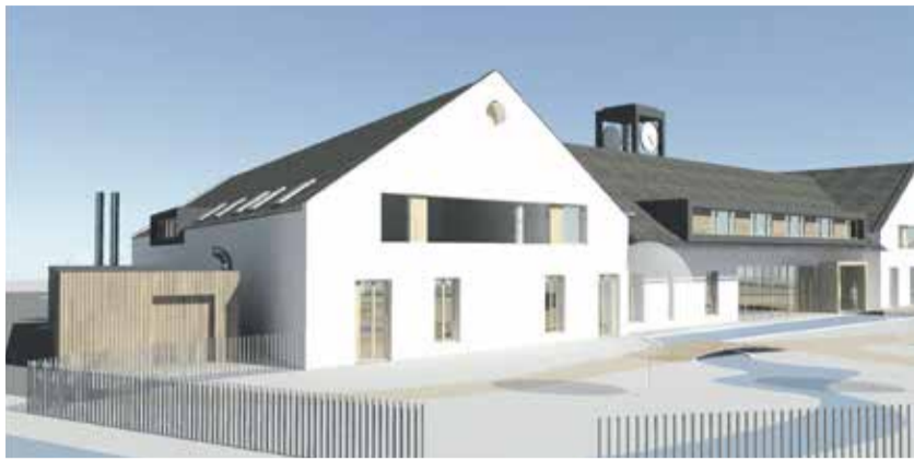
Vizualizace budoucí přístavby domova pro seniory ve Ždírci. Kraj zařadil akci do letošního rozpočtu.