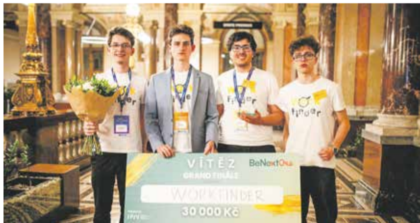
Vítězný tým. Vyvinuli aplikaci na vyhledávání brigád.