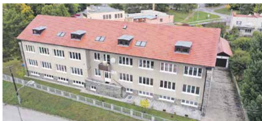
Pohled na hlavní budovu jemnického dětského domova, která dozná velkých změn.

„Prostřednictvím půdní vestavby rozšíříme stávající prostory personálního zázemí. Do podkroví se přesune ředitelna i sklady. Přestavbou nově vzniknou také dva cvičné byty, kde se děti budou učit samostatnosti, starat se o domácnost a její financování. Ty zatím fungují pouze na odloučeném pracovišti v Budkově,“ nastínil radní Kraje Vysočina pro oblast majetku Karel Janoušek (ODS+STO). Projekt počítá také s karanténním pokojem pro infekčně nemocné děti.