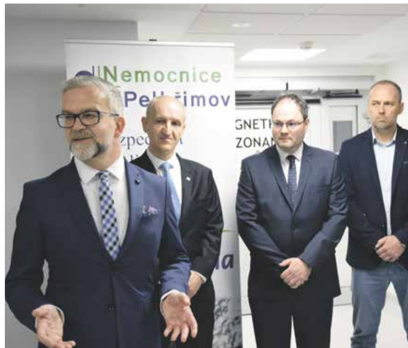
Při otevření pracoviště byl přítomen náměstek hejtmana Kraje Vysočina Vladimír Novotný (vlevo), vedeni Nemocnice Pelhřimov a zástupci dodavatelských společností.

Nemocnice Pelhřimov otevřela v první půlce dubna nové pracoviště magnetické rezonance. To je vybavené technikou z evropského projektu REACT-EU, která vyšla na téměř 36 milionů korun. „Rozšíření nejmodernějších diagnostických služeb posune hranice péče o zdraví zase o něco výše. Díky tomuto vybavení budou zdravotníci pracovat s rychlejšími a kvalitnějšími informacemi,“ sdělil při otevření hejtmán Kraje Vysočina Vítězslav Schrek (ODS+STO). Magnetická rezonance poskytne větší komfort pacientům pelhřimovské nemocnice, nebudou muset cestovat na vyšetření do okolních nemocnic. Zároveň se zlepší dostupnost