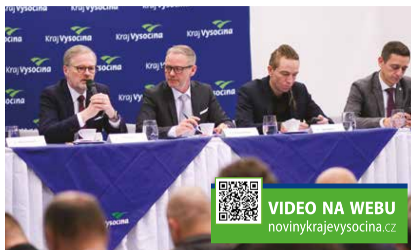
Třebíč hostila důležité setkání politické reprezentace kvůli dostavbě Dukovan.

„Dobře si uvědomujeme, jak bude tento obrovský projekt náročný. Proto se snažíme