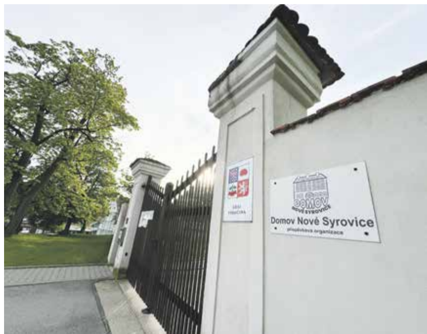
Rekonstrukce hospodářského křídla zámku potrvá rok.