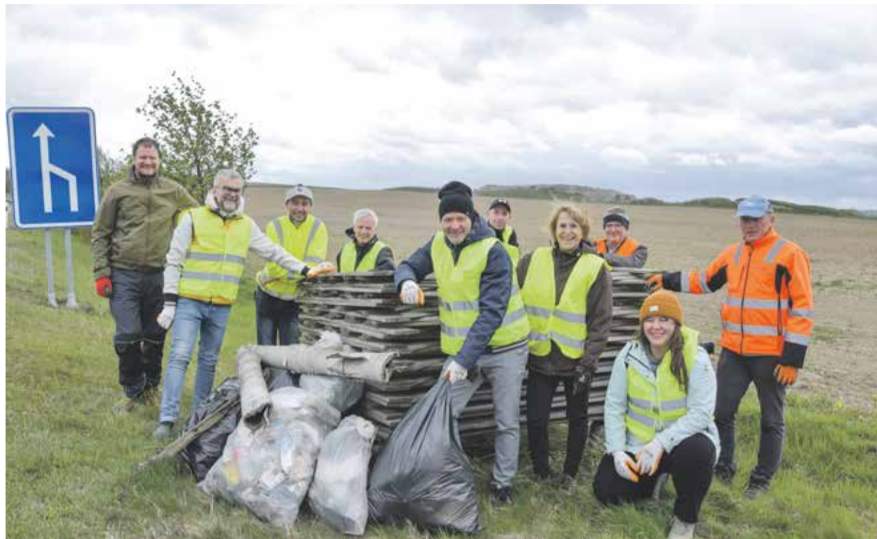
Do sběru odpadků kolem silnic se každoročně zapojují radní Kraje Vysočina v čele s hejtmánem.