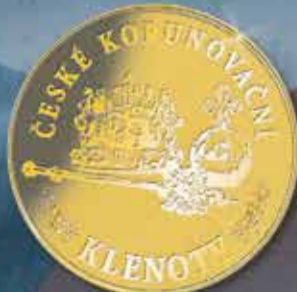
společná zadní strana