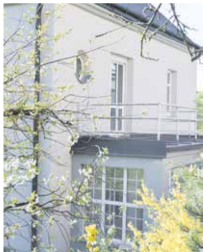
Nový domov v Jihlavě pro klienty z ústavního zařízení Domov Černovice – Lidmaň.

Už během letních prázdnin by se měla do nově zrekonstruovaného bytového domu v Jihlavě na Fibichově ulici přestěhovat pětice dětských klientů s mentálním postižením z ústavního zařízení Domov Černovice – Lidmaň. Najdou zde svůj nový domov, který bude mnohem lépe odpovídat běžné