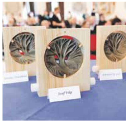
Ocenění pro mistry řemesla a Křemešnickou pouť.

Truhlář a restaurátor Filip spolu se svým synem vyrábí různé historické repliky, opravuje, konzervuje a restauruje starožitný nábytek. Učí obor restaurování na Vyšší odborné škole restaurátorské v Brně a předává své řemeslo dalším generacím. Jaroslav Těsnohlídek ve své dílně pořádá workshopy, kde má každý