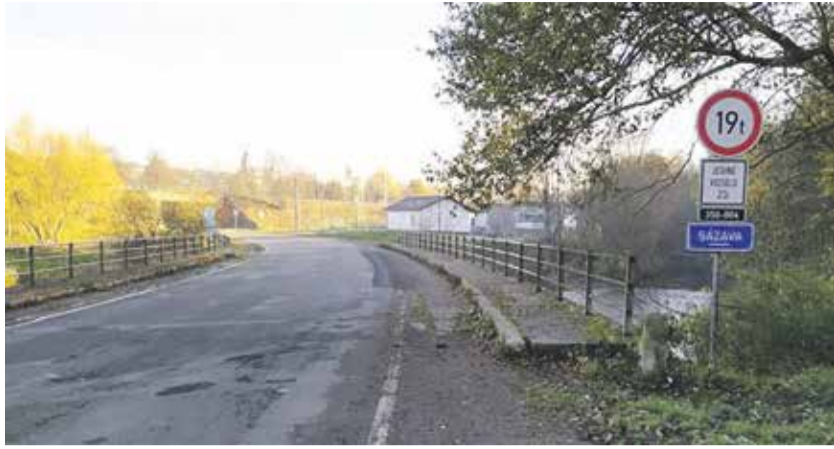
Dělníci pracují na mostě v Příbyslavi na Havlíčkovobrodsku.

Krajská správa a údržba silnic Vysočiny (KSÚSV) začala s dopravními investičními akcemi po celé Vysočině. Letos se pustí do oprav silnic II. a III. třídy v celkové délce 128,5 kilometrů. Kromě silničních povrchů dělníci zrekonstruují celkem 52 mostů. Další stavby Kraj Vysočina realizuje ve vlastní režii. „Půjde o zhruba padesát úseků napříč celým krajem. Největší porci kilometrů opraví silničáři na Pelhřimovsku a Žďársku. Velkou část položek tvoří práce na mostech,“ uvedl náměstek hejtmána