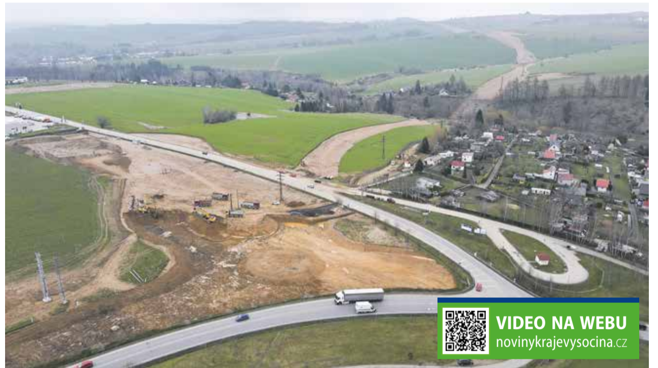
Vznikající okružní křižovatka na křížení silnic I/38 a II/523 v lokalitě V Ráji.