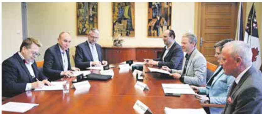
Na kraji odstartovali platformu Vodíková Vysočina.

Vodíkové technologie jsou v poslední době považovány za velice perspektivní. Jejich velkým plusem je to, že přispívají k dekarbonizaci průmyslu i dopravy. Právě vodík je jedním z pilířů k dosažení evropských cílů uhlíkové neutrality v roce 2050. „Uplatnění vodíkových technologií v rámci kraje vidím zejména v oblasti energetiky a dopravy. Proto se kraj rozhodl spolu s dalšími klíčovými hráči regionu uzavřít memorandum o spolupráci v oblasti výroby, skladování a využívání vodíkových technologií napříč odvětvími,“ uvedl hejtmán Kraje Vysočina Vítězslav Schrek (ODS+STO) při podpisu vodíkového memoranda ve čtvrtek 6. dubna v Jihlavě.