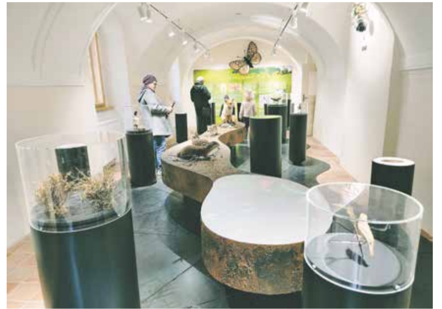
Pobočka Muzea Vysočiny v Telči se přestěhovala do nových prostor.