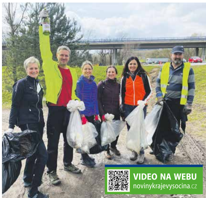
Dobrovolníci z krajského úřadu uklízeli v okolí úřadu a výpadovku z Jihlavy na Pelhřimov. Zajímavými nálezy byly sluneční brýle nebo zabalená elektronická cigareta.

Do ulic Jihlavy se pár dní před koncem akce vydala také skupinka dobrovolníků z krajského úřadu. S ohledem na počasí musela sběr odpadků odložit o týden později. Dobrovolníci uklízeli ulice kolem úřadu a také cestu