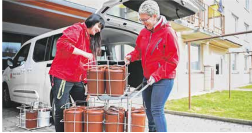
Rozvoz a podávání obědů v režii charitní pečovatelské služby.

Seniři by měli co nejdříve zůstat v domácím prostředí. A aby to bylo možné, bude potřeba rozšířit terénní sociální služby pro seniory. S tím chce Kraj Vysočina pečovatelským službám po celém kraji intenzivně pomoci už od příštího roku. Aby se služba dostala k lidem i v těch nejmenších obcích, bude potřeba v příštích letech přijmout až stovku nových pečovatelů.