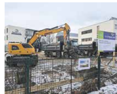
V půlce ledna se bagry naplno zakusily do terénu na Batelovské ulici, kde do roka vyrostou nové výjezdové místo telčských záchranářů.

„Jde o jednopodlažní budovu bez sklepení se dvěma garážovými stánky pro sanitky, které nabídnou i zázemí pro výjezdovou posádku a sklady. Součástí bude i menší parkoviště,“ dodal Janoušek. Záchranáři ze stanice poprvé vyjedou začátkem roku 2025. „Ještě