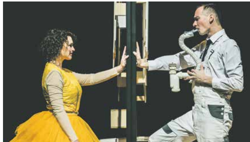
První inscenace nového divadelního souboru HD_Jeé Velká porucha.

Horácké divadlo Jihlava představilo na přelomu roku nový soubor, který se bude věnovat tvorbě pro děti a mladé publikum. Nový soubor nese název HD_Jeé a inspirací pro pojmenování byl radostný výkřik dětí. Dosavadní herecké tváře tak obohatili noví členové.