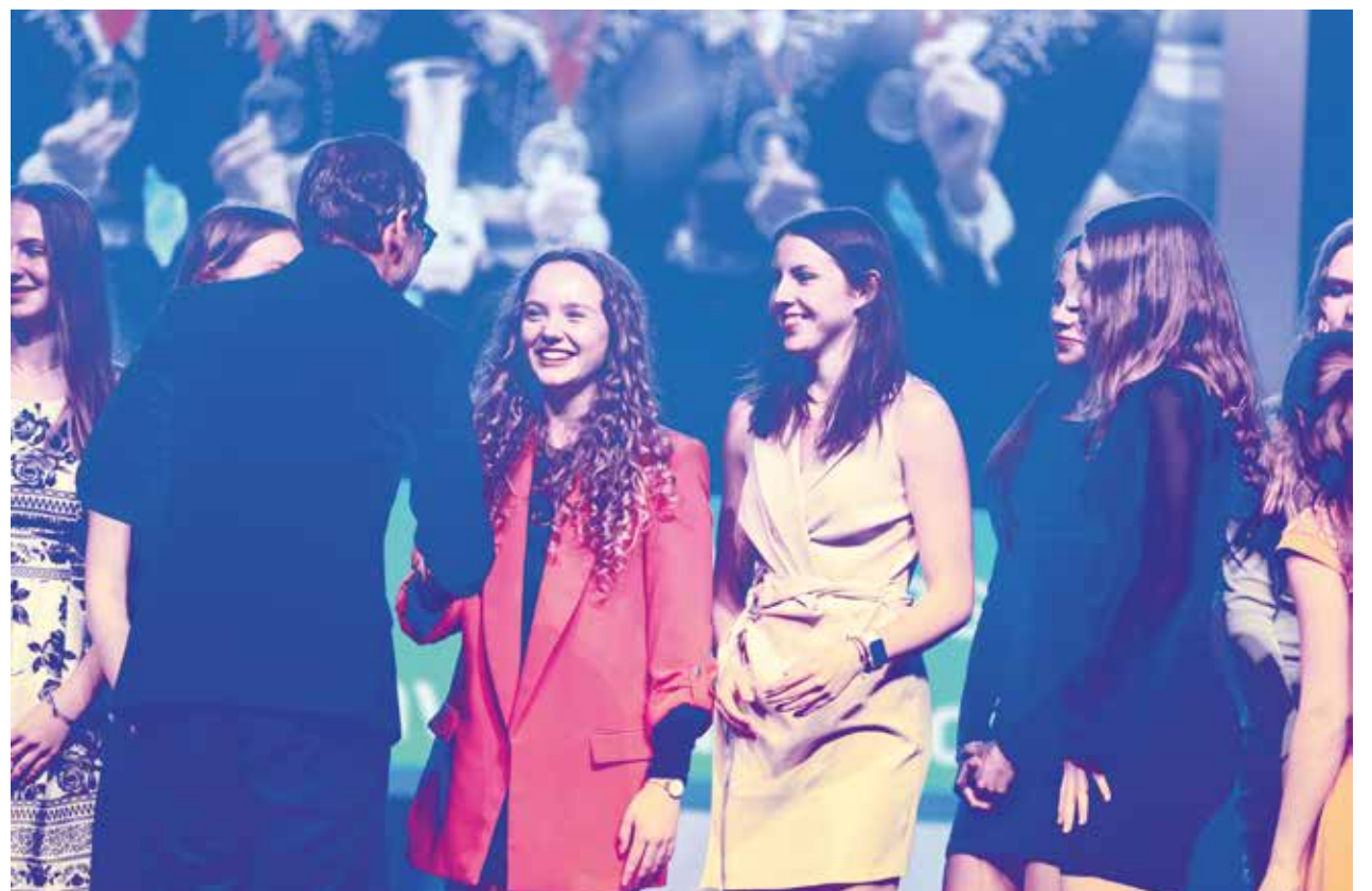
Momentka ze slavnostního vyhlášení výsledků v loňském roce.

Odstartovala oblíbená anketa Sportovec Kraje Vysočina 2023. Kromě sportovních organizací a svazů může úspěšné sportovce od loňského roku nominovat také široká veřejnost. V prvním únorovém týdnu začne hlasování.