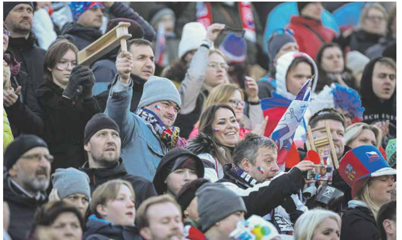
Fanoušci ve Vysočina Areně vždy vytváří jedinečnou atmosféru. Sportovci se shodují, že to v areálu hučí jak ve včelím úlu.

Blíží se největší sportovní svátek roku na Vysočině. Do Nového Města na Moravě se sjedou nejlepší biatlonisté světa, aby změřili síly na Mistrovství světa v biatlonu. Organizátoři očekávají, že si do Vysočina Areny najde od 7. do 18. února cestu až dvě stě tisíc návštěvníků. Jen ze zahraničí jich má přijet až čtyřicet tisíc. „Vysočina Arena je po rekonstrukci připravená na vrcholnou akci sezony. Denní kapacita je až třicet tisíc diváků. Kdo si nechal rezervaci ubytování na poslední chvíli, musí už hledat dále od Nového Města na Moravě. Někteří