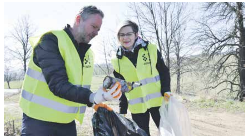
Rukavice si obleče i hejtman Vítězslav Schrek a náměstkyně Hana Hajnová.

Sběr odpadků proběhne od 10. do 23. dubna především v okolí silnic a na veřejných prostranstvích v obcích a městech na Vysočině. „Vysočina je typická svou krásnou přírodou, kterou nám mnozí závidí, pojďme proto přispět ke zkrášlení prostředí, ve kterém