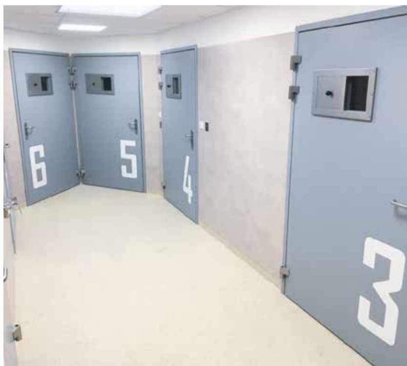
Na protialkoholní záchytá stanici je devět pokojů s celkovou kapacitou jedenácti osob.

Noc zde vyjde na čtyři tisíce korun a svůj dluh zaplatí jen třetina zachycených. Protialkoholní záchytá stanice v jihlavské nemocnici je spádovým místem pro Kraj Vysočina, má devět pokojů s celkovou kapacitou jedenácti