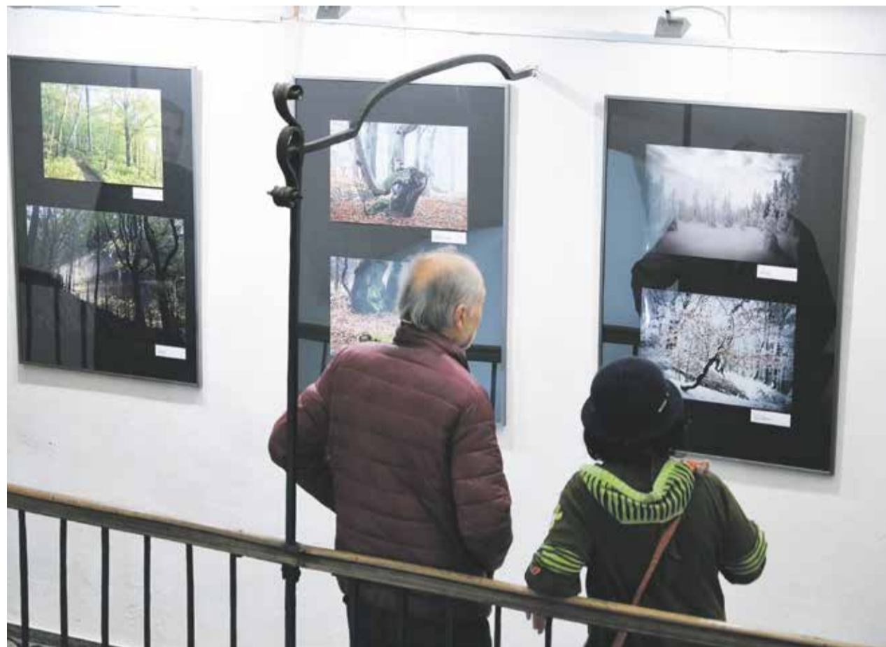
Jedna z posledních výstav v Muzeu Vysočiny v Jihlavě před uzavřením byla Photographia Natura. Ukazovala snímky amatérských fotografů.

Od začátku letošního roku jsou brány Muzea Vysočiny v Jihlavě pro veřejnost uzavřené. Důvodem jsou práce v interiérech muzea a modernizace expozic.