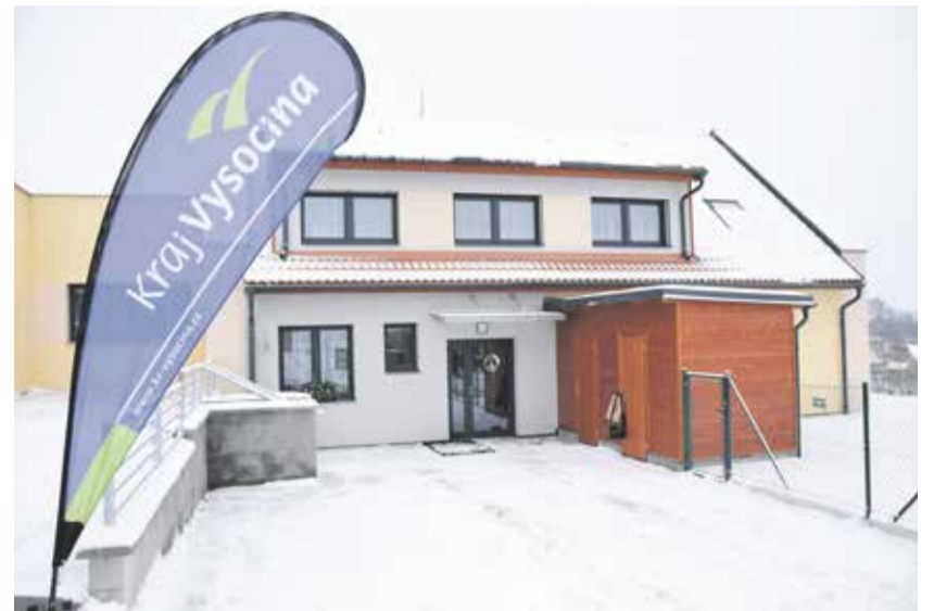
Ve Věži vyrostl nový důmek, ve kterém se od ledna zabydleli klienti místního domova.

„Dvanáct klientů s nízkou mírou podpory se o sebe učí starat, a to včetně vaření, úklidu, praní prádla a dalších činností, které souvisí s životem v běžné domácnosti. Je to velká výzva pro klienty i personál. Pokud se podaří start, je to velká šance zvládnout návrat do normálního života bez nutnosti sociálního či zdravotního zařízení v zádech,“ uvedl radní pro oblast sociálních věcí Kraje Vysočina Jan Tourek (KDU-ČSL). V počátcích novým obyvatelům komunitních