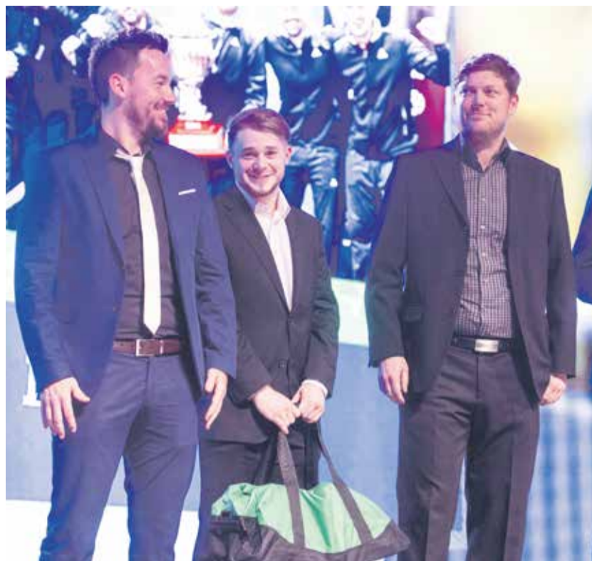
Momentka z vyhlášení Sportovce Kraje Vysočina za rok 2021. Slavnostní galavečr se loni konal v Třebíči.

V odborné části ankety bude o vítězích rozhodovat komise složená