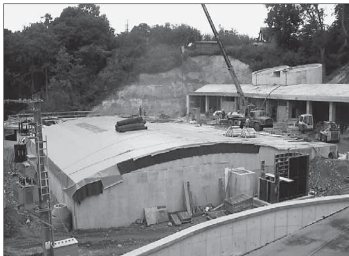
Cílý stavební ruch na čistírně v Náměšti nad Oslavou.

Vysočina / jižní Morava (kid, iro) • Největší stavební počín v oblasti čištění vod a zároveň první společný a největší český projekt v oblasti životního prostředí se úspěšně chýlí ke konci. Nové čistírny odpadních vod a kanalizaci dostane naráz desítky měst z Vysočiny a jižní Moravy. Upozornil na to krajský radní pro vodní hospodářství Ivo Rohovský (ODS).