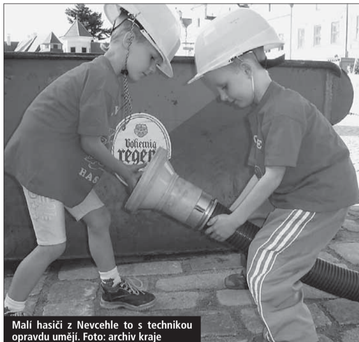
Malí hasiči z Nevcehle to s technikou opravdu umějí.

Telč (kid) • Nejlepší mladí čeští hasiči jsou z Pavlova na Jihlavsku, kategorii mužů vládou Radíkovští z Přerovska a hasičky z Kunovic na Vsetínsku opanovaly pole kategorie žen. To vše na noční soutěži v požárním útoku