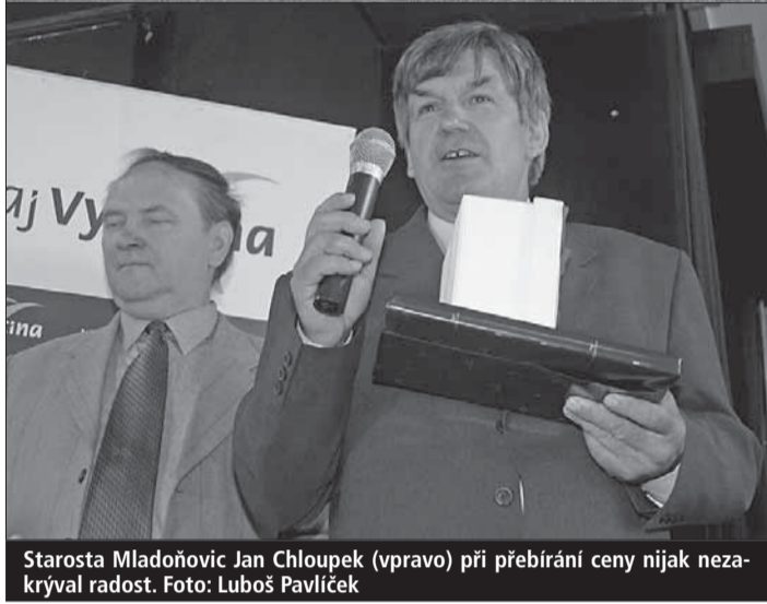
Letošní Vesnice Vysočiny – Mladoňovice. Upravená obec si cenu více než zaslouží.

Mladoňovice (kid, jis) • Vysočina je dobrým místem pro život především díky práci malých obcí. Na slavnostním předávání cen Vesnice Vysočiny 2006 v Mladoňovicích na Moravskobudějovicku to řekl krajský hejtman Miloš Vystrčil (ODS).