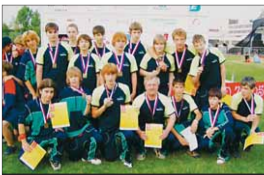
Florbalové mužstvo Vysočiny na olympiádě zazářilo.