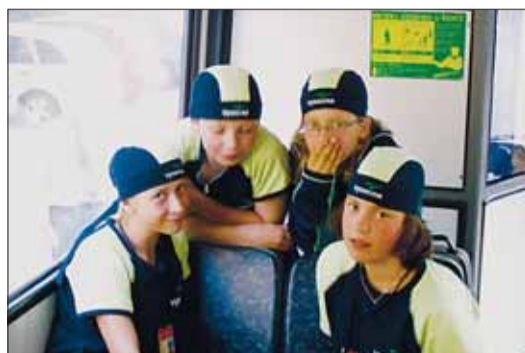
Autobus: přesun mezi ubytováním i sportovišti.