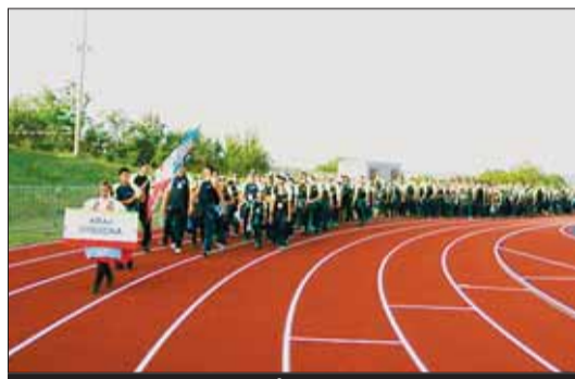
Slavnostní defilé sportovců z našeho kraje.