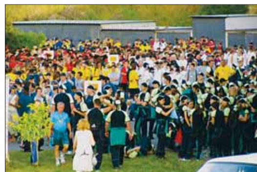
Těsně před slavnostním začátkem. Naše výprava mezi ostatními jednoznačně vyčnívá.