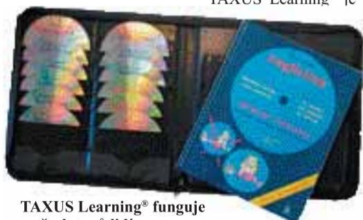
TAXUS Learning® funguje u všech typů lidí

Každý jiný postup je nepřirozený. Nejdříve si „vědomě“ projdete lekci na moderním audio CD. Pak si tutéž lekci na červeném CD použijete velice potichu, na samém prahu slyšitelnosti stále dokola. Musí to být tak potichu, že vás to nijak neruší, a vy se přitom můžete věnovat čemukoliv jinému. Dívat se na televizi, pracovat, bavit se, jet autem, sportovat, prostě cokoliv vás napad-