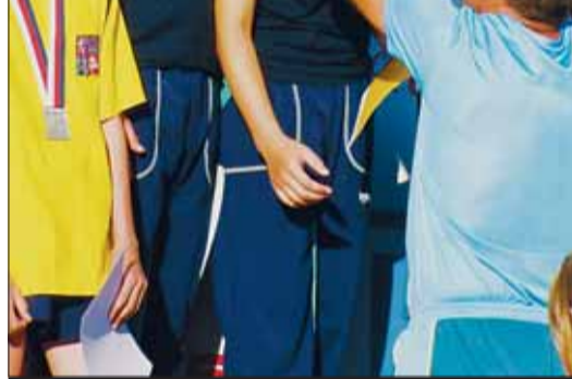
Tak vypadá zlatá radost našeho kraje.