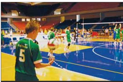
Volejbalisté z Vysočiny občas doslova čarovali.