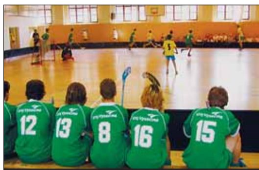
Florbal: Soupeř se snaží, naši borci mají převahu.