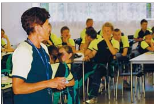
Jarmila Kratochvílová motivuje reprezentanty Vysočiny před začátkem všech klání.

Vysočina/Brno • Výprava z Vysočiny přivezla z druhé olympiády dětí a mládeže v Brně celkem 17 medailí, tedy sedm zlatých, tři stříbrné a sedm bronzových. Na klání, které probíhalo v pěti červnových dnech odjelo z kraje bezmála 300 mladých sportovců, které účastí podpořil i hejtman Miloš Vystrčil (ODS) a krajská radní pro školství Martina Matějková (ODS). Celkem se olympiády účastnilo na 4000 reprezentantů všech krajů a součástí olympiády byly i soutěžní i nesoutěžní přehlídky kultury a regionální. Celkový přehled výsledků je na webových stránkách www.lodm2005.cz . Děti z Vysočiny se už teď připravují na zimní olympiádu, která bude v lednu.