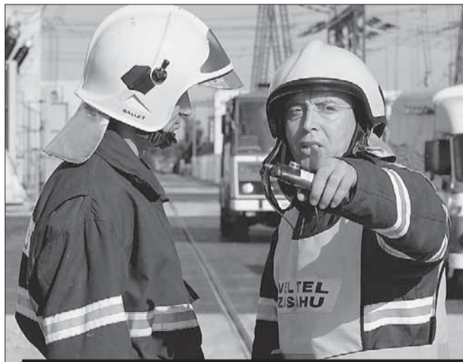
Záchranáři v kraji pravidelně trénují. Naposledy při cvičném požáru v jaderné elektrárně Dukovany.

Vysočina • Pokud by na území kraje došlo k teroristickému útoku, jsou složky krizového řízení připravené. Problém ale může nastat s přístrojovou kapacitou některých nemocnic. To jsou nejdůležitější poznatky z rychlé kontroly akceschopnosti krizových štábů na Vysočině, kterou po událostech v Londýně na začátku června nařídil hejtman Miloš Vystrčil (ODS).