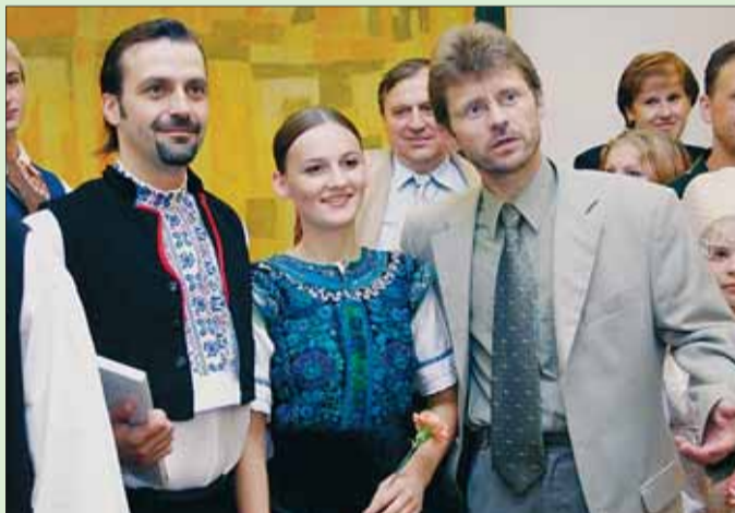
Hejtmanka Vysočiny Miloš Vystrčil (vpravo) má folklór očividně rád.

Během pěti festivalových dní Českou republiku a Vysočinu reprezentovaly soubory Kvítec a Podjavořičan Telč, Pramínec Jihlava a Studánka Žďár nad Sázavou. Ze zahraničí přijely soubory Furmani Nitra (Slovensko), Iglíce Ágasvár (Maďarsko), Vega del Segura de Murcia (Španělsko), Mexico Folclorico Querétaro (Mexiko), Mix Dance Čeljabinsk (Rusko) a Usa Riga (Lotyšsko). Festival zahájil velký komponovaný program s vystoupením všech souborů. V je-