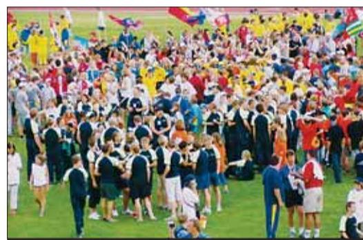
A takové bylo závěrečné loučení.