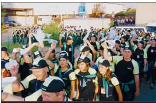
Nástup naší výpravy na stadion.