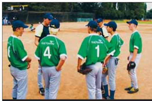
Baseballový tým Vysočiny uprostřed utkání.