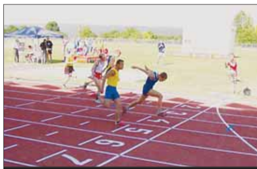
Vítězný sprint v podání našeho rekordmana.