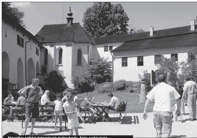
Atmosféru setkání dokreslovaly kulisy hradu.

Vondráček: Lidé s podobnými životními příběhy se vždy rádi vidí a mají si stále co povídat