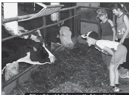
Děti a zvířata, vztah důvěry a respektu.

zkoušely si moderní zemědělskou techniku i tradiční postupy například při dojení. Seznámily se tak s dlouhou cestou, kterou mléko na stůl každého z nás urazí. „Takovou soutěž považují za zábavnou osvětu,“ vysvětlil přímo na místě krajský radní pro zemědělství Ivo Rohovský (ODS), jenž měl nad akcí záštitu a dodal: „S farmou jsme se rozhodli spolupracovat, protože Němcovy dlouho znám a jejich podnik považují za typický příklad zemědělské malovýroby, která při úsilí celé rodiny dokáže přinést slušnou obživu. Zkrátka farma je dobře vedená a Němcovi se mají čím chlubit.“