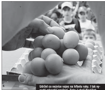
Udržet co nejvíce vajec na hřbetu ruky. I tak vypadá rekordní snažení.

To jsou jen některé z celkem 73 rekordů, které během festivalu padly. Akci během dvou dnů navštívilo přibližně 15.000 diváků.