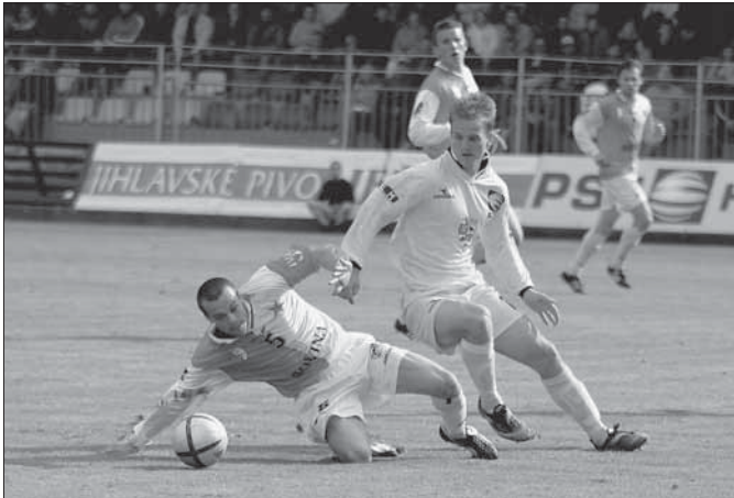
Rozhodnutí si Jihlavští nechali až na poslední zápas. V něm nezaváhali a srazili Kroměříž na kolena.

FC Vysočina vybojovala historicky první postup do nejvyšší soutěže ■ V cestě jim stála Kroměříž, kterou horalé zvalcovali vysoko 3:1