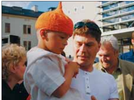
Vítězný model přehlídky dětského oblečení.