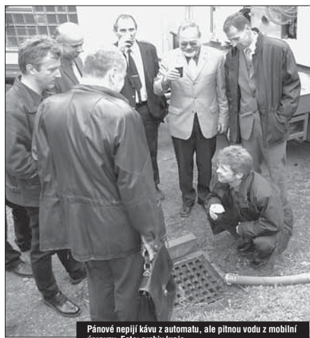
Pánové nepijí kávu z automatu, ale pitnou vodu z mobilní úpravy.