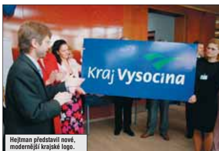
Hejtmán představil nové, modernější krajské logo.