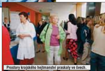
Prostory krajského hejtmánství praskaly ve švech.