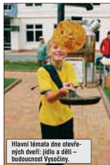
Hlavní témata dne otevřených dveří: jídlo a děti – budoucnost Vysočiny.