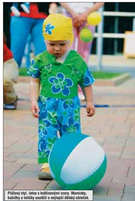
Plážový styl, letos s květinovými vzory. Maminky, babičky a tetičky soutěží o nejlepší dětský obleček.