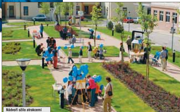
Nádvorí ožilo atrakcemi a soutěžemi pro děti.