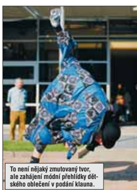
To není nějaký zmutovaný tvor, ale zahájení módní přehlídky dětského oblečení v podání klauna.