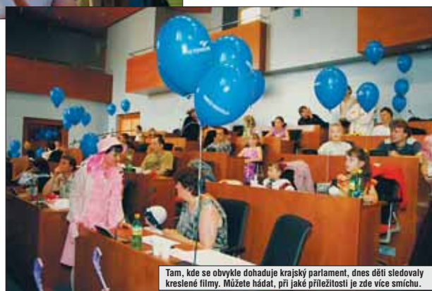
Tam, kde se obvykle dohaduje krajský parlament, dnes děti sledovaly kreslené filmy. Můžete hádat, při jaké příležitosti je zde více smíchu.