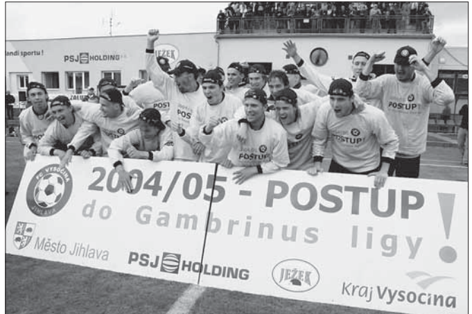
Jihlavské fotbalové Nagano: Fanoušci se mohou v příští sezóně těšit na atraktivní souboje.

Historický postup jihlavských fotbalistů ale znamená také velké starosti pro vedení klubu a města. Město Jihlava, které je společně se stavební firmou PSJ holding a pivovarem Ježek akcionářem klubu, bude muset urychleně zajistit alespoň základní podmínky pro prvoligovou soutěž. Jednou z nich je podmínka Českomoravského fotbalového svazu na kapacitu stadionu. Ten by měl mít minimálně 4000 sedadel. V současné době ale více než po-