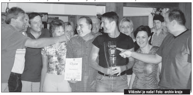
Vítězství je naše!