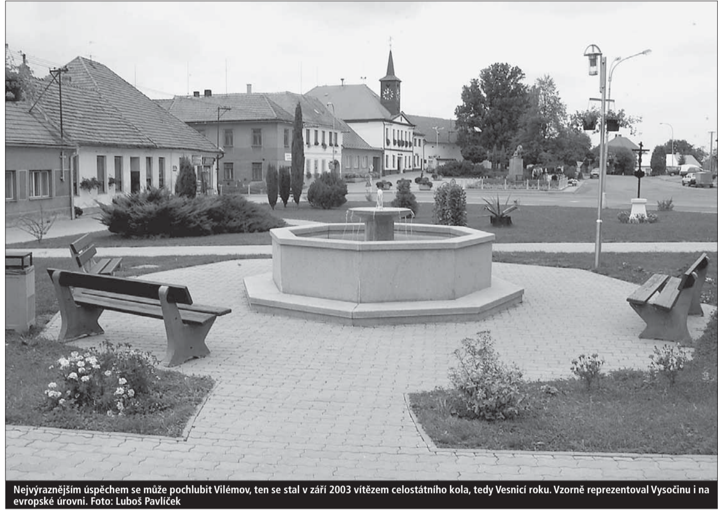
Nejvýraznějším úspěchem se může pochlubit Vilémov, ten se stal v září 2003 vítězem celostátního kola, tedy Vesnicí roku. Vzorně reprezentoval Vysočinu i na evropské úrovni.