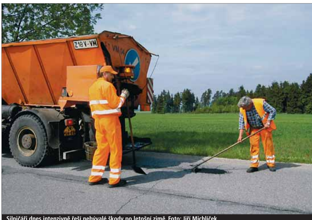
Silničáři dnes intenzivně řeší nebyvalé škody po letošní zimě.