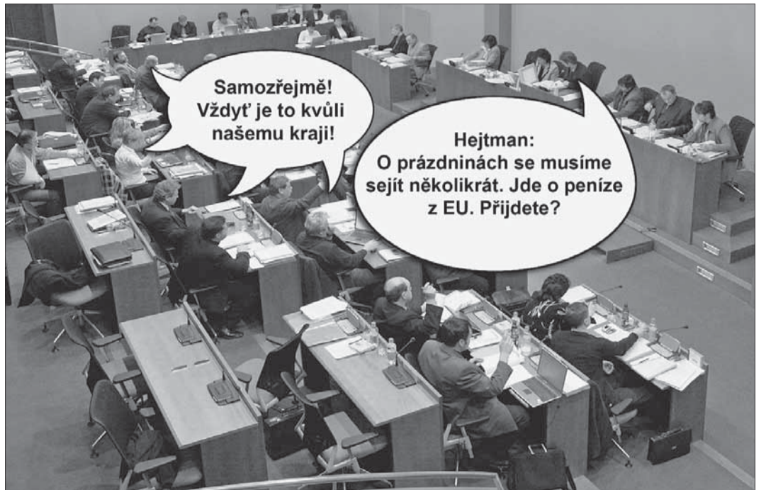
Krajští zastupitelé při výzvě, aby v sobotu o prvním prázdninovém dnu přišli, neváhali ani vteřinu.

Musí se sejit na jednání s jedním bodem, a to na volbu zástupců Vysočiny do výboru regionální rady soudržnosti. Nejde přitom o žádnou formalitu, ale o miliardy korun z evropských dotací. Podle novely zákona, která začne platit právě od 1. července, totiž musí kraje, sdružené do větších celků, zřídit regionální rady soudržnosti jako právnické osoby a výkonným orgánem bude nový úřad společný pro Vysočinu a Jihomoravský kraj. Dalším orgánem je výbor regionální rady, kam bude zvoleno po osmi zastupitelích z každého kraje. Právě tento výbor bude v období let 2007–2013 rozhodovat o rozdělení dotací z EU v rámci regionálního operačního programu. Předpokládá se, že každý rok se bude jednat o zhruba dvě miliardy korun. Oba kraje se shodují na tom, že největší část dotace by měla směřovat do krajských silnic. „Je to v souladu s tím, na čem jsme se v současné regionální radě všichni shodli. Tedy uvést krajské silnice co nejdříve do přijatelného