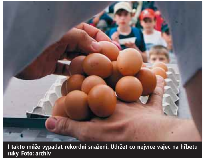
I takto může vypadat rekordní snažení. Udržet co nejvíce vajec na hřbetu ruky.

Program potrvá od pátečního odpoledne do sobotního večera, tedy od 9. do 10. června. Lidem na-