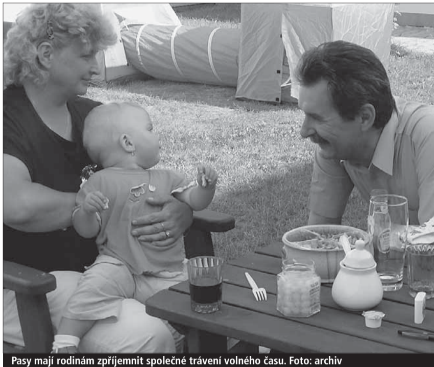
Pasy mají rodinám zpříjemnit společné trávení volného času.

Vysočina (kid) • O projektu rodinných pasů se mluví i v našem kraji. Jde o systém slev pro rodiny s dětmi ve veřejných subjektech a nakonec i soukromém sektoru.