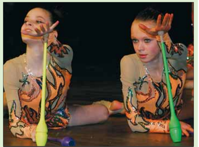
Program večera zpestřilo vystoupení trebičských gymnastek.