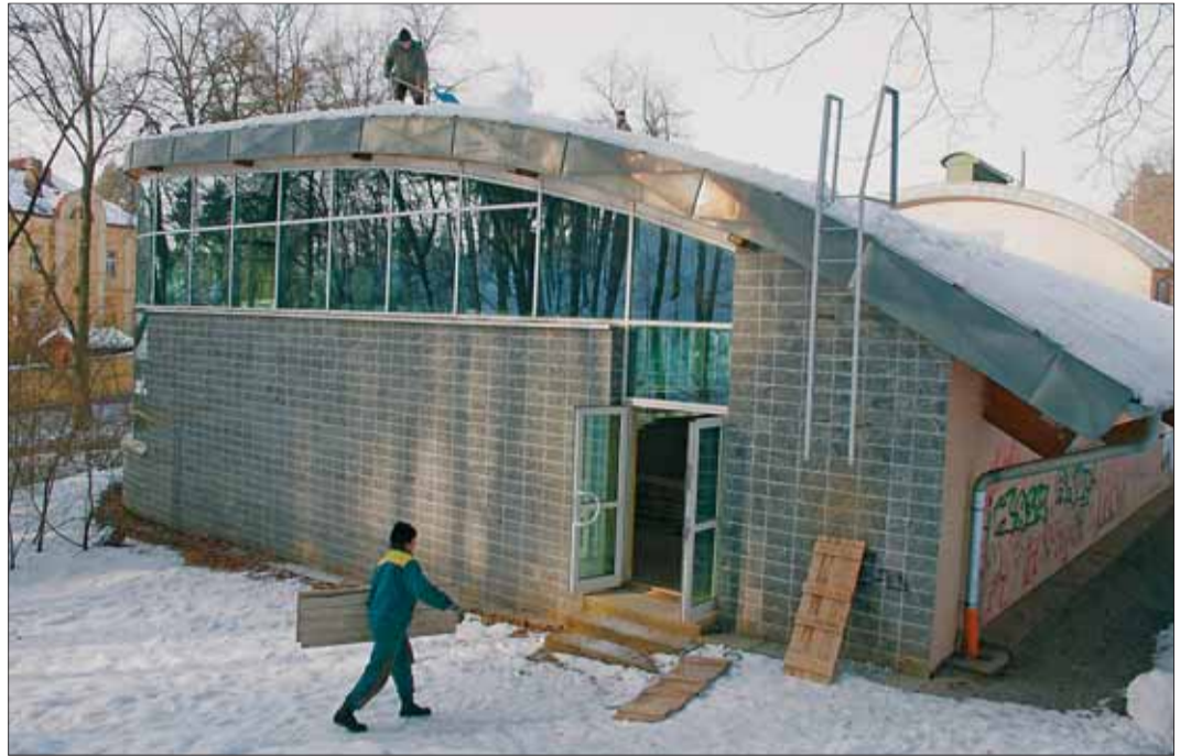
Sníh ohrozil střechu bazénu v Havlíčkově Brodě.

Mezi prvními kontrolovanými objekty byla například sportovní hala v Příbyslavě, kde statik doporučil okamžité uzavření provozu, protože nebezpečí bylo skutečně vysoké. Podepření krovů statik navrhnul i na jedné ze základních škol ve Žďáře nad Sázavou a v případě hospodářských budov Školního statku v Humpolci. Statiky posouzen byl i stav střechy jedné z budov sídla kraje Vysočina v Jihlavě. Skleněné částečně zastřešení budovy kongresového centra zapadané vrstvou mokrého sněhu nepředstavovalo žád-