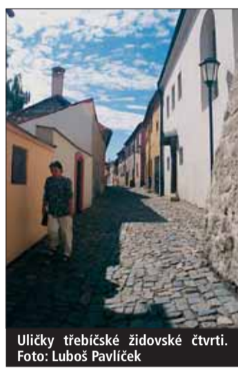
Uličky třebíčské židovské čtvrti.

Památkami UNESCO jsou historické centrum Telče, poutní kostel Svatého Jana Nepomuckého na Zelené hoře u Žďáru nad Sázavou a židovská čtvrť s bazilikou Sv. Prokopa v Třebíči.