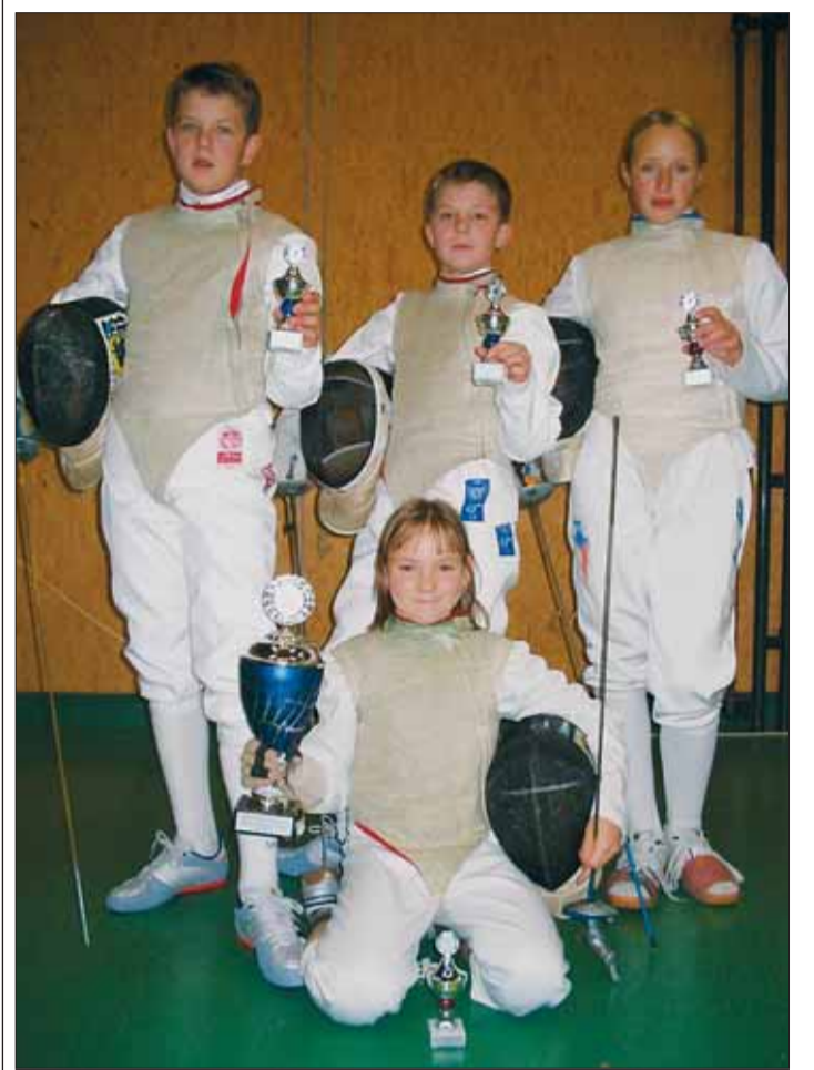
Úspěšní bystřičtí šermíři jsou na své trofeje patřičně hrdí.

České rychlobruslařské úspěchy se rodí doslova na kolenech a ve velice skromných podmínkách. První výraznější popud dal v roce 1988 na olympijských hrách v Calgary svratecký Jiří Kyncl, který se pod vedením trenéra Nováka probojoval mezi nejlepšími šestnáctku.