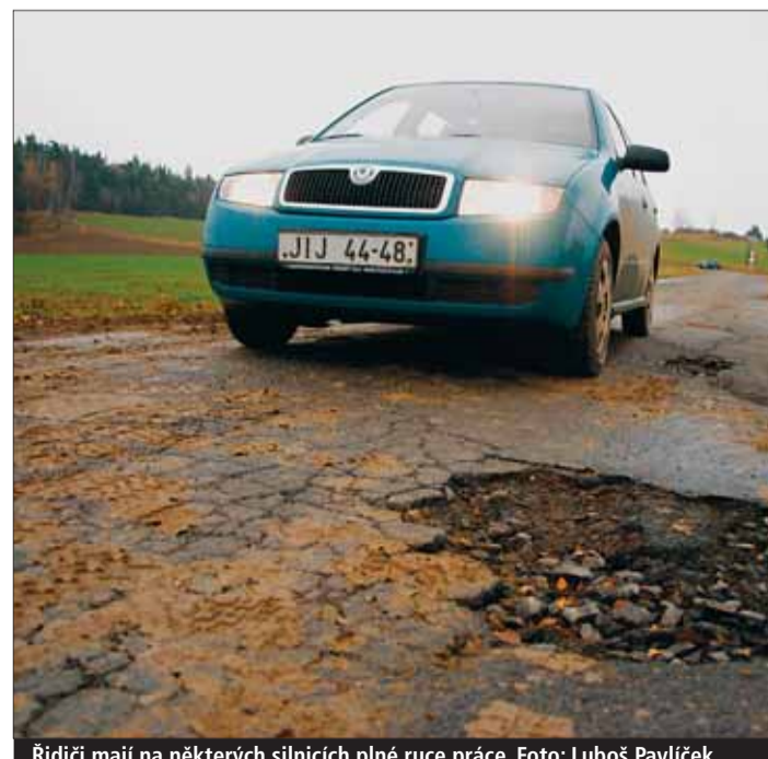
Řidiči mají na některých silnicích plně ruce práce.

Třebíčsku. V havarijním stavu je 43 procent z nich. Naopak řidiči na Pelhřimovsku se setkají jen se dvěma procenty takových silnic. Kromě dědictví po státním hospodaření je jednou z příčin špatného stavu krajských silnic také mimořádně hustá silniční síť. Více kilometrů má ve vlastnictví už jen Středočeský kraj. Vysočina má totiž řídké osídlení, obyvatelé jsou rozptýleni v největším množství v malých obcích, a tak je silniční síť značně rozsáhlá. Přitom takový stav se nijak neodráží v příjmech do krajského rozpočtu. „Ostatní kraje zkrátka mají méně kilometrů silnic a mohou si na ně dovolit vyčlenit více peněz,“ vysvětlil Václav Kodet.