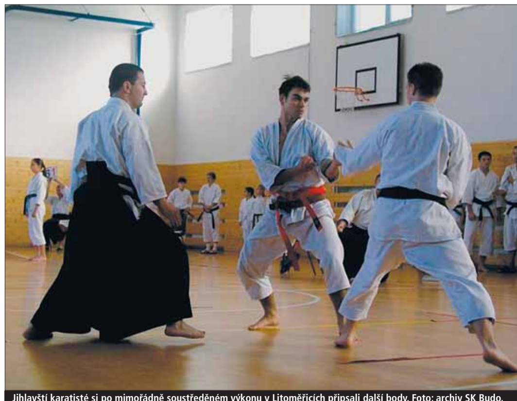
Jihlavští karatisté si po mimořádně soustředěném výkonu v Litoměřicích připsali další body.

Jihlava, Litoměřice • Nebývalou úrodu bodů dovezli karatisté z oddílu SKP Budo Jihlava z druhého kola Národního poháru České asociace tradičního karate 2005–2006, které se konalo v Litoměřicích.