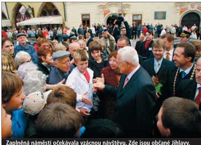
Zaplněná náměstí očekávala vzácnou návštěvu. Zde jsou občané Jihlavy.