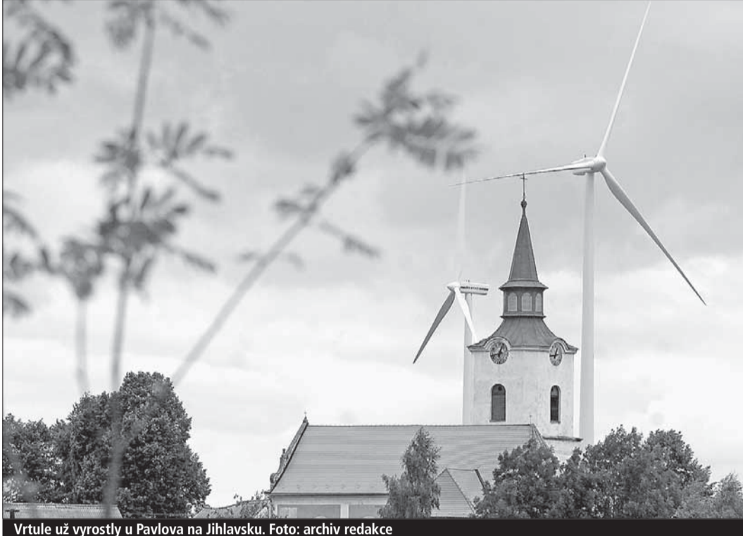
Vrtule už vyrostly u Pavlova na Jihlavsku.

len zákon, že stát tuto elektřinu dotuje a vykupuje ji přednostně s garantovanou cenou. Z výstavby elektráren se tak stal veliký obchod a investoři teď Vysočinu doslova oblehli.“ Zájemci o výstavbu se v našem kraji soustředí hlavně na malé obce a nabízí jim roční desetitisícové a statisícové částky do obecních pokladen. To pak zastupitelé zvažují, protiváhou bývá jen masivní odpor občanů.