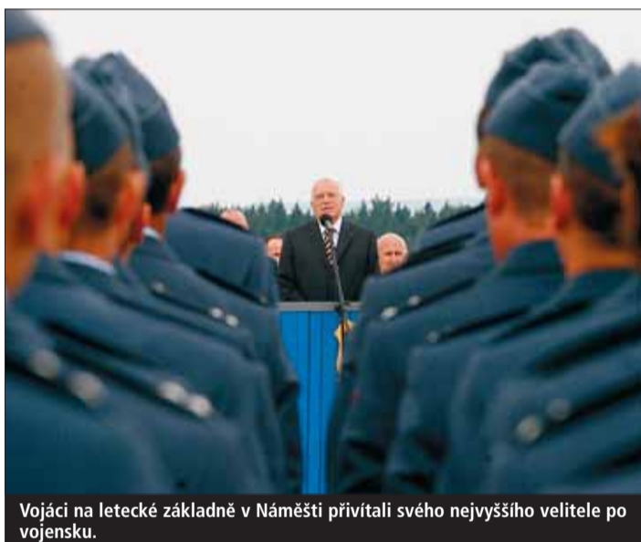
Vojáci na letecké základně v Náměšti přivítali svého nejvyššího velitele po vojensku.

Fotogalerie z návštěvy prezidenta na www.kr-vysocina.cz zaznamenala obrovskou návštěvnost. Během prvních dní se na ni podívalo přes 5000 lidí. Fotogalerie je stále aktualizovaná.