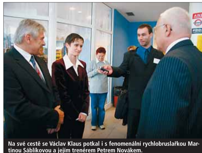
Na své cestě se Václav Klaus potkal i s fenomenální rychlobruslaškou Martinou Sáblíkovou a jejím trenérem Petrem Novákem.

Fotogalerie z návštěvy prezidenta na www.kr-vysocina.cz zaznamenala obrovskou návštěvnost. Během prvních dní se na ni podívalo přes 5000 lidí. Fotogalerie je stále aktualizovaná.