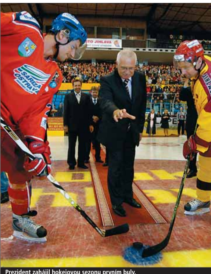
Prezident zahájil hokejovou sezonu prvním buly.