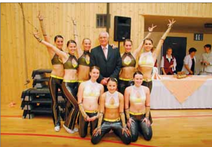
Sportovní klub aerobiku v Havlíčkově Brodě si nenechal ujít společné foto.