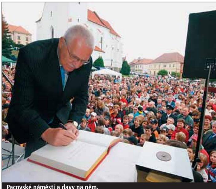
Pacovské náměstí a davy na něm.