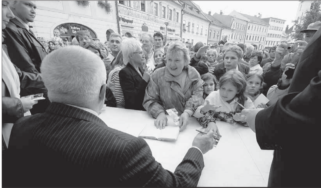
Vidět prezidenta a získat jeho podpis – za tím mířily na náměstí tisíce lidí.

Prezidentský pár pak obědval na velkomeziříčské hotelové škole a na tamním náměstí se opět sešel s občany. Navečer pak slavnostně zahájil vhozením kotouče hoke-