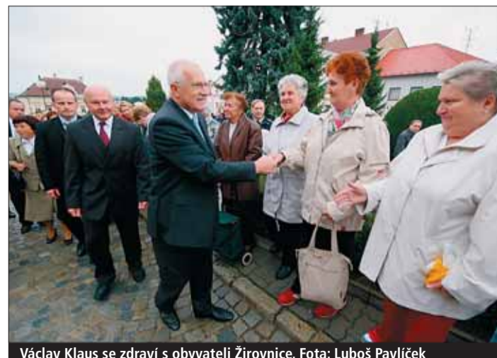
Václav Klaus se zdraví s obyvateli Žirovnice.