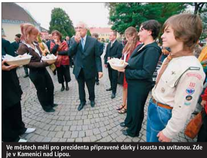
Ve městech měli pro prezidenta připravené dárky i sousta na uvítanou. Zde je v Kamenici nad Lipou.