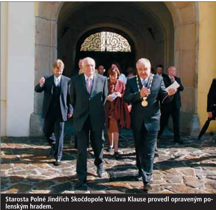
Starosta Polné Jindřich Škočdopole Václava Klause provedl opraveným polenským hradem.