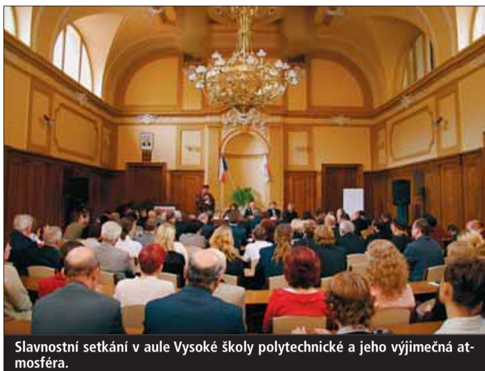
Slavnostní setkání v aule Vysoké školy polytechnické a jeho výjimečná atmosféra.