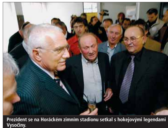
Prezident se na Horáckém zimním stadionu setkal s hokejovými legendami Vysočiny.