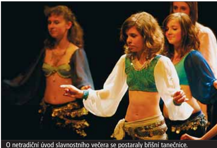
O netradiční úvod slavnostního večera se postaraly bříšň tanečnice.