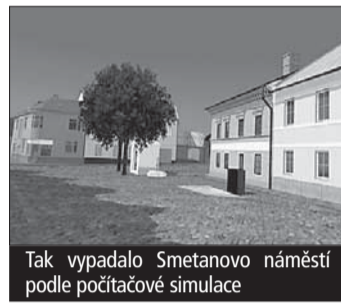
Tak vypadalo Smetanova náměstí podle počítačové simulace