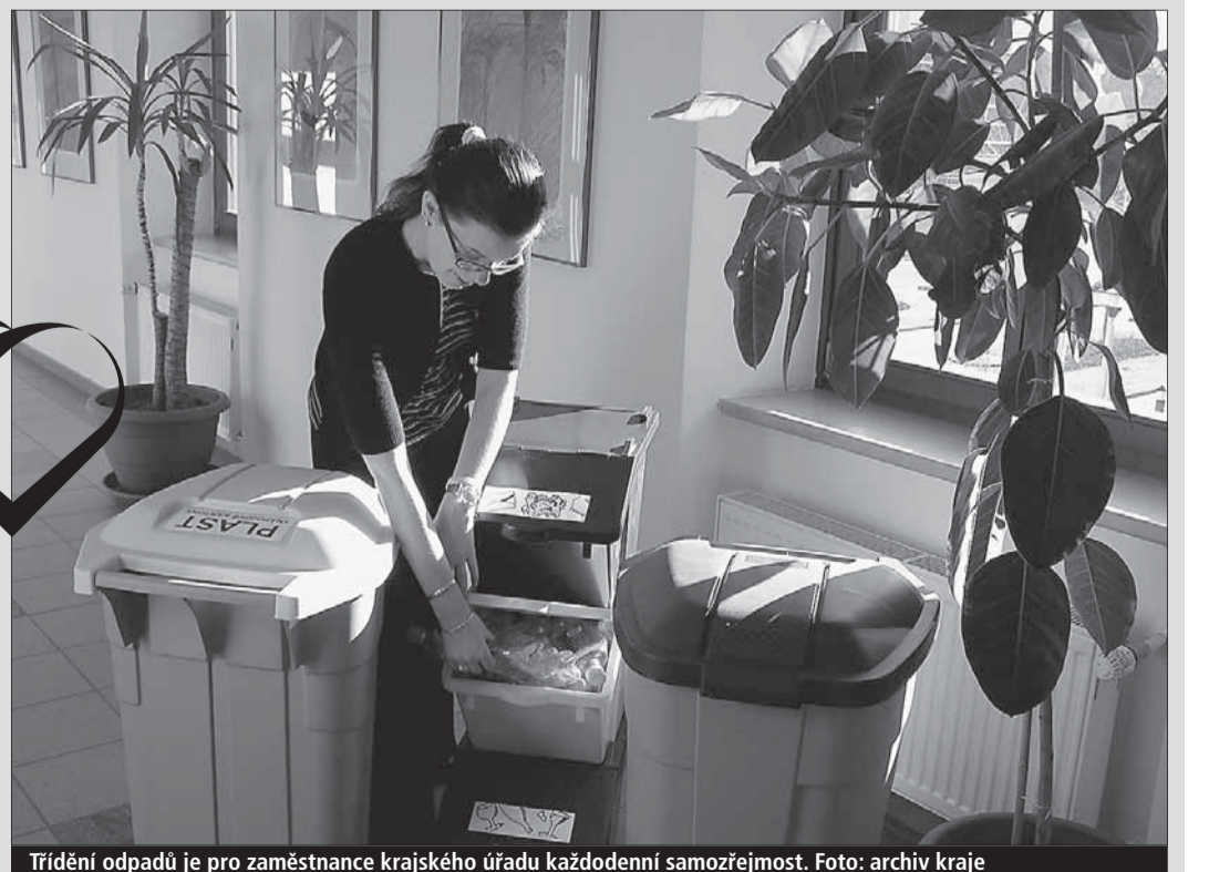
Třídění odpadů je pro zaměstnance krajského úřadu každodenní samozřejmost.

Jihlava (kid) • K životnímu prostředí přistupuje velmi ohleduplně i samotný krajský úřad. Už od roku 2004 jeho zaměstnanci důsledně třídí odpad a barevné nádoby se staly nepřehlédnutelným doplňkem chodeb, kanceláří i provozních prostor. Kraj používá čtvrtinu kancelářských potřeb z recyklovaných materiálů. Postupně zavádí recyklovaný papír pro běžný tisk a renovuje například tonery do tiskáren. Provozovatel bufetu v areálu úřadu má v nabídce nápoje ve vratných lahvích. Velkým přínosem jsou noviny, které právě čtete. Ty jsou tištěné na papír, který se vyrábí ze tří čtvrtin z recyklovaného papíru a zbytek tvoří dřevní odpad. Papír je navíc bělený bez použití chlórů.