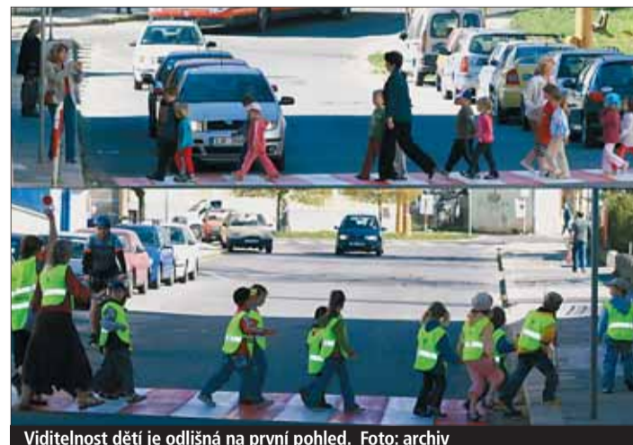
Viditelnost dětí je odlišná na první pohled.

Pro zvýšení bezpečnosti nejmenších účastníků dopravy krajský úřad také pomůže organizovat školící kurzy pro ředitelky a učitelky mateřských škol k bezpečnému doprovodu dětí v silničním provozu a k výuce základů dopravní výchovy ve školkách. Předškoláci budou rovněž mo-