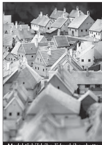
Model trebičského židovského ghetta