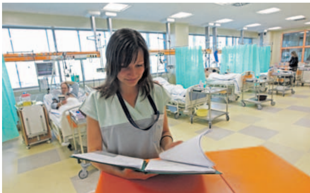
■ Kraj Vysočina chce zajistit dostatek zdravotních sestřiček v nemocnicích nabídkou stipendia.

Opatření zaměřené na studenty se snaží řešit narůstající nedostatek zdravotníků v krajských nemocnicích. Zatím ale