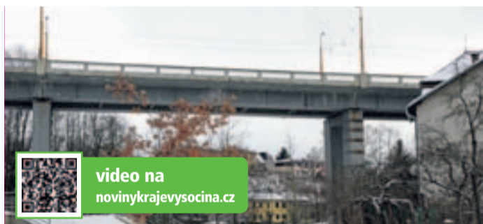
Brněnský most bude od dubna pro dopravu zcela uzavřen.

V rámci příprav vedou představitelé kraje rozhovory se zástupci Policie ČR o možnostech případného omezení sjíždění aut z dálnice D1 na Jihlavu. A to zejména při komplikacích na dálnici. Objížděná trasa městem