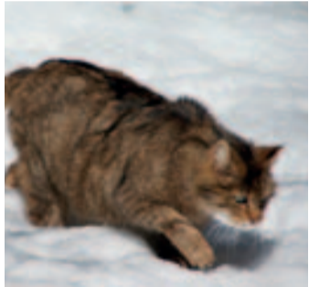
■ Kočka divoká.

Narušení migrační cesty potvrzuje i krajský radní pro oblast lesního a vodního hospodářství, zemědělství a životního prostředí Martin Hyský (ČSSD). „V Kraji Vysočina jsme zjistili již patnáct kritických bodů na migračních koridorech velkých savců. Od projektu očekáváme praktické návrhy na zlepšení průchodnosti těmito konkrétními problémovými místy. Migrační koridory také musí být začleněny do podkladů pro územní plánování,“ řekl radní.