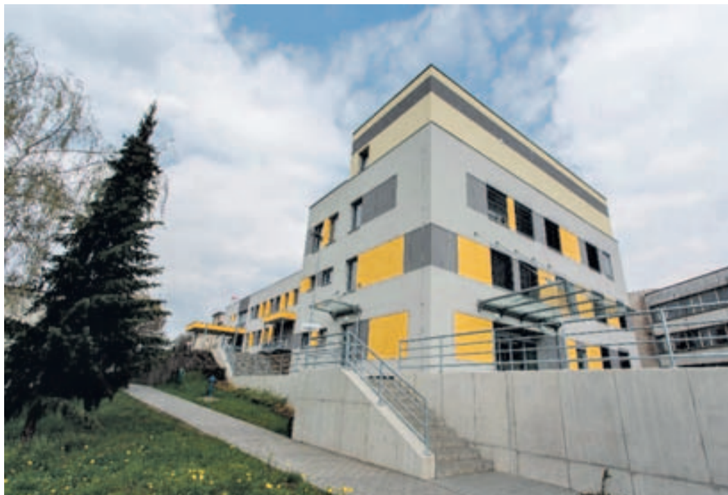
Kvalita poskytované péče jde ruku v ruce s odpovídajícím zázemím. Kompletní rekonstrukcí prošlo v roce 2015 oddělení hematologie a transfúziologie Nemocnice Pelhřimov.

A v případě Nemocnice Pelhřimov rozhodla udělit certifikát na další tři roky, do roku 2020. „Kvalita poskytované péče v krajských zdravotnických zařízeních je pro nás prioritou. Vysoké požadavky kladou důraz na léčebný proces, na klinické oblasti, ale velkou roli hrají například také stravování, provoz nemocnice, hygiena nemocničního prostředí, prádelna nebo požární ochrana,“