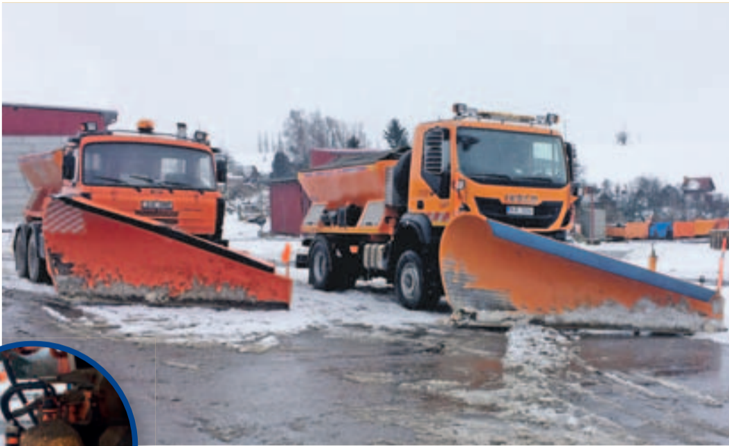
Sypače jsou vybaveny zařízením, které zaznamenává množství vydaného materiálu.

kilometrů komunikací. To je taková vzdálenost jako z Jihlavy do španělského Madridu a zpět. „Ve čtrnácti cestmistrovstvích a šesti dalších střediscích máme k dispozici více než 150 sypačů, stovku traktorů, 40 menších nákladních vozů, 60 dodávek a zhruba 100 osobních automobilů.“ vyjmenoval ředitel Jan Míka základní technické vybavení silničářů v kraji.