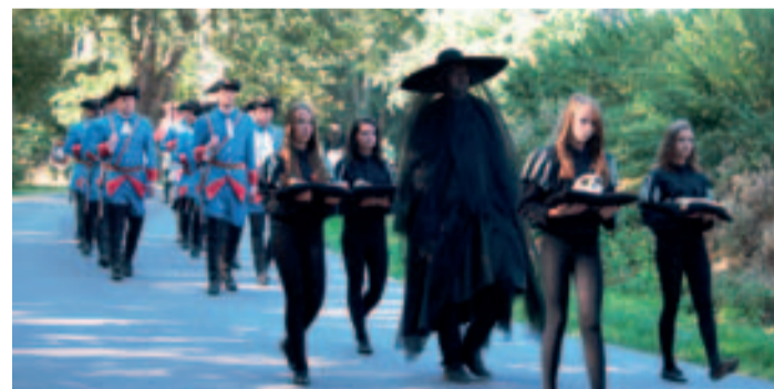
■ Naposledy prošel Historický morový průvod Brtnicí v roce 2010.