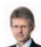
Miloš Vystrčil, zastupitel Kraje Vysočina a senátor (ODS)

Je zvykem, že na přelomu roku jsou různým způsobem oceňováni nebo vzdvižováni a chváleni zejména Ti, kteří díky svému úspěchu, odvážnému činu nebo třeba nezištné pomoci druhému něčeho významného dosáhli, něco významného vytvořili nebo na sebe jinak upozornili či vynikli.