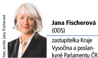
Jana Fischerová (ODS) zastupitelka Kraje Vysočina a poslankyně Parlamentu ČR