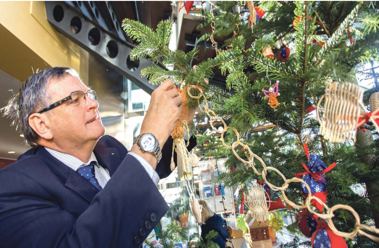
Barevné Vánoce zahájil v sídle Kraje Vysočina hejtmán Jiří Běhounek. Připojil se k dozdobování pět metrů vysokého stromu.