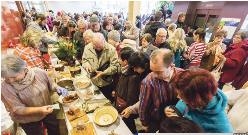
Ochutnávka tradičních vánočních dobrot.