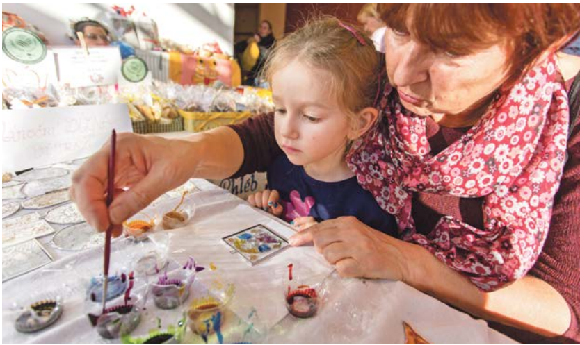
Vánoční dárky a ozdoby bylo možné o Barevných Vánocích nakupovat, ale i vyrábět.