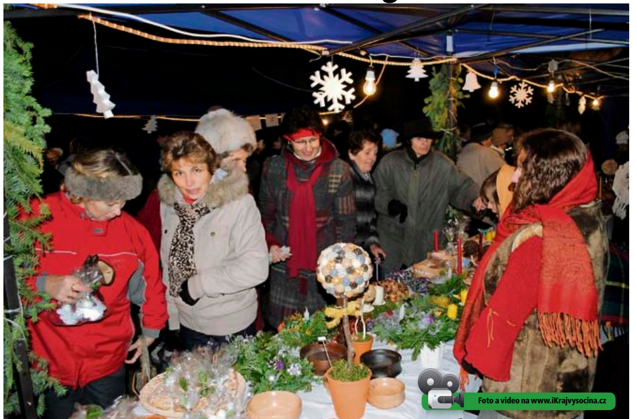
Na začátku adventu se v Košetcích už po několikáté sešla celá obec. Vánoční atmosféru nasávali občané u místního kostela, kde byl připraven staročeský jarmark.