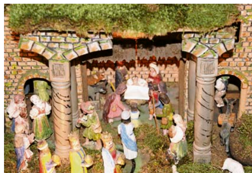
Téměř sto padesát figurek a postav najdou zájemci na betlému Aloise Vajera.