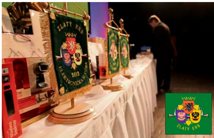
Od počátku ledna se mohou obce a města Vysočiny přihlašovat do dalšího ročníku soutěže Zlatý erb.