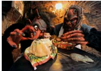
Jihlavské podzemí se i letos proměnilo v peklo.

Advent zahájila většina obcí v kraji tradičním rozsvícením vánočního stromku, které bylo mnohde spojeno s dalšími předvánočními akcemi.