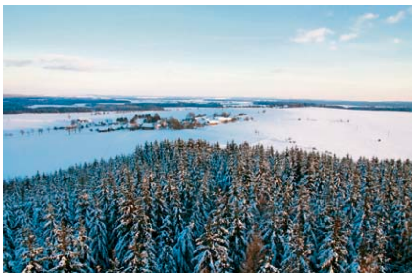
GPS souřadnice: 49°17'1.693"N, 4°55'48.932"E, Nadmořská výška: 645 m

Rozhledy do krajiny lákají romantiky nejenom v teplých letních měsících. Určitě je zajímavé si vychutnat kouzlo krajiny oděné do zimního hávu.