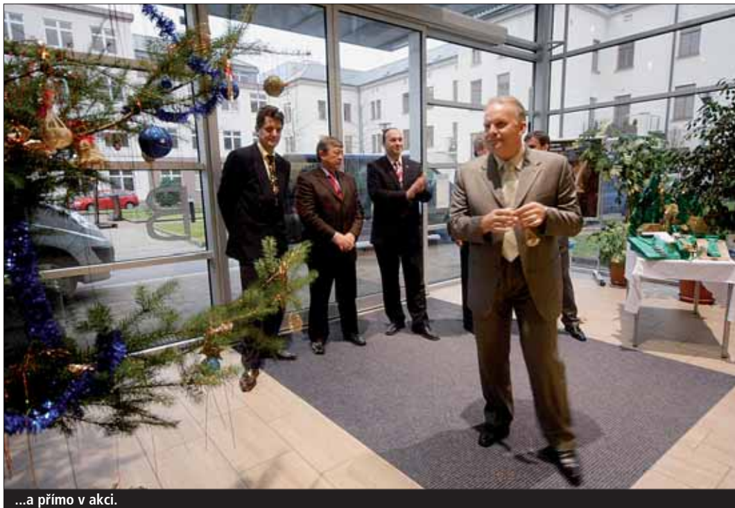
...a přímo v akci.