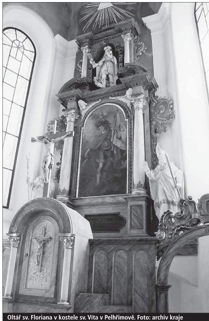
Oltář sv. Floriana v kostele sv. Víta v Pelhřimově.

Vysočina (ok, kid) • Jedinečné církevní památky a renesanční stavby na celé Vysočině svítí novotou. Umožnily to takzvané norské peníze, přesně řečeno 600 000 EUR z Finančního mechanismu EHP/Norska, priority Uchování evropského kulturního dědictví.