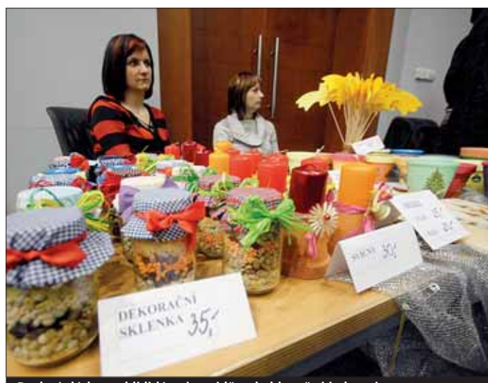
Drobné dárky mohli lidé nejen vidět, ale hlavně si je koupit.