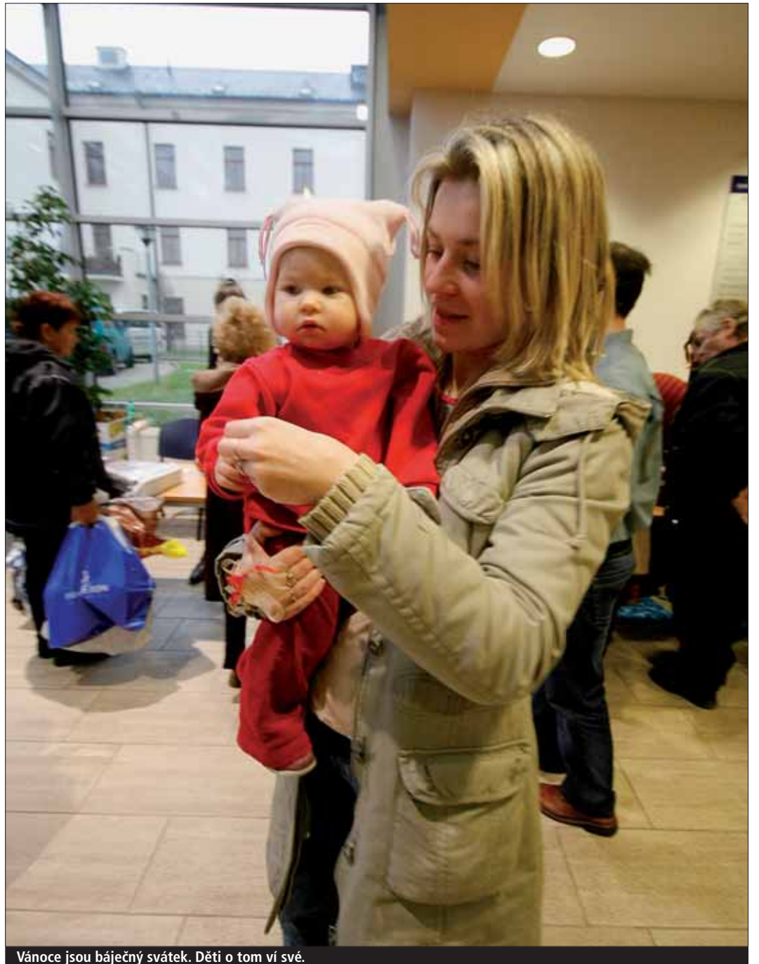
Vánoce jsou báječný svátek. Děti o tom ví své.