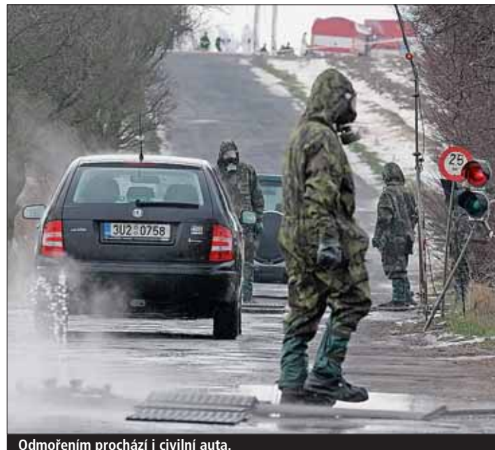
Odmočením prochází i civilní auta.