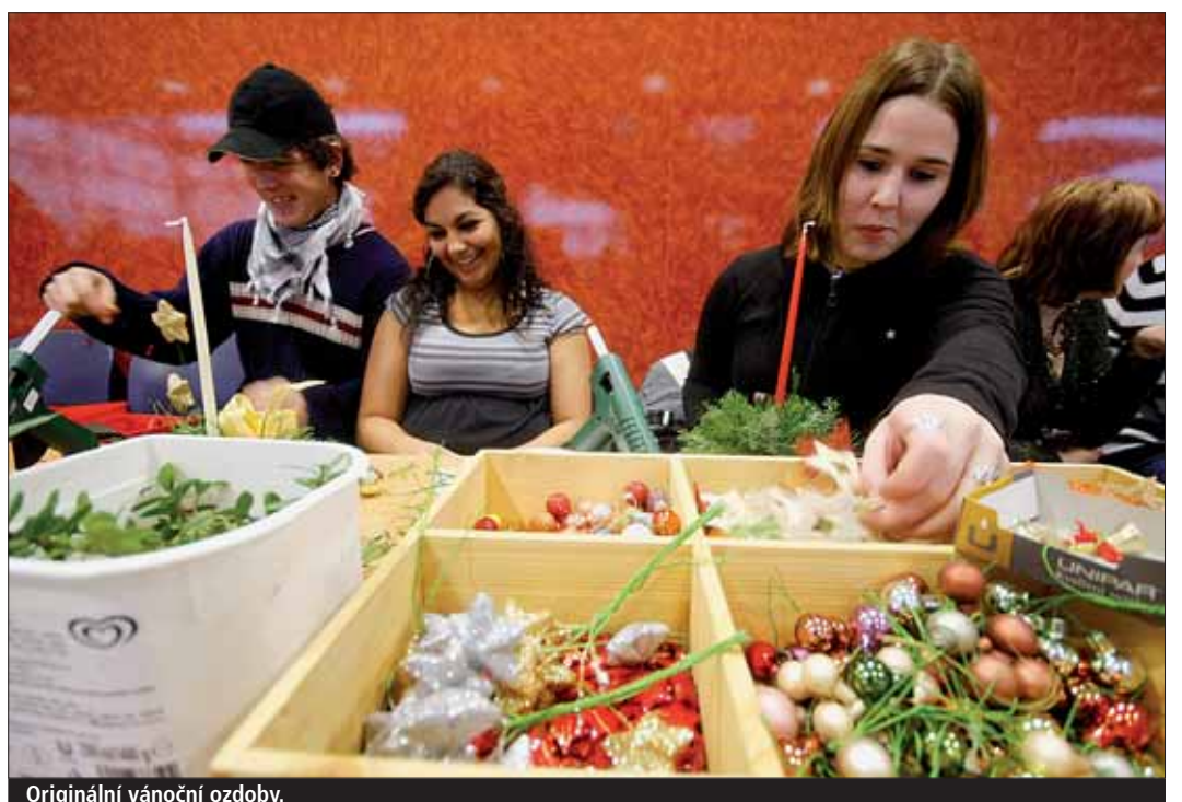
Originální vánoční ozdoby.