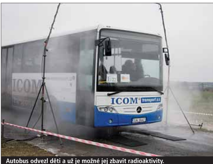
Autobus odvezl děti a už je možné jej zavit radioaktivitu.