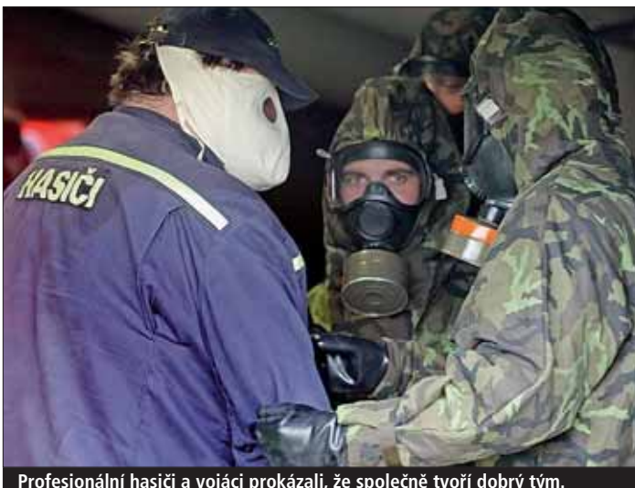
Profesionální hasiči a vojáci prokázali, že společně tvoří dobrý tým.