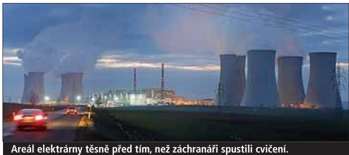
Areál elektrárny těsně před tím, než záchranáři spustili cvičení.