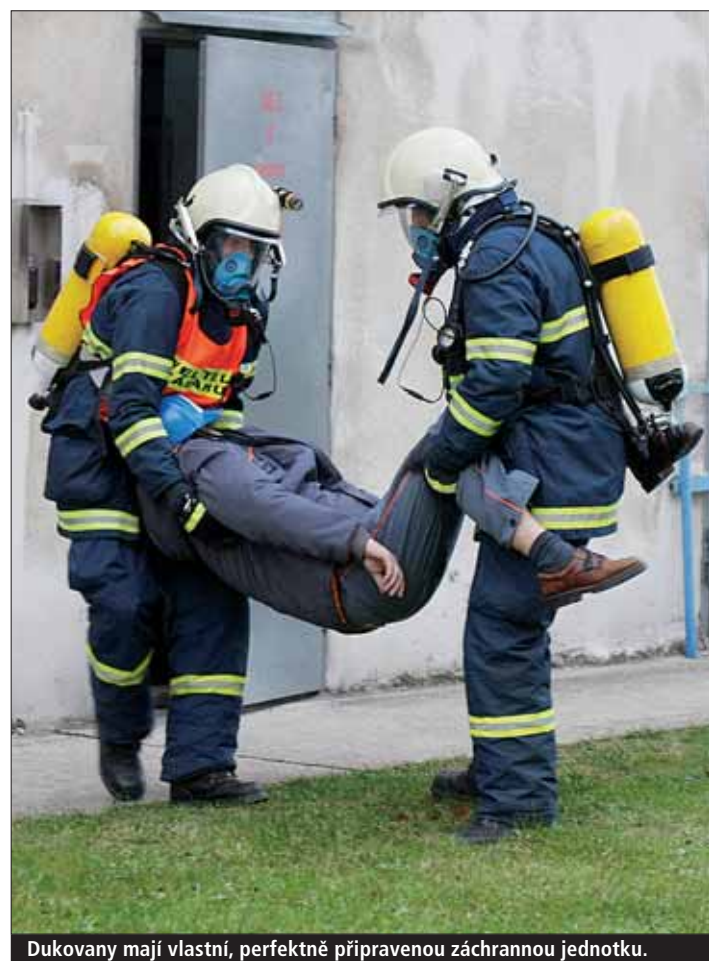
Dukovany mají vlastní, perfektně připravenou záchrannou jednotku.