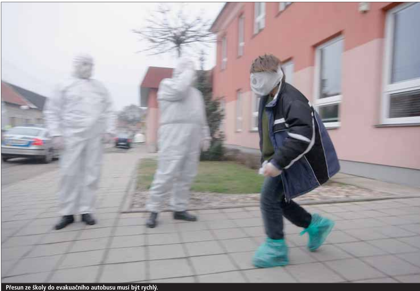
Přesun ze školy do evakuačního autobusu musí být rychlý.