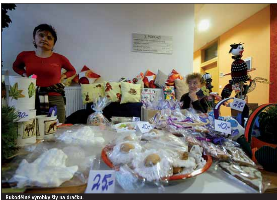
Rukodělné výrobky šly na dračku.