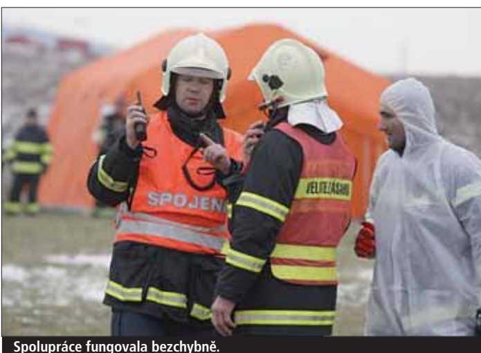
Spolupráce fungovala bezchybně.