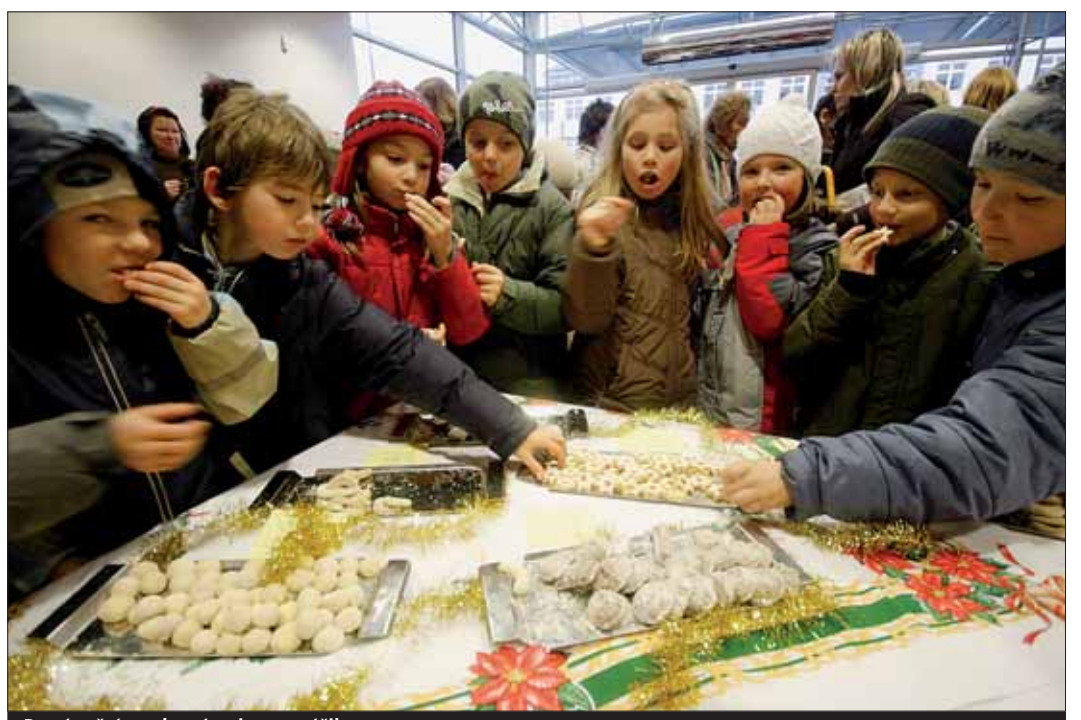
Po vánočním cukroví se jen zaprášilo.