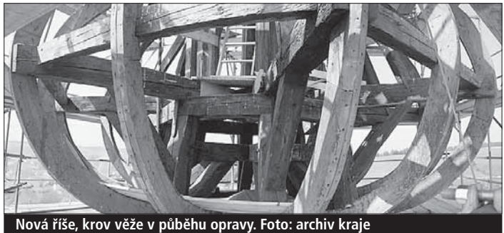
Nová říše, krov věže v průběhu opravy.