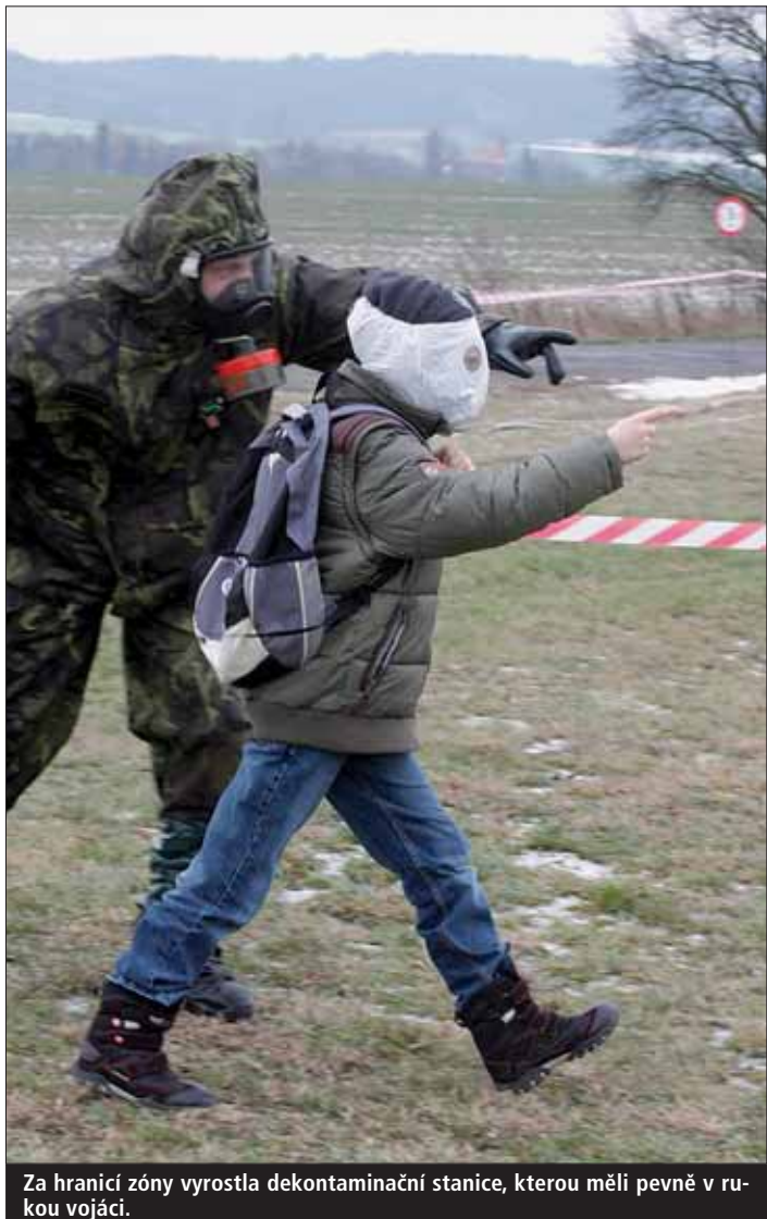
Za hranicí zóny vyrostla dekontaminační stanice, kterou měli pevně v rukou vojáci.