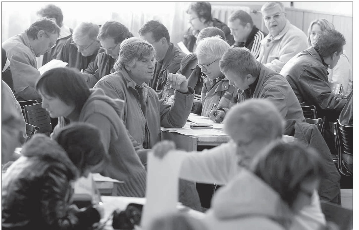
Úřad práce kvůli registraci propuštěných sklářů otevřel mimořádné přepážky ve světelském kulturním domě. Ten v prosinci praskal ve švech.

Světlá nad Sázavou, Jihlava (kid) • Zastupitelstvo Světla nad Sázavou nepřijalo nabídku kraje na spolupráci při zprostředkování bezúročných půjček pro zaměstnance, kteří nedostali plat za poslední měsíce v uzavřené sklárně. „Mrzí nás to tím více, že by to bývala byla rych-