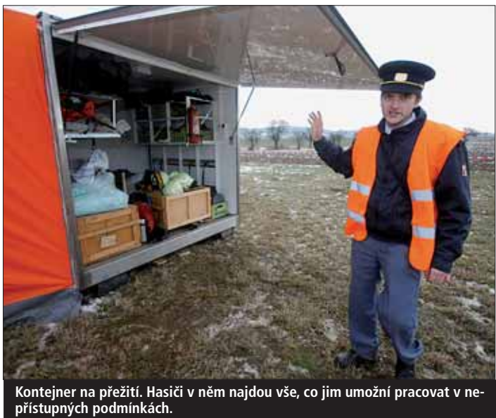
Kontejner na přežití. Hasiči v něm najdou vše, co jim umožní pracovat v nepřístných podmínkách.