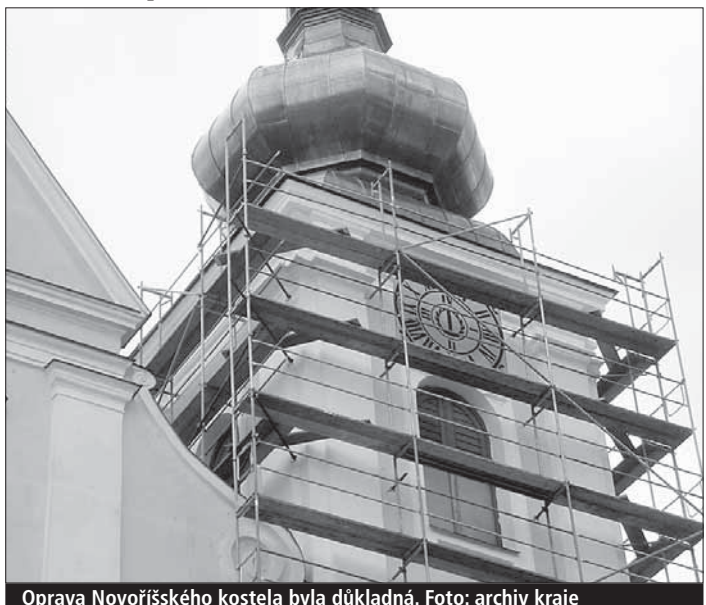
Oprava Novoříšského kostela byla důkladná.

Nejúspěšnějším žadatelem, který z norských fondů získal téměř 5,3 milionu korun, je Diakonie Česko-bratrské církve evangelické – středisko Myslibořice, která obnovuje střechu a unikátní krov pravého křídla barokního zámku v Myslibořicích. Dokončení této akce se přepokládá v polovině příštího roku.