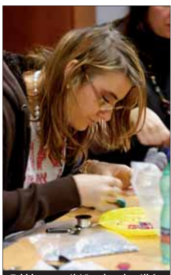
Takhle se vyrábí šperky z korálků.