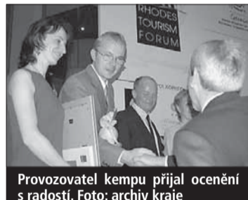
Provozovatel kempu přijal ocenění s radostí.

kladnými a jednoduchými způsoby. Cenu udělila nadace The Royal Awards for Sustainability během kongresu Rhodes Tourism Forum v Řecku. Vítězové z rukou představitelů vlády pořadatelské země získali také sošku Oikos, která představuje na jedné straně dopady cestovního ruchu na naši planetu a na druhé straně naději a úsilí lidí najít řešení těchto problémů.