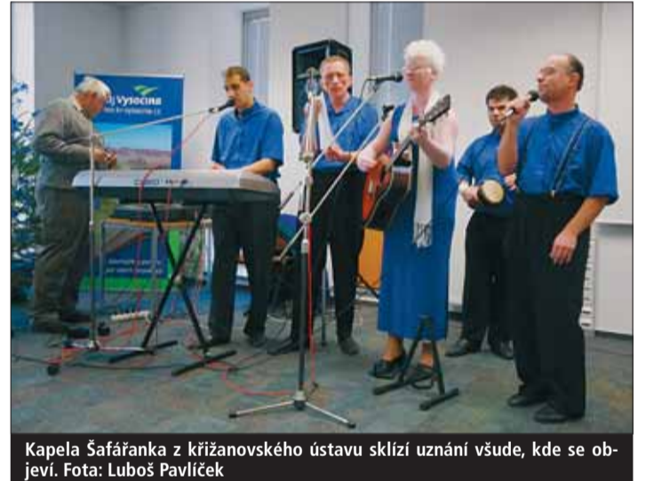
Kapela Šafařanka z křižanovského ústavu sklízí uznání všude, kde se objeví.