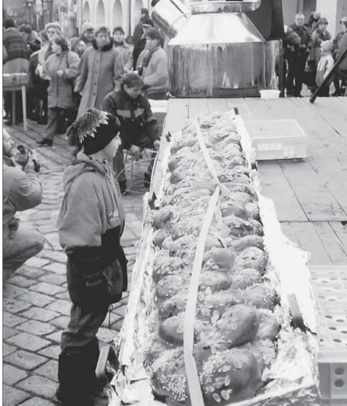
Čtyřmetrová vánočka uchvátí návštěvníky tradiční Zlaté neděle na pelhřimovském náměstí.