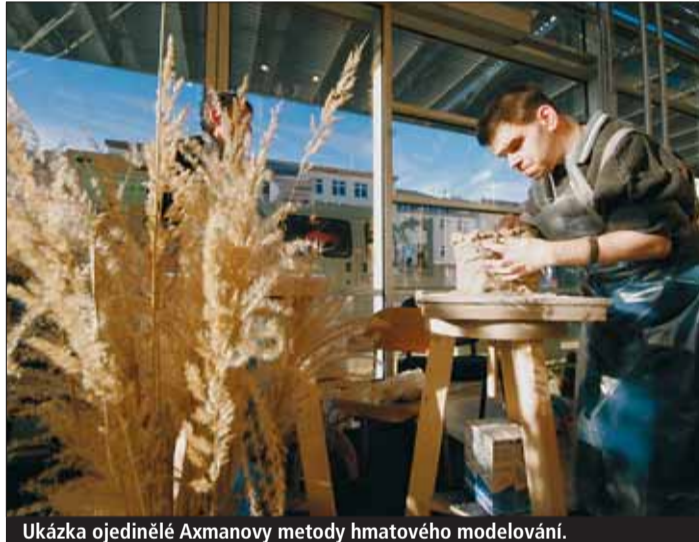
Ukázka ojedinělé Axmanovy metody hmatového modelování.