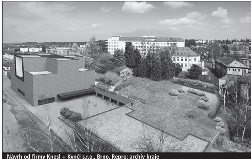
Návrh od firmy Knesl + Kynčl s.r.o., Brno.