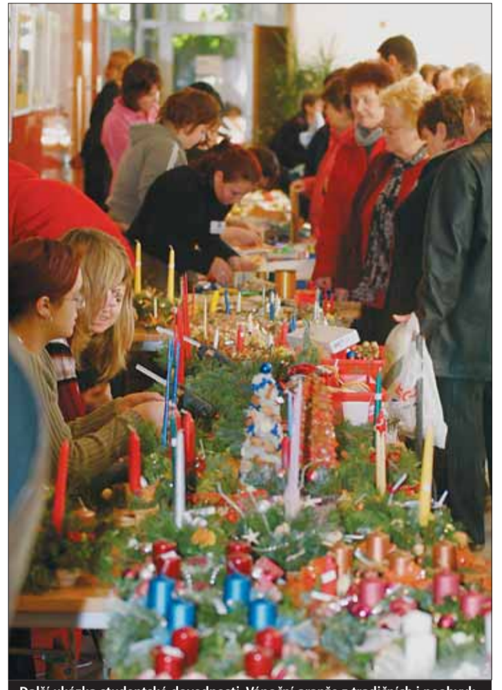
Další ukázka studentské dovednosti. Vánoční aranže z tradičních i neobvyklých materiálů.

i sociálních zařízení, celý den probíhal kulturní program. „Taková setkání krásně ukazují,