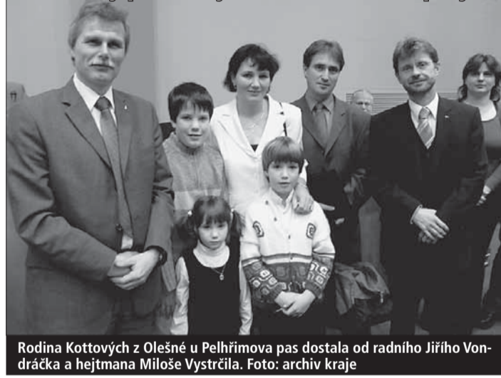
Rodina Kottových z Olešné u Pelhřimova pas dostala od radního Jiřího Vondráčka a hejtmána Miloše Vystrčila.

© Rodinný pas žádejte na www.rodinnepasy.cz