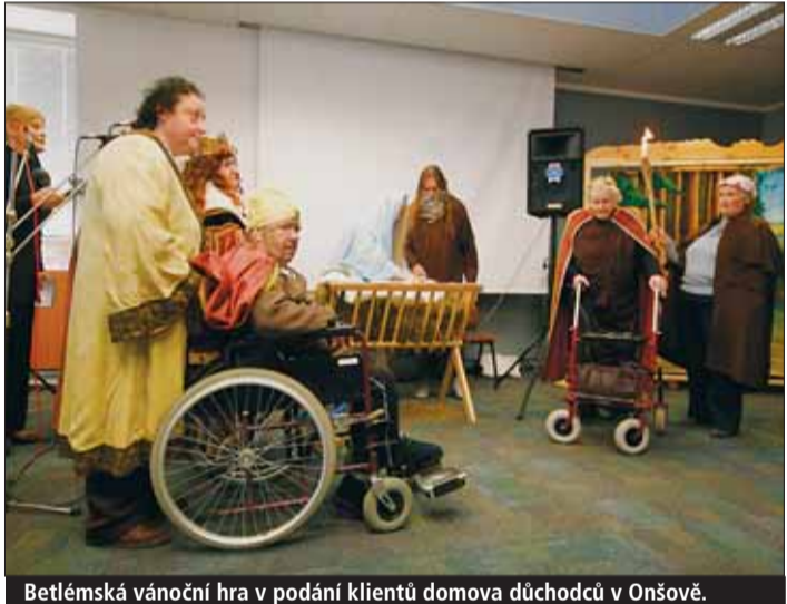
Betlémská vánoční hra v podání klientů domova důchodců v Onšově.

ni,“ řekl v této souvislosti krajský radní pro sociální věci Jiří Vondráček (KDU-ČSL).