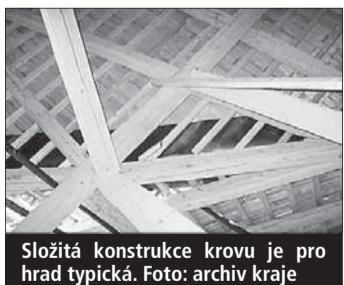
Složité konstrukce krovu je pro hrad typická.

Doupě (en, kid) • Krajský hrad Roštejn má opravenou další část