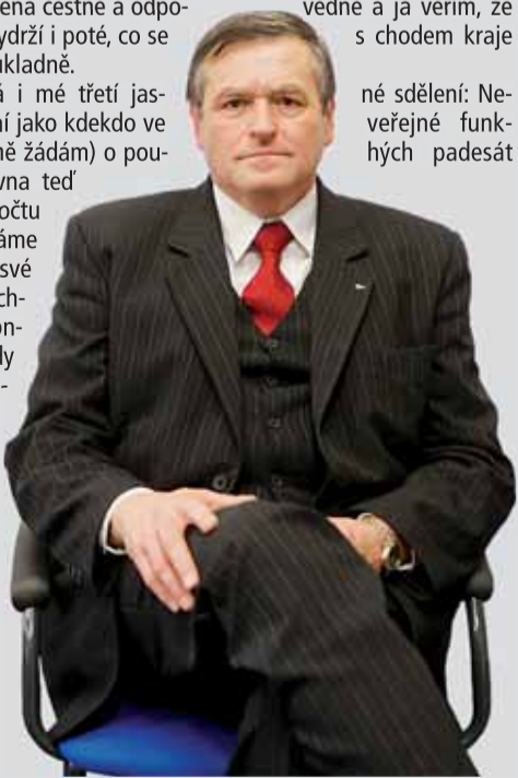
Jiří Běhounek hejtmán Vysočiny