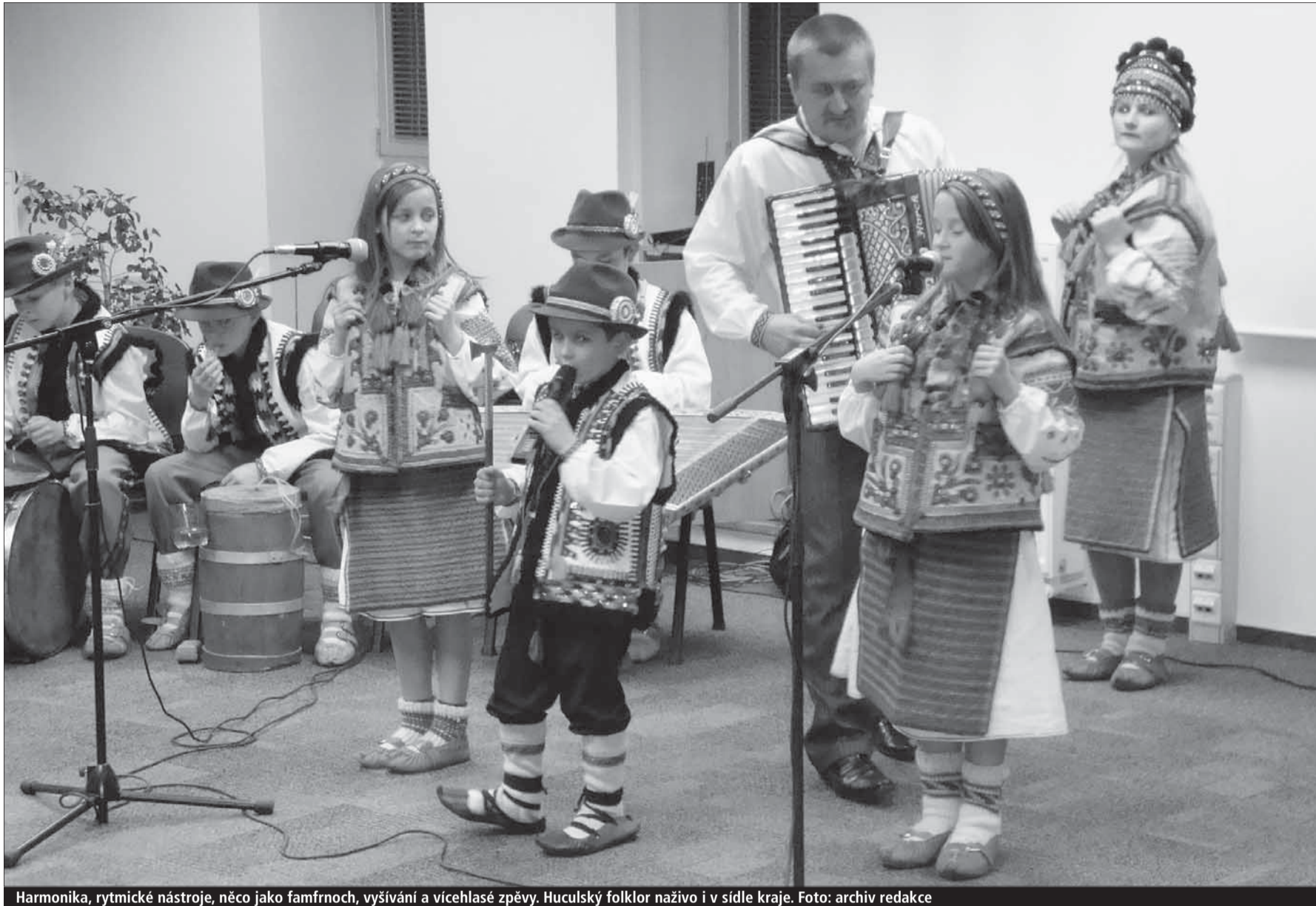
Harmonika, rytmické nástroje, něco jako famfrnoch, vyšívání a vícehlasé zpěvy. Huculský folklor naživo i v sídle kraje.

Vysočina, Zakarpatská oblast (kan, kid) • Společné písničky a tance, procházky po Telči i návštěvy škol. Tak vypadal program listopadové návštěvy školního folklorního souboru z Lazeštiny na partnerské Podkarpatské Rusi.