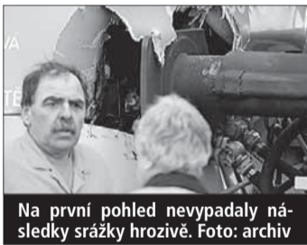
Na první pohled nevytáhla následky srážky hroznivě.

Ždírec nad Doubravou (kid) • Osm zraněných, z toho dva těžce. Taková je bilance listopadové srážky Regionovy a nákladního vlaku ve Ždírci nad Doubravou na Havlíčkobrodsku. Ačkoliv nehoda nevytáhla na první pohled nijak hroznivě, náraz byl prudký a nečekaný, což bylo příčinou zranění cestujících.