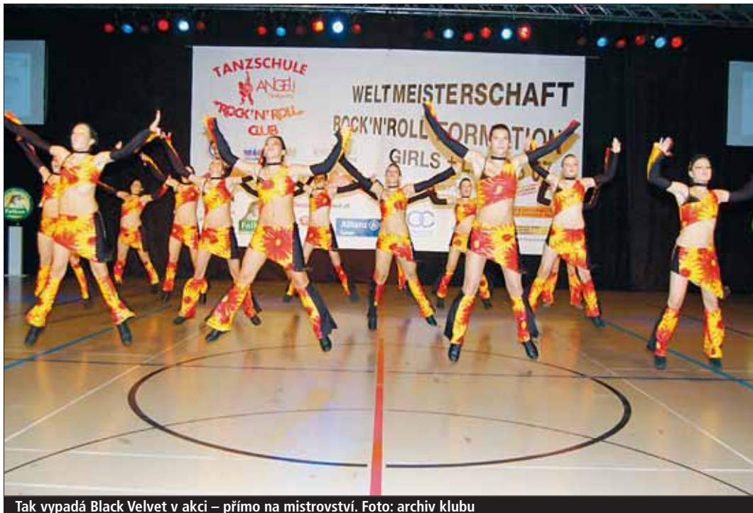
Tak vypadá Black Velvet v akci – přímo na mistrovství.

Jihlava (hak) • Vícemistryněmi světa v akrobatickém rokenrolu v kategorii dívčích formací se staly tanečnice z TnT Silueta Praha, které tančily pod názvem Magic. Jihlavská formace Black Velvet zanechala na mistrovství další velkou stopu svým umístěním mezi nejlepšími patnácti.