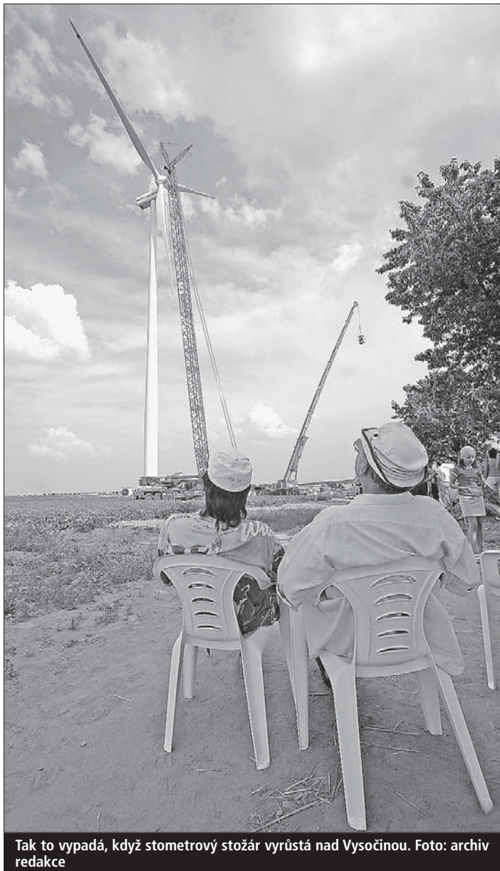
Tak to vypadá, když stometrový stožár vyrůstá nad Vysočinou.

Vysočina (kid) • Kraj připravuje na první listopad seminář pro obce, který je věnovaný problematice větrných elektráren. Zároveň vydá krajský úřad dokument, který bude shrnovat oprávnění a povinnosti obecních samospráv a správních úřadů při povolování výstavby větrných elektráren.