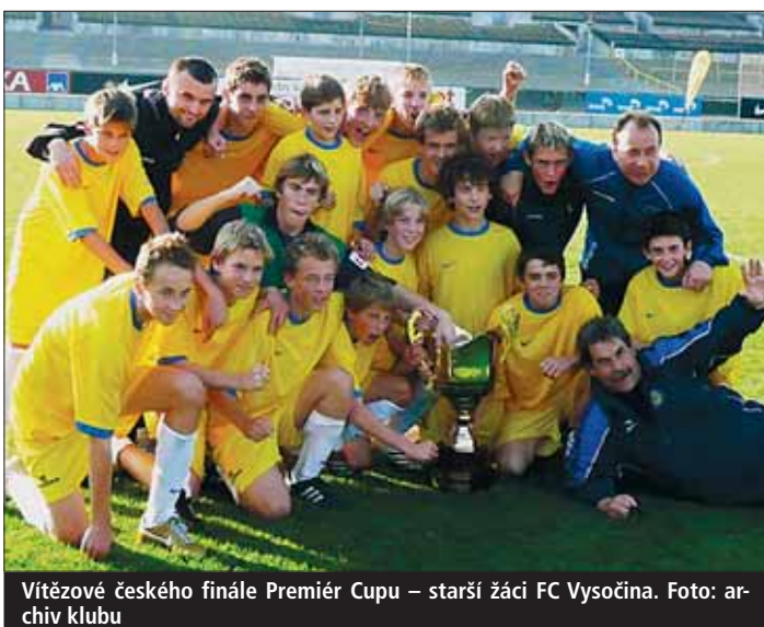
Vítězné českého finále Premier Cupu – starší žáci FC Vysočina.

V současnosti pod hlavičkou FC Vysočina Jihlava působí vedle dvou celků dospělých i čtyři mužstva dorostu, čtyři žákovské celky a čtyři výběry přípravy.