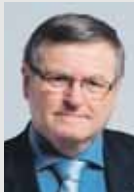
Jiří Běhounek (nez. za ČSSD) hejtman Kraje Vysočina