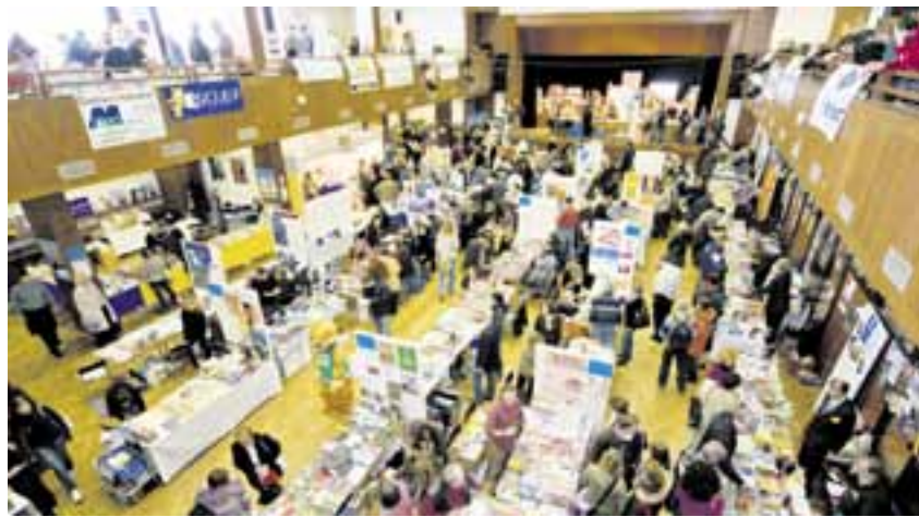
Během dvou dnů zavítá každoročně do prostor kulturního domu Ostrov v Havlíčkově Brodě okolo patnácti tisíc milovníků knih.