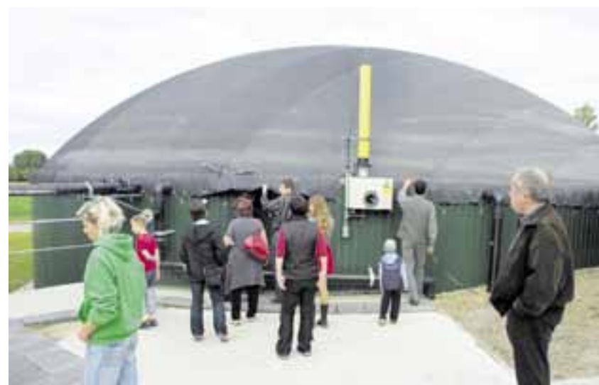
Na setkání hledali angažovaní možnosti pro využití budovy lesnického učiliště v Lesonicích.