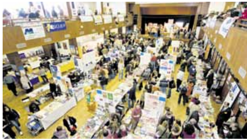
Během dvou dnů zavítá každoročně do prostor kulturního domu Ostrov v Havlíčkově Brodě okolo patnácti tisíc milovníků knih.