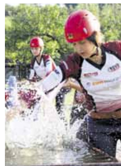
Nejen hasiči, ale i hasičky z Vysočiny patří mezi nejlepší v republice.