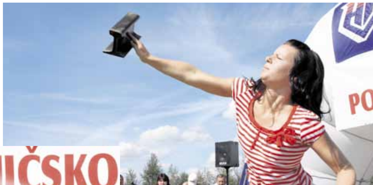
Účastníci soutěže změřili síly v řadě kategorií, fotografie ze souperení žen do čtyřiceti let.