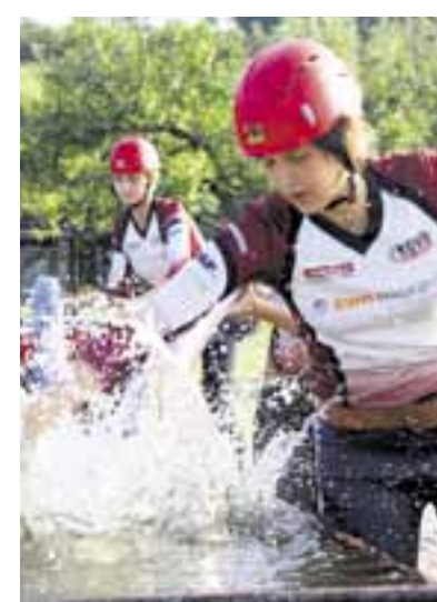
Nejen hasiči, ale i hasičky z Vysočiny patří mezi nejlepší v republice.