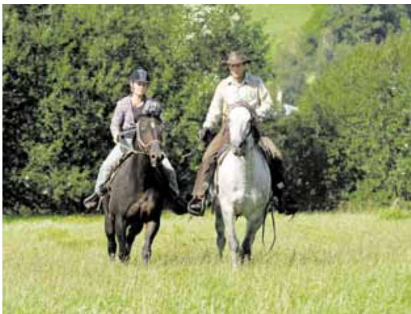
Vysočina nabízí od léta milovníkům jezdeckví 188 jezdeckých stanic a 864,5 kilometru hipotras.

„Značení v terénu probíhalo v období od srpna 2010 do září 2011 a na základě výběrového řízení ho zajišťovala firma SOTHIS CZ, s. r. o., která vyznačila 864,5 kilometru hipotras. Certifikáty získalo 150 jezdeckých stanic, které garantují odpovídající standard služeb pro koně i jejich jezdce,“ popsal Tomáš Škaryd (ČSSD), radní Kraje Vysočina pro oblast cestovního ruchu.