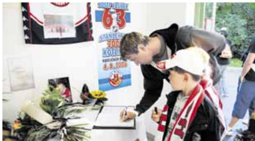
Do kondolenční listiny v havlíčkobrodské Kotlině se zapsaly stovky občanů.