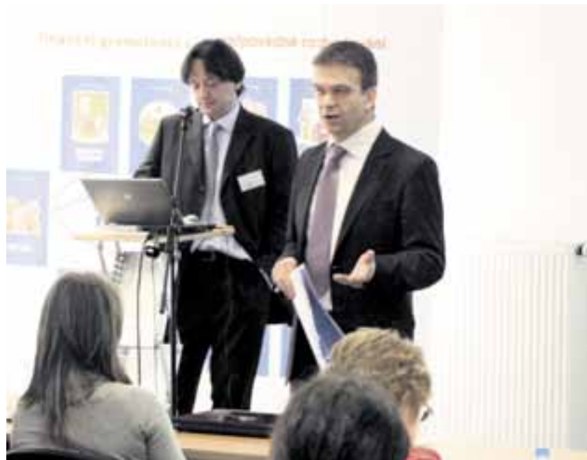
Projekt Rozumíme penězům v kraji Vysočina pomáhá žákům škol s orientací ve světě financí.