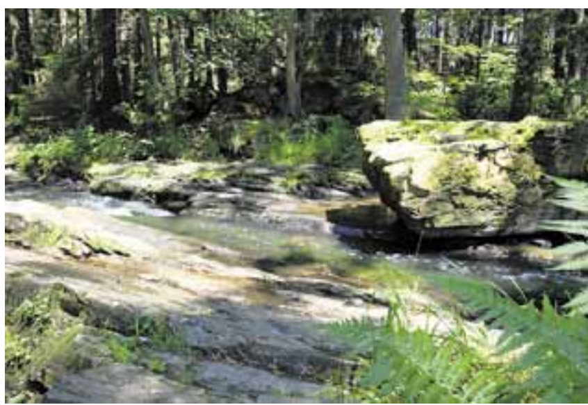
GPS souřadnice (Horní mlýn): 49°43'12.079"N, 15°41'52.734"E