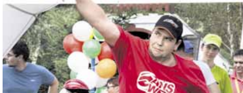
Kolejnice v Polničce létaly vzduchem už pojedenácté.