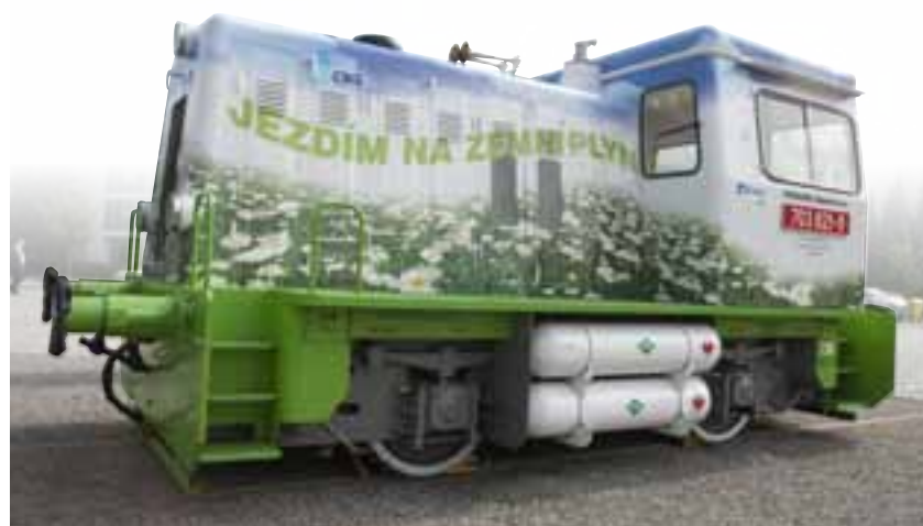
Barevná lokomotiva – nejen hezky vypadá, navíc je i ekologická

a expedice zboží urychlují, zkvalitňují a zároveň šetří provozní náklady. K účastníkům projektu patří například společnost Mašek, jejíž vertikální balicí stroj se postará o balení oleje do malých fóliových sáčků, společnost Albertina Trading, která zajistila kontrolní váhu a detektor kovů, společnost Ondrášek INK-JET System jako dodavatel špičkových