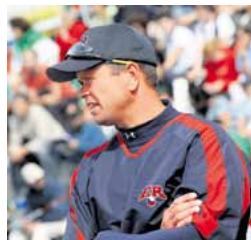
Hlavní trenér reprezentace ČR Jiří Kotek si pochvaloval podporu trebičského publika.