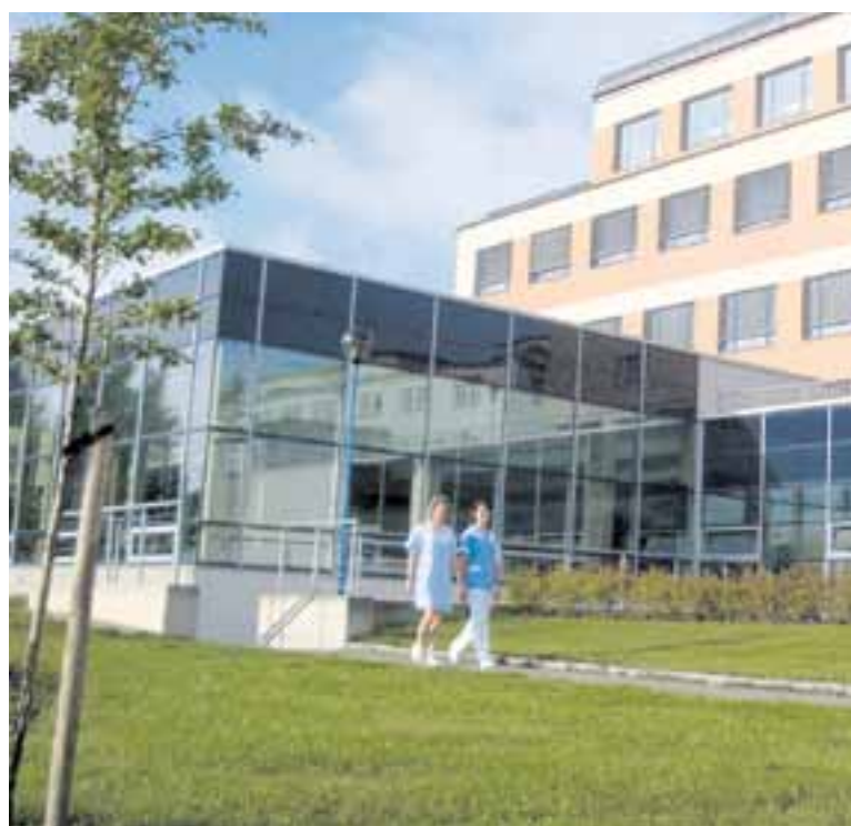
Novostavba pavilonu interních oborů Nemocnice Nové Město na Moravě.

Zrekonstruovaný pavilon pojme internu, neurologii, dialýzu a kompletně se k novému a už fungujícímu bazénu přestěhuje celá rehabilitace. V přízemí budou všechny ambulance se společnou recepcí. Pavilon nabídne také dvě patra se sto dvaceti lůžky a ve vrchním podlaží jednotku intenzivní péče společnou pro internu a neurologii. „Moc se těšíme, že našim pacientům interny, neurologie a rehabilitace konečně nabídneme důstojné prostředí. Zejména vůči pacientům bývalé interny jsme měli