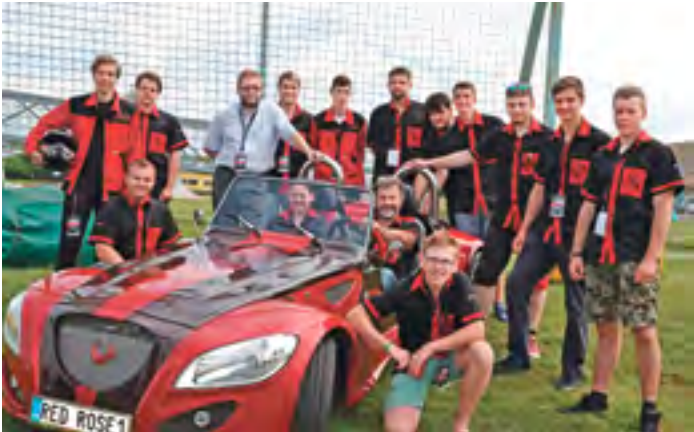
Vítězný automobil Red Rose studentů Střední školy průmyslové, technické a automobilní Jihlava.

Výsledky mohlo sedm týmů ovlivnit během čtyř bodovaných soutěží. Porovnávala se například přesná jízda nebo rychlost jízdy překážkovou dráhou. „Nenajdu dominovali v jízdě zručnosti, ale