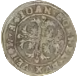
Stříbrný tolar památkáři datují do doby od konce 16. do první poloviny 17. století.

tricetileté války během švédského tažení, tedy na konci 40. let 17. století, kdy nedaleký hrad Pernštejn obléhali Švédové. Právě na Pernštejně by si nález mohla prohlédnout i veřejnost. „Rádi bychom se s hradem domluvili a poklad postavili třeba už od příští sezony. Jenom je to trochu komplikovanější vzhledem k tomu, že Pernštejn náleží Jihomoravskému kraji,“ podotkl David Zimola. Bystřický objev není na Vysočině za poslední dobu jediným. Minulý rok byla v lesním porostu nedaleko Humpolce náhodně nalezena keramická nádoba a v ní 341 ryzích zlatých a stříbrných mincí ražených na přelomu a v první polovině 17. století. Lucie Pátková