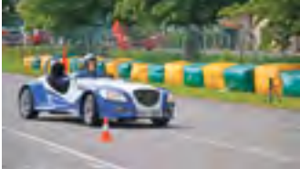
Největší výkon musely soutěžní Kaipany dokázat při jízdě, kde byla rozhodující rychlost.

ovládli i hodnocení Poháru designérů a konstruktérů. V soutěži zaměřené na marketing byla lepší Střední průmyslová škola Třebíč,“ doplnila informace k výsledkům radní Kraje Vysočina pro oblast školství, mládeže a sportu Jana Fialová (ČSSD).