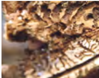
Dřevo napadené kůrovcem.