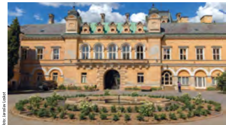
Dnešní podobu světlý zámek získal po roce 1869. Tehdy prošel rozsáhlými opravami pod vedením vídeňského architekta Svatoše.

Historie Havlíčkobrodská je do značné míry spjatá s příchodem německých kolonizátorů, kteří na Vysočinu začali přijíždět v první polovině 13. století kvůli těžbě stříbrné rudy. Počátky dějin Světlé nad Sázavou ale se stříbrem nejspíš nesouvisí. Přesný důvod jejího založení neznáme. Kroniky Světlou poprvé zmiňují už v roce 1207, tehdy šlo o vesnici náležející vilémovskému klásteru. Panské sídlo se v ní tehdy ještě nenacházelo. To se měnilo až skoro o dvě stě let později. Na konci 14. století si totiž tehdejší světlý vládce Štěpán ze Šternberka dal na břehu řeky Sázavy postavit malou tvrz. Dlouho si ji ale neužil. Po husitských válkách se totiž vládcem světlého panství stává Mikuláš Trčka z Lipy, který záhy přikoupil i Německý Brod, Lipnici či Habry. On ani jeho potomci se ale k rozšiřování středověké tvrze dlouho neměli.