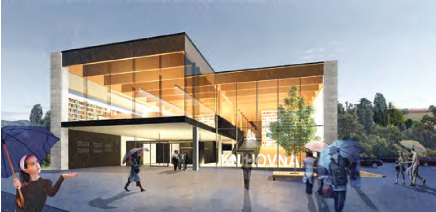
Součástí nové budovy Krajské knihovny Vysočiny v Havlíčkově Brodě bude také parkovací dům s 99 parkovacími místy a přilehlá obslužná silnice.

Plán na výstavbu nové Krajské knihovny Vysočiny urazil další kus cesty, když zástupci Havlíčkova Brodu a Kraje Vysočina vyjádřili podporu projektu. Nový objekt knihovny má v příštím roce začít růst na pozemku u brodského Kulturního domu Ostrov, kde se teď nachází provizorní parkoviště.