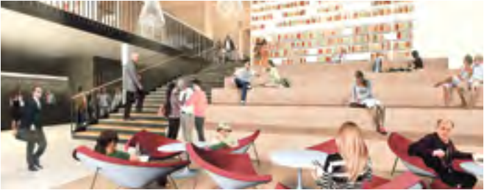
Stavbu nové knihovny v Brodě kraj plánoval několik let. Díky vstřícnému přístupu kraje a města a jejich společnému návrhu řešení situace by základní kámen měl být položen v roce 2017.