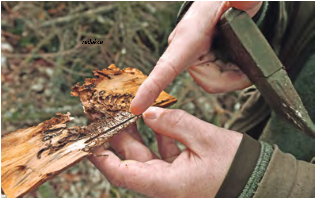
Kůrvec v poslední době neohroží jen v lesích, ale také v městských parcích.