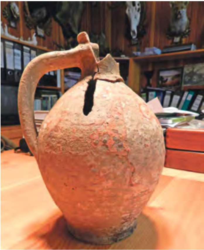
Místo lišky objevil šťastný nálezce v díře na svém pozemku malovaný keramický džbán, který nebyl prázdný.