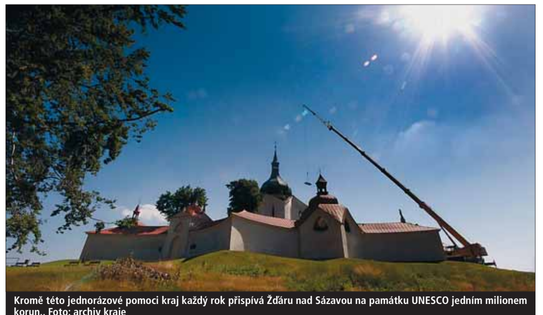
Kromě této jednorázové pomoci kraj každý rok přispívá Žďáru nad Sázavou na památku UNESCO jedním milionem korun..

„Vedl nás k tomu zájem zabránit dalšímu nárůstu vzniklých škod, který kvůli odkrytí střechy památce UNESCO akutně hrozí,“ uvedl hejtman Vysočiny Miloš Vystrčil (ODS) po mimořádném zasedání rady, která o poskytnutí pomoci rozhodla. Smršť na kostele zničila asi pětinu střechy, vítr strnul i část trámů z krovu. Vzhledem k tomu, že teprve před několika týdny skončila dlouhá rekonstrukce kopule hlavní lodi kostela, hrozily při průtazích opravy střechy nenahraditelné škody.