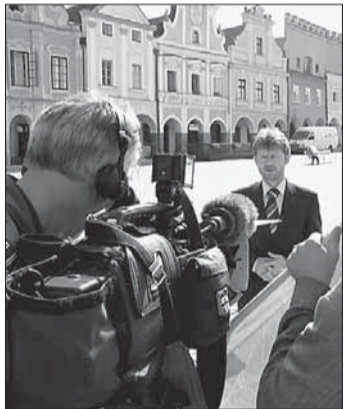
Hejtmán Miloš Vystrčil v Telči ve společnosti štábu rakouské ORF.

Vysočina, Dolní Rakousko (jis, kid) • Na Dolnorakouskou zemskou výstavu bude návštěvníky lákat televizní spot. V pozvání na Vysočinu se objeví i náměsítní Zachariáše z Hradce a zámek