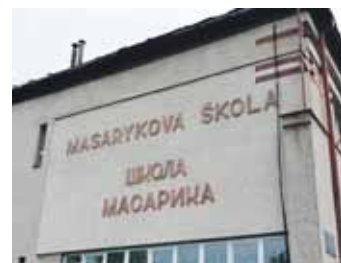
Základní škola z doby společného státu v městě Svaljava nese jméno prvního československého prezidenta.

Od roku 2007 prostřednictvím fondu ViZa kraj investoval do veřejně prospěšných zařízení 50 milionů korun. Stejnou měrou na tyto akce přispívá i zahraniční