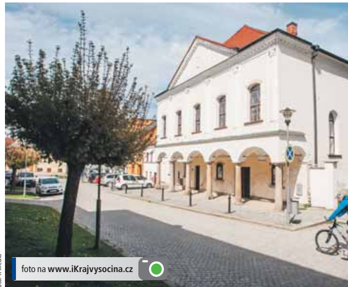
Kromě výstavy o Kafkovi jsou v synagoze také expozice o historii tamní židovské obce a o osudech vybraných židovských rodin.

židovská menšina vždy byla velice početná – na začátku devatenáctého století židé v Třebšti tvořili dokonce pětinu obyvatel.