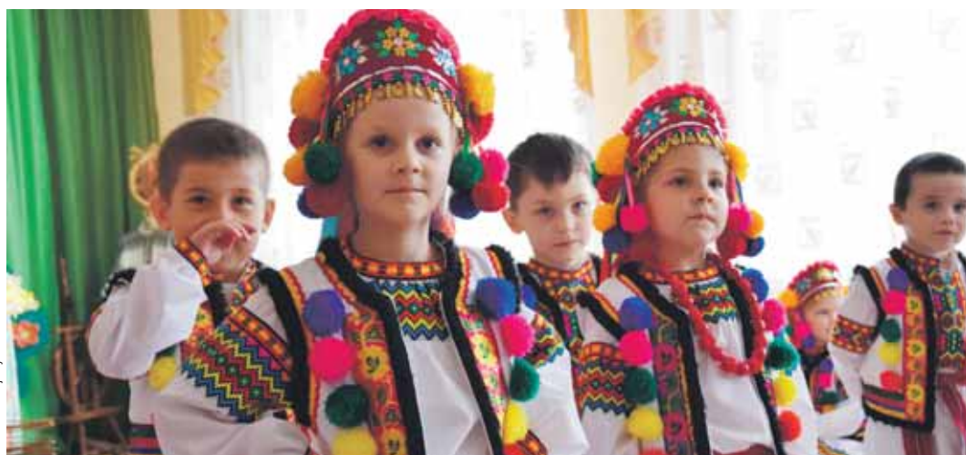
Vystoupení dětí v mateřské školce v obci Ilniča (Iršavský okres), jejíž oprava byla jedním z investičních projektů Kraje Vysočina.

strana. Díky rozdělení investic tak partneri v Zakarpátí podpořili 100 miliony korun více než 150 společných projektů.