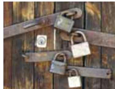
4 Dobré rady před dovolenou Co dělat a co ne, abychom se po dovolené shledali s majetkem