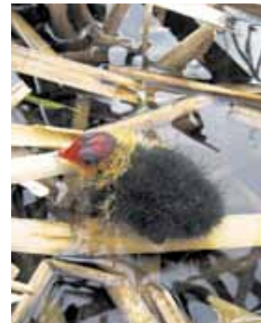
Mláďe lysky černé je charakteristické červeným zbarvením hlavy.

Kromě zvláště chráněných území existují i území, kde zaslouhuje ochranu krajina jako taková, tedy hodnotný krajinný ráz. „Ve většině případů můžeme