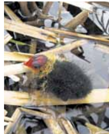
Mláďe lisky černé je charakteristické červeným zbarvením hlavy.

Kromě zvláště chráněných území existují i území, kde zaslouhuje ochranu krajina jako taková, tedy hodnotný krajinný ráz. „Ve většině případů můžeme