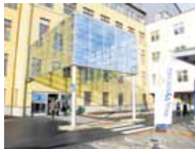
2 Stavba Vysočiny 2010 Ceny předány v Humpolci. Tak zas za rok, v Jaroměřicích nad Rokytnou