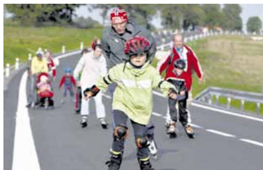
V loňském roce kraj Vysočina díky dotaci ROP Jihovýchod otevřel zcela novou silnici mezi největší jihlavskou průmyslovou zónou a dálnicí D1. Ještě před těžkými vozy ji vyzkoušela loni v září na bruslích a kolech jihlavská veřejnost.

Více než dvě stovky projektů na Vysočině čerpají v současnosti dotace z Evropského fondu pro regionální rozvoj. Nejvíce peněz směřuje do zdravotnictví (více než 600 milionů korun) a do dopravy, kde bylo zmodernizováno 222 kilometrů silnic II. a III. třídy. Díky evropským dotacím změnila svou tvář třináctka památek.