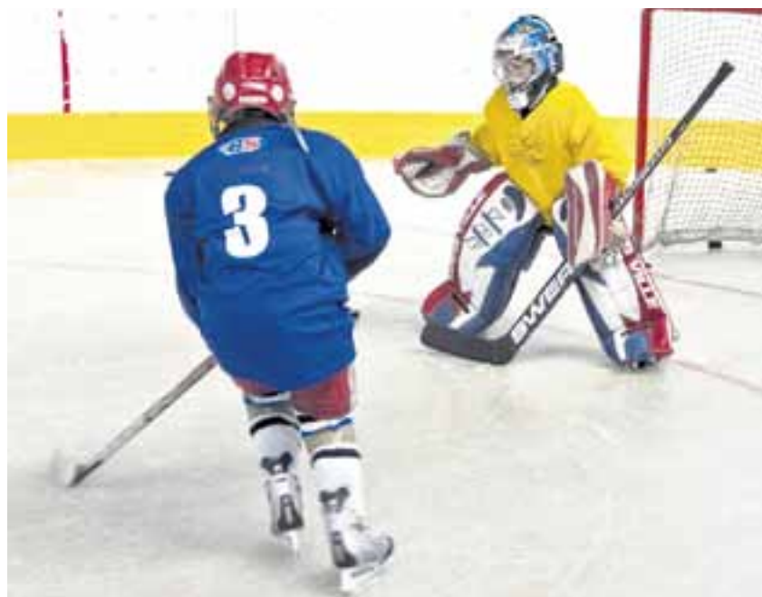
Mladí Češi a Finové se budou společně zdokonalovat v hokejových dovednostech.

Myšlenka uspořádat česko-finskou hokejovou školu se zrodila zhruba před dvěma lety. „Nejdůležitější a nejnáročnější částí ale bylo, jak projekt zafinancovat. Kdyby nebylo kraje Vysočina, prostředky bychom dávali dohromady jen těžko. Jsem vděčný kraji Vysočina, protože se stal základem stavebním kamenem, na který se nabalovali další sponzoři, kteří nám pomohli rozpočet, dosahující téměř 700 tisíc