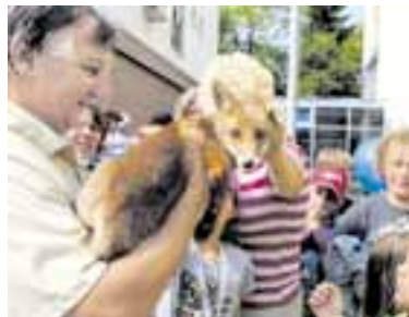
3 Den otevřených dveří Objekt krajského úřadu hostil opět stovky lidí včetně školáků