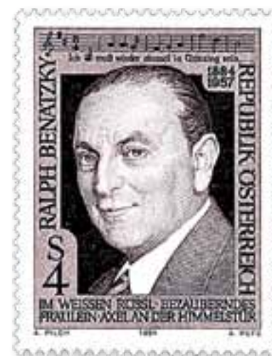
*5. 6. 1884 Moravské Budějovice †16. 10. 1957 Zürich

V Moravských Budějovicích se v rodině ředitele školy narodil 5. června 1884 Rudolf Josef František Benatzky, který sehrál významnou úlohu v evropské hudbě. V Praze se stal žákem Antonína Dvořáka a v Mnichově studoval u Felixe Mottla. Na univerzitě ve Vídni promoval prací Goethe a lidová píseň v roce 1909 a nastoupil jako dirigent Malého divadla v Mnichově, odkud přechází do Norimberka, později Berlína a Zürichu.