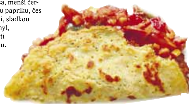
text a foto: Monika Fiedlerová Autor receptu: Jan Pavlíček

Pokud také rádi trávíte čas v kuchyni a znáte recepty typické pro náš kraj stejně jako Jan Pavlíček, stačí nám je zaslat. Nejlepší recepty otiskneme a autora odměníme.