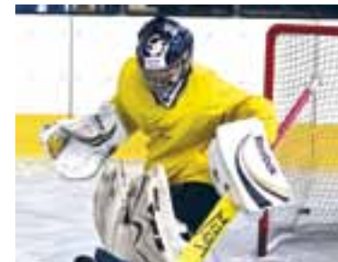
8 Mezinárodní hokejové mládež Projekt podpořený krajem Vysočina zatím jen s Finy. Ale zájem prý poroste