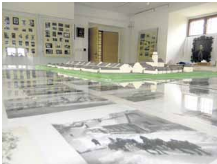
Fotografie vystavené ve žďárském muzeu ukazují někdejší život ve Žďáru.

Žďáráci – tak se jmenuje výstava, která se do září koná v Regionálním muzeu ve Žďáru nad Sázavou. Jak už samotný název napovídá, výstava nabízí pohled do tváří Žďáráků od druhé poloviny 19. století až po rok 1989. Nejsou to ale jenom tváře, které můžete ve žďárském muzeu spatřit. „Opět je tu instalován model města kolem roku 1850. Zástavba se měnila, takže lidé vidí, jak kdysi Žďár vypadal,