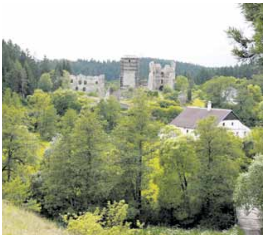
GPS souřadnice: 49°20'1.51"N, 15°43'32.751"E.

Hrad byl založen nejspíše v 80. letech 13. století. Po roce 1360, kdy došlo k rozsáhlé přestavbě, měl hrad důležitou úlohu, protože hájil zájmy markrabaty proti Jihlavě. Od roku 1378 měli Rokštejn v zástavě Valdštejnové, kteří ho později