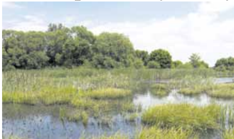
Různorodé porosty vytvářejí na Starém Příseckém rybníce bohaté příležitosti pro hnízdění vodních ptáků.

Rybník Obecník je evropsky významnou lokalitou a jeho vybrán byl na základě celorepublikového mapování vzácných přírodních území Natura 2000. Zabírá plochu 4,85 hektaru u Horní Libochové na Žďársku a byl jmenován chráněnou oblastí díky vzácné trávě puchýřce útlé.