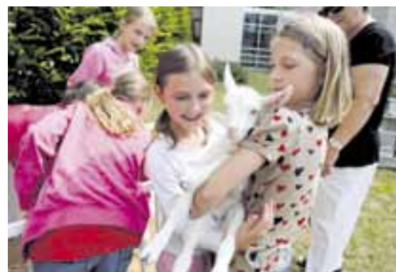
Dětské návštěvníky zaujala především třídní kůzlátka, která si mohli pohladit i pochovat.