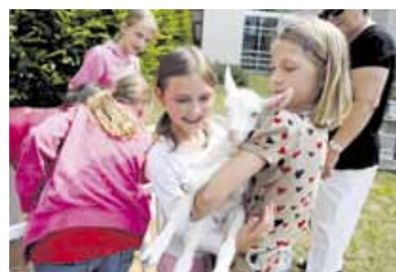
Dětské návštěvníky zaujala především třídní kůzlátka, která si mohli pohladit i pochovat.