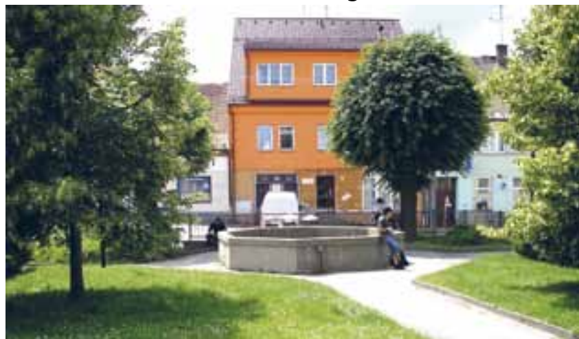
Místo, na kterém plánují v Křižanově umístit sochu sv. Zdislavy.

V Křižanově na Žďársku se rozhodli, že připomenou svou slavnou rodačku, která zde žila ve 13. století. „Chtěli bychom zřídit na náměstí v Křižanově památník naší celoevropsky i celosvětově známé nejslavnější občance a rodačky,