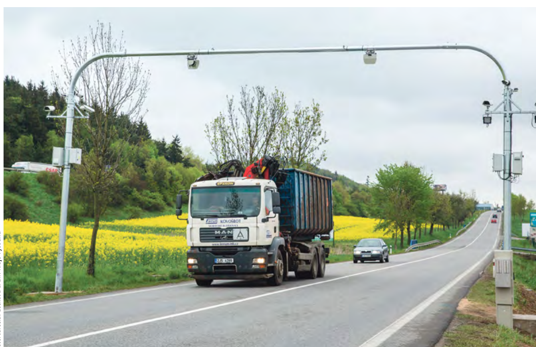
Váhu tvoří dynamické prahy a indukční smyčky s příslušenstvím, kamery pro rozpoznání registračních značek a moderní software napojený na odbavovací pracoviště.

dopravních specialistů Kraje Vysočina z nich může být přetížena až pětina.