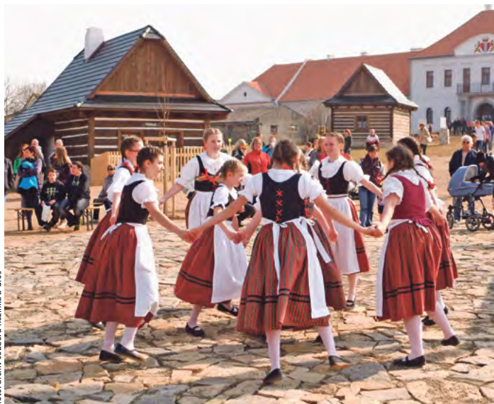
Tanečnice ze souboru Rožínka se představily také na Slavnostech jara v bystrickém Edenu.