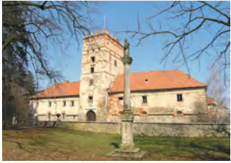
Pohled na zámek Brtnice na Jihlavsku z přílehlého parku.