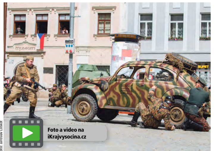
Masarykovo náměstí v Jihlavě se 7. května vrátilo do dob konce 2. světové války. Proběhla zde komentovaná bitva Klubu vojenské historie Elbe Vrchlabí a Klubu vojenské historie Diverzanti z Brandenburku Třebíč. Přehlídka vyvrcholila závěrečným defilé, které účinkující věnovali všem zbytečně padlým vojákům. Veřejnost si pak mohla prohlédnout zbraně i dobovou techniku. Ukázkou bitvy si nenechalo ujít asi patnáct set diváků.

Pokud také rádi trávíte čas v kuchyni a máte ve svém receptáři zajímavý recept na regionální pokrm z Vysočiny, o který byste se chtěli podělit s ostatními, zašlete nám ho na adresu redakce. Autora zveřejněného receptu oceníme.