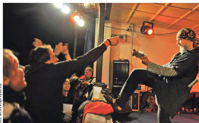
Nekomerční multižánrový festival Otevřeno Jimramov 2014 se koná bez přerušení 25 let.