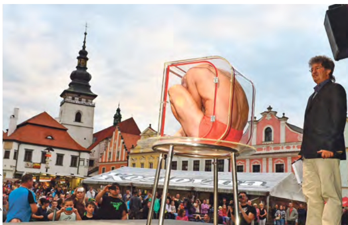
Muž v krabici se už na Festivalu rekordů v Pelhřimově představil, další rekordy budou k vidění v polovině června.

Představí se mimo jiné ABBA Stars revival, koncertní show skupiny rekordního počtu hráčů na ukulele, silák-legenda Železný Zekon, folková skupina Sem & tam. K vidění bude Trampské muzeum, králičí dostihy, Alena