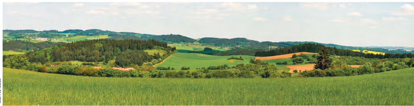
Panoramatický výhled z Jalovce nabízející v létě i v zimě silný zážitek.

Když se řekne Jalovec, mnozí z čtenářů si jistě vybaví sjezdovku, která je na Vysočině jednou z nejnavštěvovanějších. Byli jste zde ale už někdy v jiném než zimním období? Pokud ne, mohu doporučit.