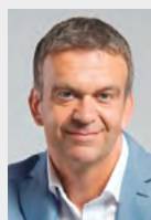
Vladimír Novotný (ČSSD) náměstek hejtmana Kraje Vysočina