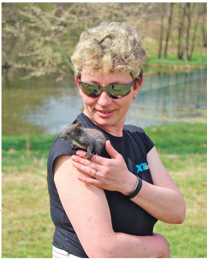
Některé chráněnce stanice si návštěvníci můžou prohlédnout opravdu z blízka.