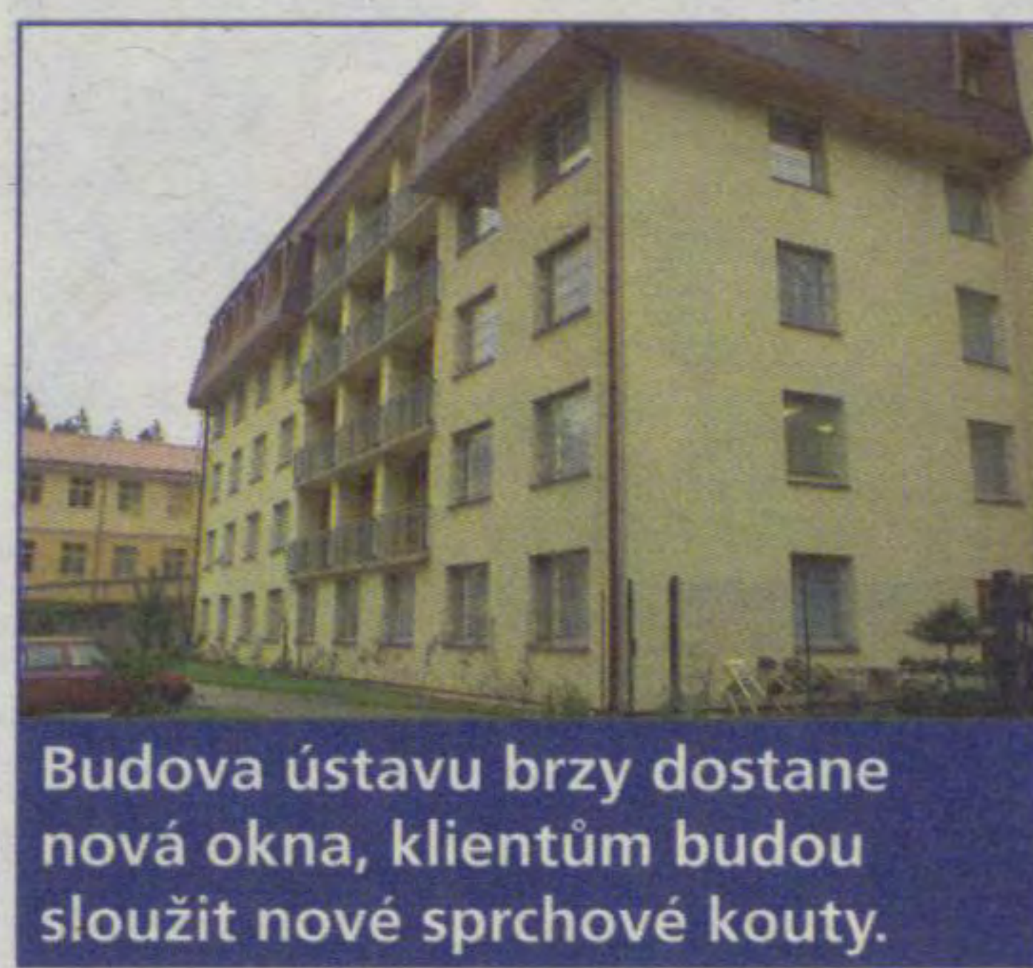
Budova ústavu brzy dostane nová okna, klientům budou sloužit nové sprchové kouty.

Krajský Ústav sociální péče v Háji u Ledče nad Sázavou projde v letošním roce rekonstrukcí. Práce za zhruba pět milionů korun začnou ještě před prázdninami a skončí na přelomu listopadu a prosince.