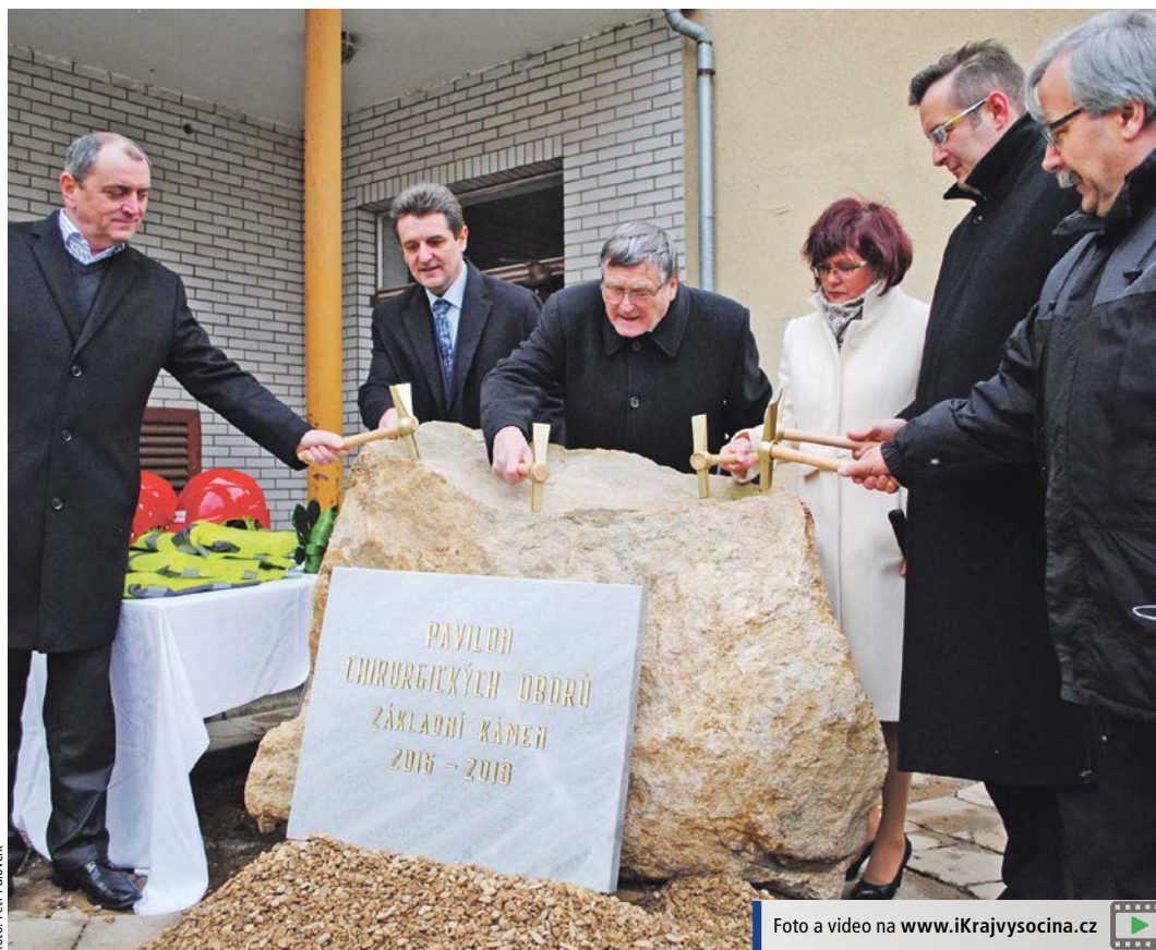
Základní kámen byl vyroben z mramorové pracovní desky laboratorních stolů, které bývaly součástí pavilonu A určeného k demolicí. Kládkem silně zaklepal také hejtman Kraje Vysočina Jiří Běhounek (uprostřed).

Rekonstrukce interny Nemocnice Jihlava a přestavba pavilonu 13 Nemocnice Havlíčkův Brod jsou dalšími letošními investičními akcemi Kraje Vysočina ve zdravotnictví. Oprava v Jihlavě bude stát 308 milionů korun, v Havlíčkově Brodě 72 milionů.