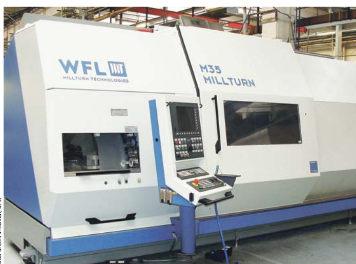
Multifunkční obráběcí centrum WFL M35 využívá Jihlavan, a. s., pro přesnou výrobu dílů určených pro letectví.