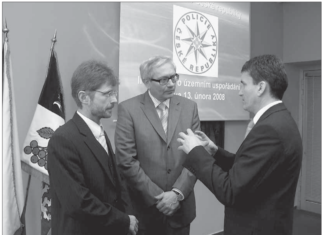
Policejní prezident Oldřich Martinů vysvětluje hejtmánovi Vysočiny Miloši Vystrčilovi a karlovarskému hejtmánovi Josefu Pavlovi principy reformy policie.

telství v Jihlavě. „Budova má po odchodu okresního soudu volnou kapacitu a náklady na její rekonstrukci a přizpůsobení by neměly být příliš vysoké. Dáváme však přednost kvalitnímu projektu a pečlivé, pro-