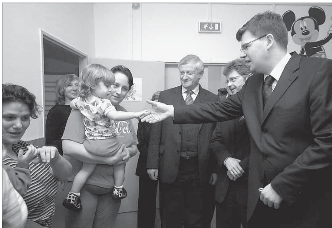
Ministr Jiří Pospíšil se zdraví s obyvatelkami nejmodernější české věznice. Ta vznikla v přestavěném a rozšířeném objektu bývalé školy v přírodě ve Světle nad Sázavou. Věznice je určena pro ženy a jako jediná v naší zemi umožňuje umístění matek s dětmi ve věku do tří let.

Postupně se pak pobočka transformuje do plnohodnotného krajského soudu. „Bude nutné přesvědčit některé soudce z krajského soudu, aby byli ochotni změnit své působení a přesunout se na Vysočinu. To znamená, že vznik nově-